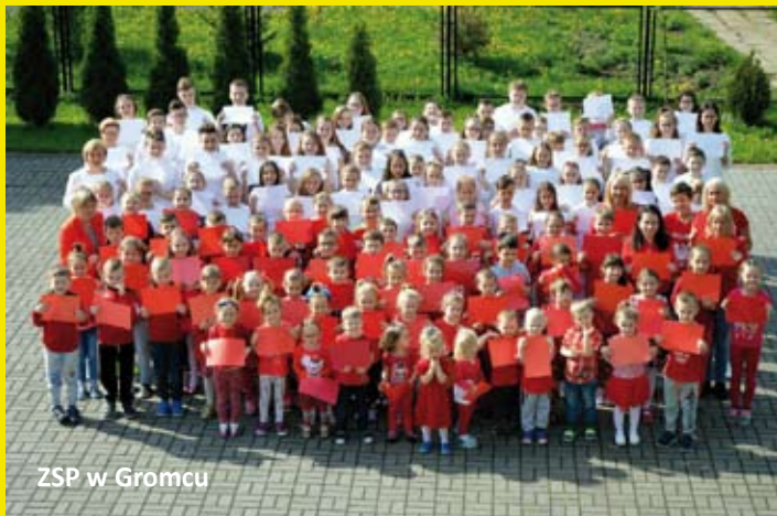
ZSP w Gromcu

W tym roku obchodzimy setną rocznicę odzyskania niepodległości. Z tej okazji uczniowie, nauczyciele i pracownicy placówek oświatowych w gminie włączyli się do ogólnopolskiej akcji. 9 listopada przyszli do szkół ubrani w barwy narodowe, a o 11:11 zaśpiewali hymn Polski.