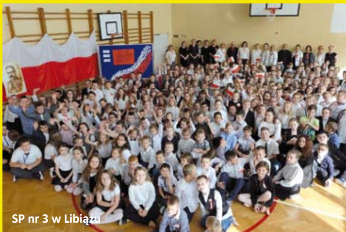
SP nr 3 w Libiążu