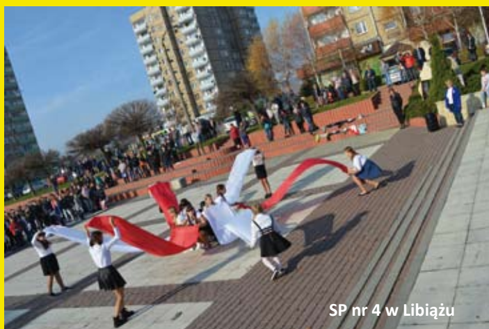
SP nr 4 w Libiążu