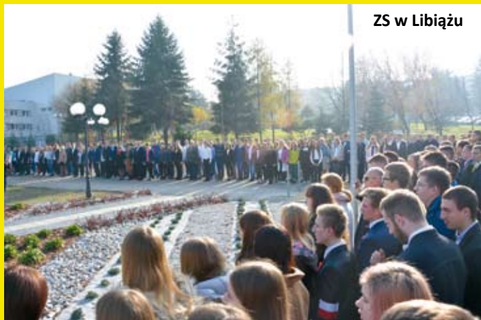
ZS w Libiążu