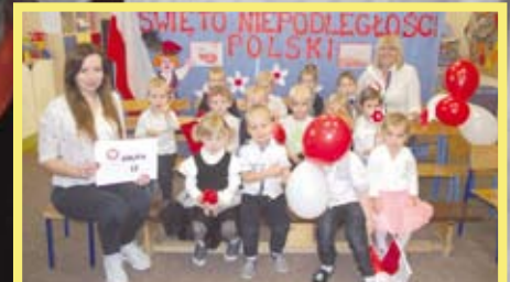
100 LAT NIEPODLEGŁOŚCI