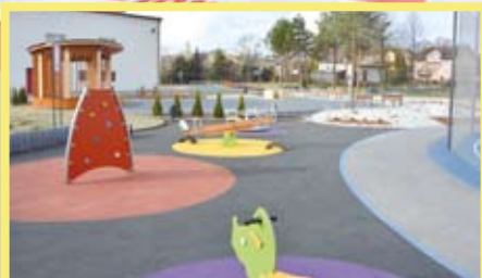
KOMPLEKS NA MOCZYDŁE