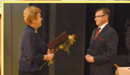
NOWA KADENCJA SAMORZĄDU