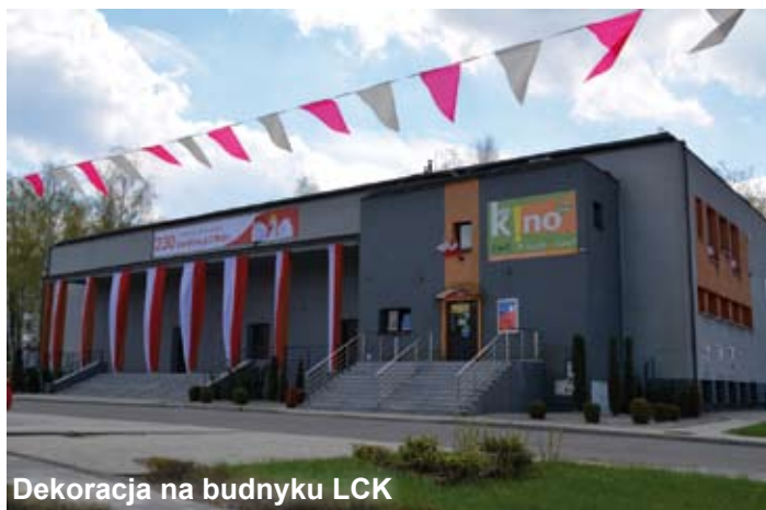
Dekoracja na budynku LCK

Wiele atrakcji szykujemy na wakacje. W zeszłym roku Libiąskie Lato Artystyczne się sprawdziło i chętnie zarówno młodzi, jak i starsi uczestniczyli w proponowanych przez nas wydarzeniach na scenie pod filarami, w tym roku tę formułę rozbudujemy i wzbogacimy. Dla dzieci i młodzieży proponujemy cykl wydarzeń zatytułowanych Uśmiechnięte Wakacje z LCK.