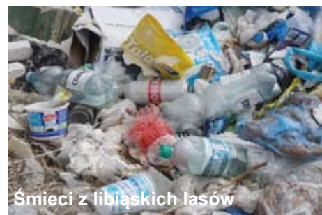
Śmieci z libiąskich lasów

- Cieszę się, że w naszej akcji, pod pa-