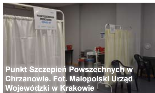
Punkt Szczepień Powszechnych w Chrzanowie.

Dyżurują w nim m.in. pracownicy instytucji kultury, w tym Libiąskiego Centrum Kultury. Dziennie punkt jest w stanie podać nawet 700 dawek szczepionki. Obok gminy Libiąż zakup lodówek wsparł także powiat chrzanowski oraz pozostałe cztery gminy: Alwernia, Babice, Chrzanów i Trzebinia.