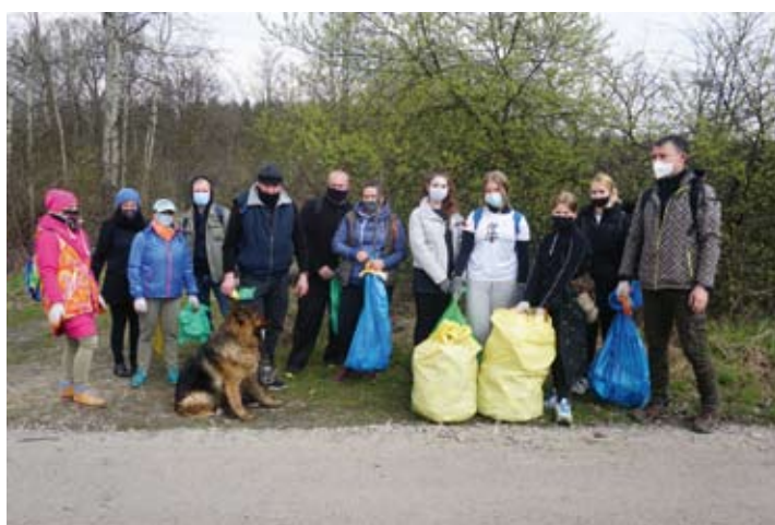
W akcji wzięło udział kilkanaście osób