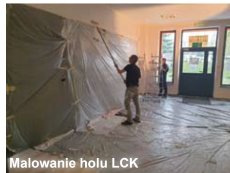
Malowanie holu LCK