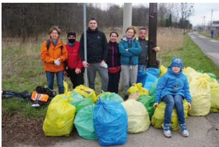
Uczestnicy akcji z zebranymi śmieciami

Każdy z uczestników otrzymał w nagrodę drobny gadżet ufundowany przez Nadwiślańską Agencję Turystyczną, która także wsparła akcję.