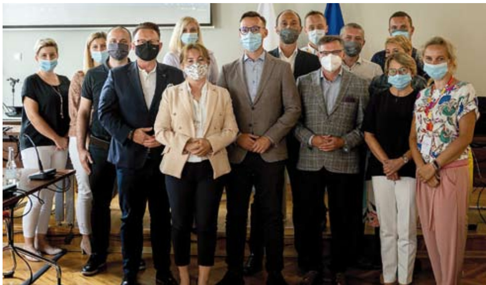
Założyciele Stowarzyszenia "Aglomeracja Chrzanowska"