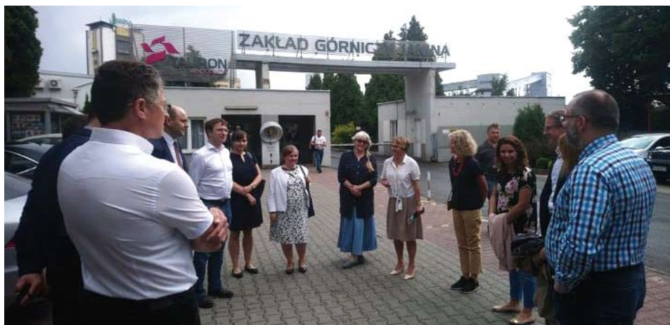
Inauguracja spotkania przy Zakładzie Górniczym Janina

J ak na co dzień funkcjonuje gmina górnicza taka jak Libiąż, jakie ma problemy i jakie wyzwania czekają ją w kolejnych latach w związku z dekarbonizacją? O tym wszystkim rozmawiali przedstawiciele Departamentu Zrównoważonego Rozwoju Urzędu Marszałkowskiego w Krakowie z doradcami firmy PWC, Głównego Instytutu Górnictwa w Katowicach oraz Forum Energii odpowiedzialni za przygotowanie Terytorialnego Planu Sprawiedliwej Transformacji Małopolski Zachodniej. Dokument został już przyjęty przez zarząd województwa małopolskiego.