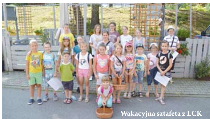
Wakacyjna sztafeta z LCK