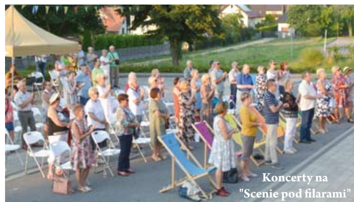
Koncerty na "Scenie pod filarami"

Od jesieni w LCK wracają zajęcia stacjonarne dla dzieci, młodzieży i dorosłych. Będzie w czym wybierać. Szykujemy uruchomienie m.in. baletu, robotyki dla juniora, warsztatów: plastycznych, rękodzielniczych, fotograficznych, zajęć z gliną, teatru lalkowego i koronki klockowej. We wrześniu ruszą kursy kompetencji cyfrowych – grafiki i projektowania, a także korzystania z mediów społecznościowych. Szczegóły sprawdźcie wkrótce na naszej stronie internetowej i facebooku.