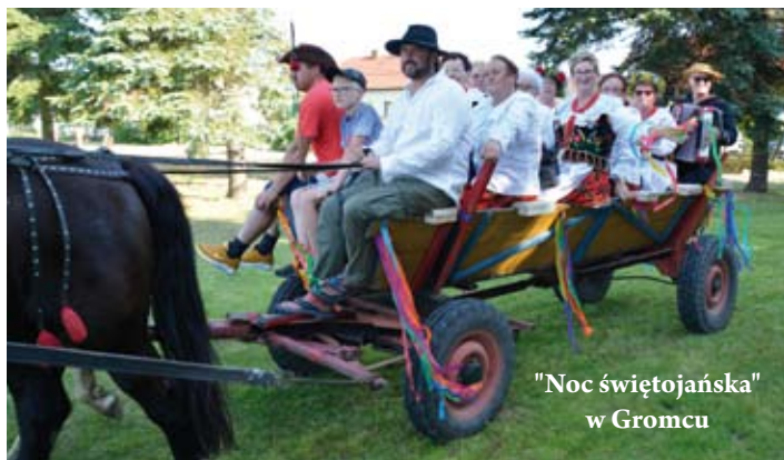
"Noc świętojańska" w Gromcu

L ibiąskie Lato Artystyczne 2021 przeszło do historii. Na Scenie pod filarami LCK każdy miłośnik muzyki mógł znaleźć coś dla siebie.