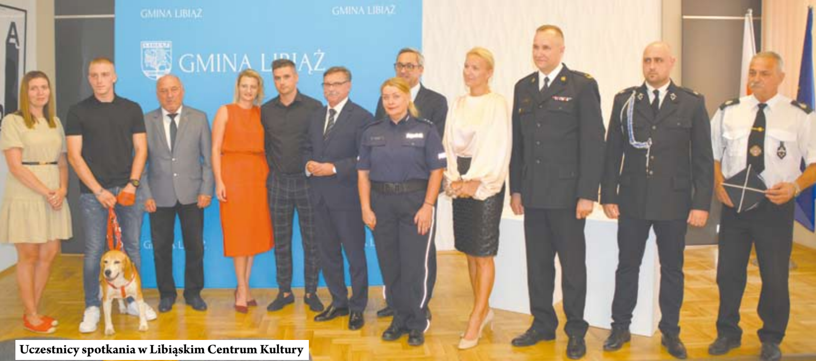
Uczestnicy spotkania w Libiąskim Centrum Kultury