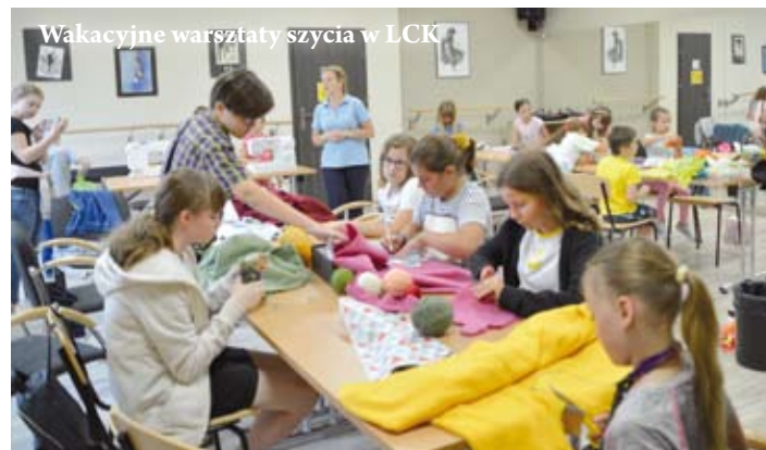
Wakacyjne warsztaty szycia w LCK

W każdy poniedziałek, środę i piątek w Ale! Kinie pokazywaliśmy filmy dla dzieci i młodzieży w wakacyjnych cenach. Praktycznie każdego dnia animatorzy prowadzili zajęcia dla dzieci w Libiążu, Gromcu, Żarkach lub Kosówkach.