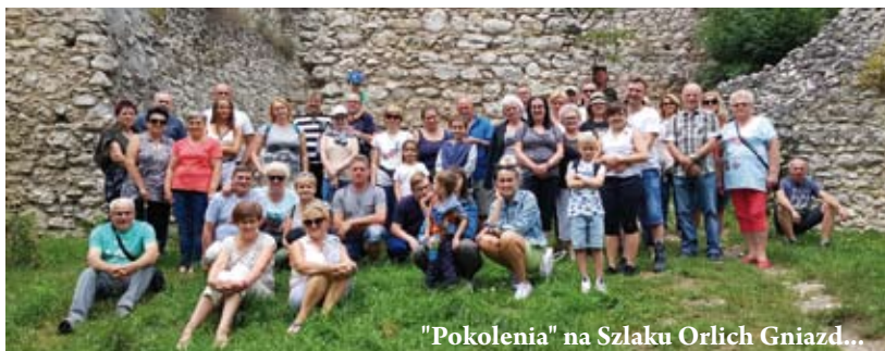
„Pokolenia” na Szlaku Orlich Gniazd...

W okresie wakacyjnym na otwarcie sezonu zorganizowane zostały prażone oraz wycieczka rowerowa po libiąskich lasach, natomiast w trakcie wakacji dwa wyjazdy integracyjno-krajoznawcze. Plan pierwszej z wycieczek obejmował Olkusz wraz ze zwiedzaniem podziemnego muzeum, zamek w Bydlinie, strażnicę w Ryczowie, zamek Pilcza w Smoleniu oraz Ojcowski Park Narodowy. Z kolei na trasie drugiej z wycieczek były: klasztor w Tyńcu, Niepołomice i Nowy Wiśnicz. Jeśli warunki pozwolą, to nie będzie koniec atrakcji w tym roku.