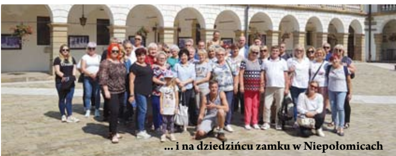
... i na dziedzińcu zamku w Niepołomicach