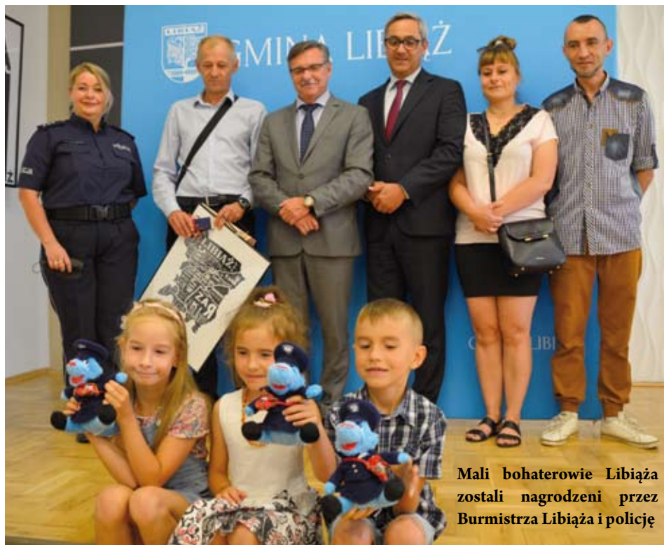
Mali bohaterowie Libiąża zostali nagrodzeni przez Burmistrza Libiąża i policję

– Jestem pod wrażeniem postawy naszych małych bohaterów. Dlatego postanowiłem ich docenić i osobiście im po-