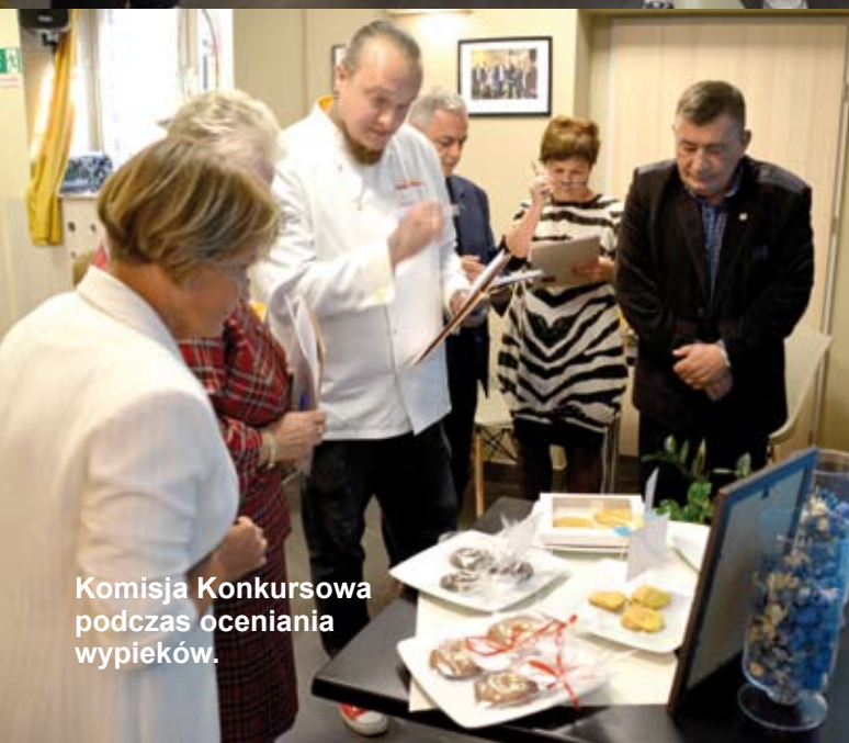
Komisja Konkursowa podczas oceniania wypieków.