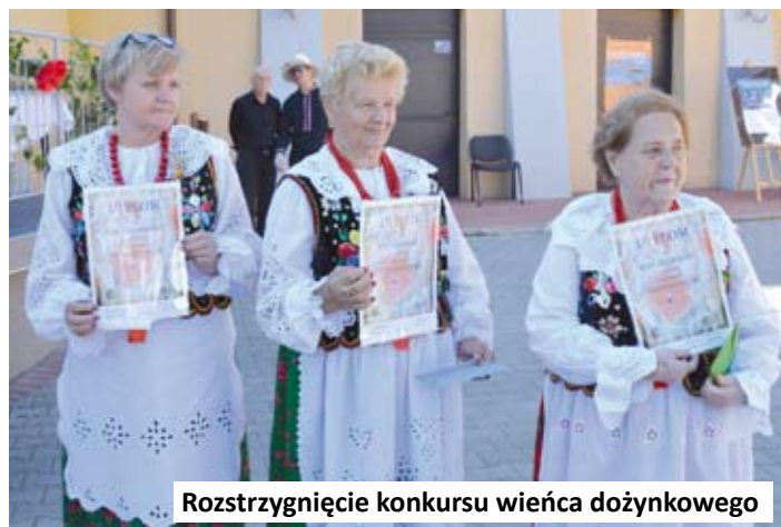
Rozstrzygnięcie konkursu wieńca dożynkowego