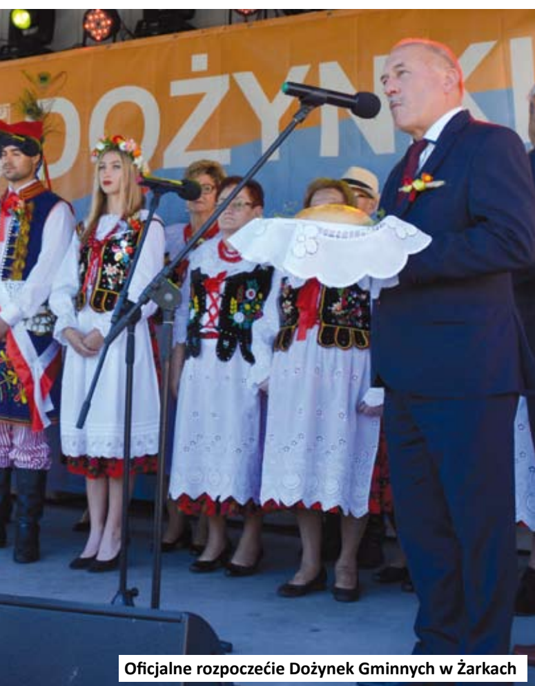
Oficjalne rozpoczęcie Dożynek Gminnych w Żarkach