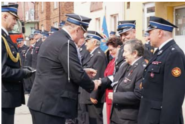
Wręczenie odznak za długoletnią służbę.

Natomiast w ub. roku spełniło się największe marzenie strażaków. Otrzymali nowy samochód ratowniczo-gaśniczy GBA RENAULT D16 z napędem 4x4 o poj. zbiornika na wodę 4500l. Auto zostało zakupione z