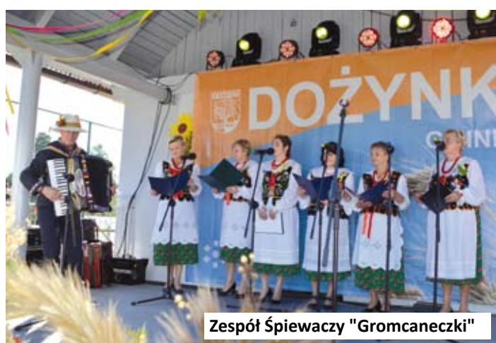
Zespół Śpiewaczy "Gromcanecki"