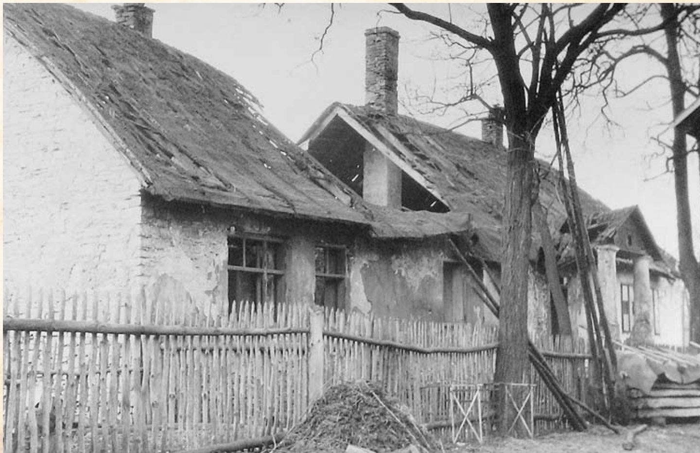
Dom małomiasteczkowy w Libiążu.

Fotografia druga wykonana została w 1958 roku przez Tadeusza Chrzanowskiego i przedstawia nieistniejący już dziś dom mieszkalny w Libiążu (może ktoś z Państwa pamięta). Pomijając jego stan zachowania przedstawiony na zdjęciu, prezentuje on bardzo interesujący obiekt. Forma budynku jest już bowiem typowo małomiasteczkowa, niepozbawiona przy tym nawiązania do stylu dworowego, o którym świadczy malowniczy trójkątny przycółtek wsparty na dwóch kolumnkach. Usytuowanie w zwartej zabudowie ulicy świadczy również o zachodzących zmianach w budownictwie mieszkalnym i przemianach urbanistycznych osady.