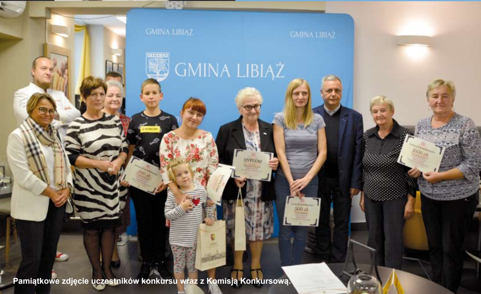
Pamiętkowe zdjęcie uczestników konkursu wraz z Komisją Konkursową.

Rozcieramy żółtka z cukrem pudrem i cukrem waniliowym na gładką masę. Następnie przesiewamy mąkę i łączymy z posiekany masłem, dodajemy rozrarte żółtka z cukrem i wyrabiamy na jednolitą masę. Ciasto owijamy w bawełnianą ściereczkę i wkładamy na 15 minut do lodówki. Schłodzone ciasto rozwałkowujemy na posypanym mąką blacie na grubość 5 mm i wykrawamy foremką ciasteczka. Pieczemy w nagrzanym piekarniku na 180 stopni C ok. 15 minut.