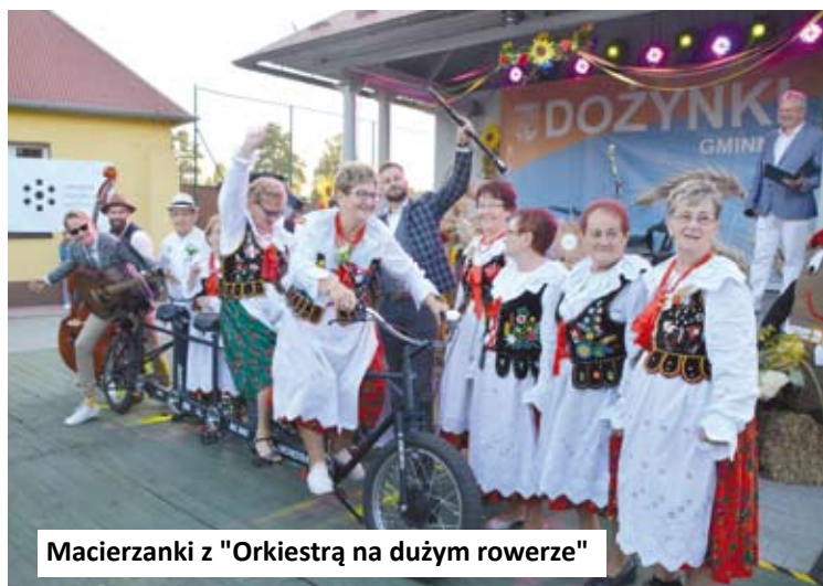
Macierzanki z "Orkiestrą na dużym rowerze"