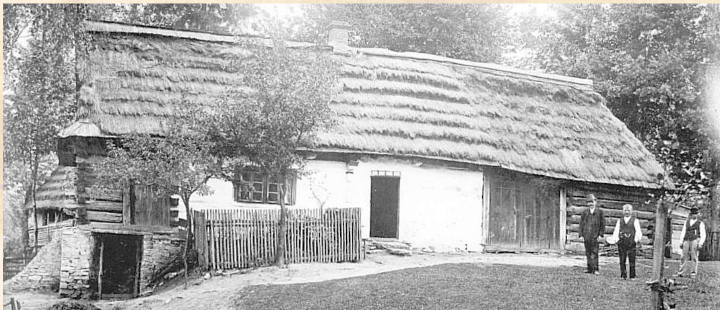
Dom nr 268 w Libiążu. 1914

Pozwoliłiśmy sobie zamieścić poniżej dwie archiwalne fotografie, będące zapisem dawnej historii budownictwa. Pierwsza z nich wykonana została w 1914 roku przez Eugeniusza Frankowskiego i przedstawia typową chałupę mieszkalną z Libiąża (opisana jest jako dom o nr 268) oraz stojących przed nią ludzi, którzy zapewne są jej mieszkańcami. Widzimy na niej typową chałupę, a w zasadzie jednobudynkową zagrodę, charakterystyczną dla ludowego budownictwa krakowskiego z pocz. XX stulecia. Program budynku składa się tutaj (od lewej) ze szczytowo położonej sieni, następnie obszernej izby, sieni (zapewne ze stajenką) oraz części stodołnej z boiskiem i sąsiekiem. Ściany części mieszkalnej są polepiane gliną i białkowane, a izba doświetlana jest charakterystyczną dla budownictwa krakowskiego parą zbliżonych do siebie małych okienek. Dach budynku ma tu formę mieszaną, niejako przejściową. Posiada bowiem nad sienią deskowany szczyt, a nad sąsiekiem formę trójspadkową. Dokumentuje zatem odchodzenie w tym czasie od typowego czterospadowego dachu, krytego schodkowanymi kładzioną słomą na rzecz bardziej praktycznego i prostszego w konstrukcji dachu dwuspadowego. Uwiecznieni przed chałupą mężczyźni sądząc po ubiorach to już pokolenie chłopów – robotników, noszących się już po „miastowemu” i zapewne zatrudnionych w przedsiębiorstwach związanych z górnictwem.