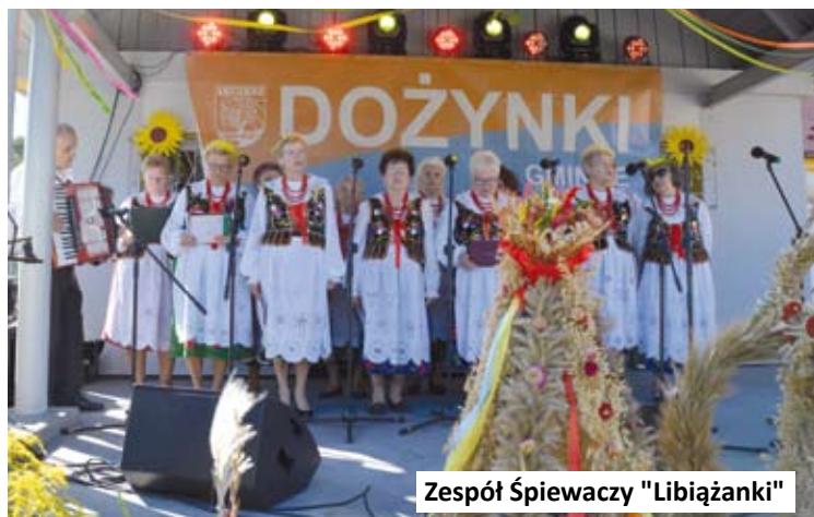
Zespół Śpiewaczy "Libiążanki"