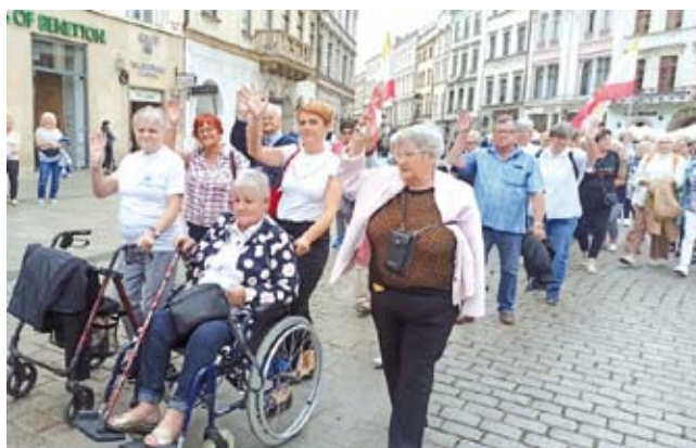
Libiąscy seniorzy podczas VIII Międzynarodowych Senioraliów w Krakowie

go Centrum Medycznego w Libiążu III piętro) oraz w Punkcie Aktywności od 9.00 do 14.00.