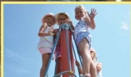
NOWE PLACE ZABAW