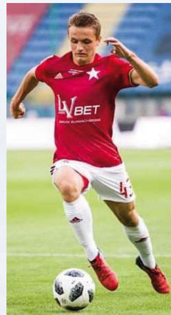
W barwach Wisły Kraków.

Moim priorytetem jest cały czas trenować z pierwszą drużyną i złapać jak najwięcej minut gry w ekstraklasie. Został mi ostatni rok szkoły do którego trzeba się przyłożyć i żeby dobrze napisać maturę.