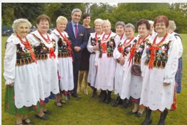
Koło Gospodyń Wiejskich z Libiąża reprezentowało naszą gminę na Dożynkach Powiatu Chrzanowskiego, które odbyły się 27 sierpnia 2018 r. w Luszcowicach.