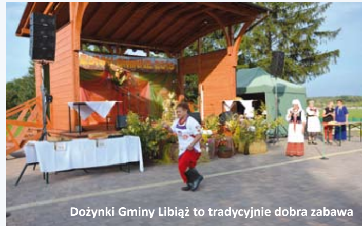
Dożynki Gminy Libiąż to tradycyjnie dobra zabawa

browianki, a także tradycyjnych konkursów plonów i kwiatów.