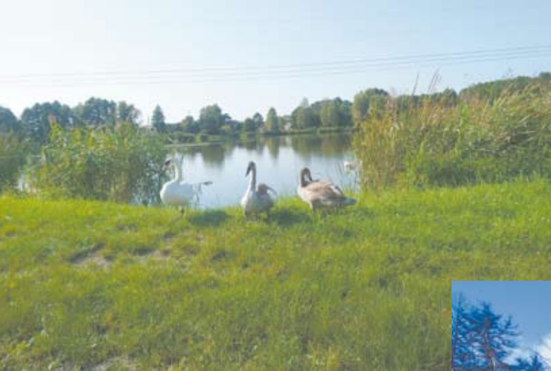
^ Stawy w Szyjkach