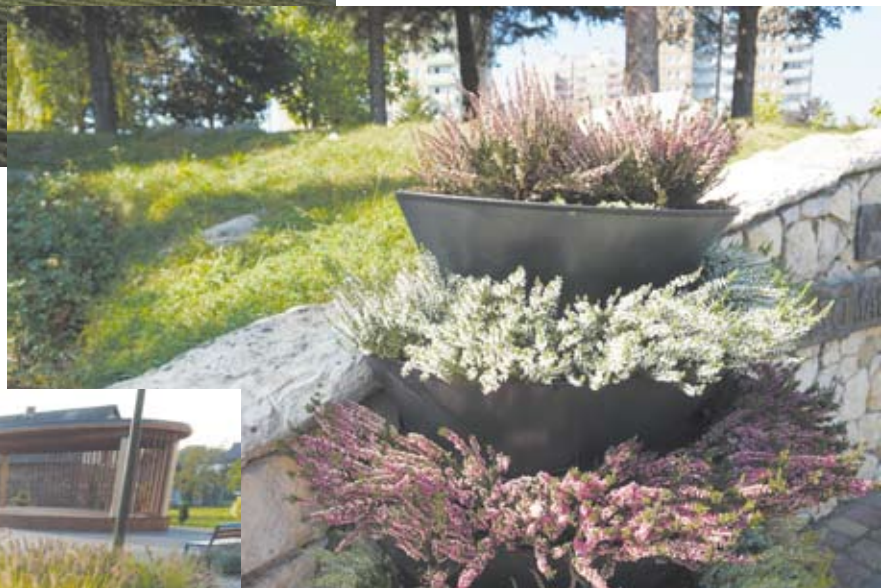
< Przestrzeń publiczna przy ul. Andersa w Libiążu