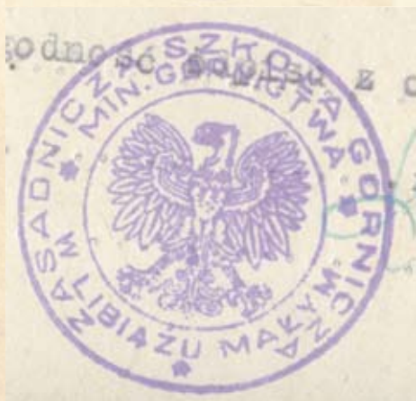
Pieczenie okrągłe szkoły przemysłowej z lat 1947 - 50 i szkoły zasadniczej z lat 1950 -54.