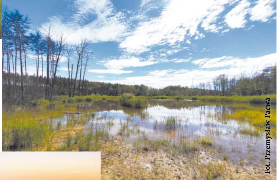
> Rozlewiska pomiędzy Gromcem a Żarkami