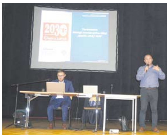
▲ Ekspert z MISTiA zaprezentował diagnozę społeczno-gospodarczą dla gminy Libiąż

Latko, kierowników wydziałów urzędu i gminnych jednostek organizacyjnych wzięli także udział radni, przedsiębiorcy, przedstawiciele instytucji, organizacji i stowarzyszeń. Pełna wersja dokumentu jest dostępna na stronie www.libiaz.pl (zakładka aktualności, pod artykułem Libiąż rozpoczyna prace nad strategią rozwoju do 2030 roku)