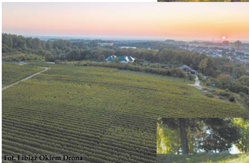
< Libiąska winnica