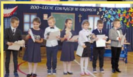
JUBILEUSZ W GROMCU