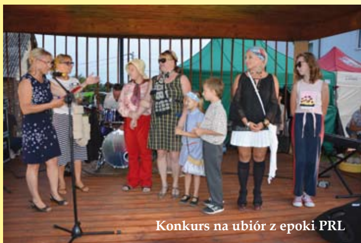
Konkurs na ubiór z epoki PRL