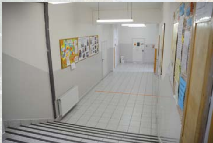
Odświeżono klatki schodowe w SP nr 2

Również ponad milion złotych gmina przeznaczyła na rzecz Zespołu Szkół w Żarkach. Praktycznie cała kwota zostanie wykorzystana na budowę hali łukowej nad istniejącym boiskiem wielofunkcyjnym.