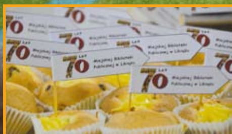
70 LAT BIBLIOTEKI