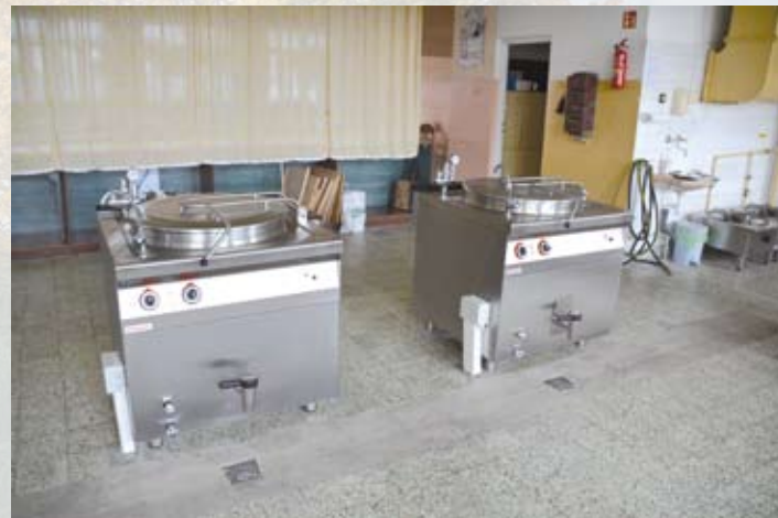
Nowe wyposażenie kuchni w SP nr 4