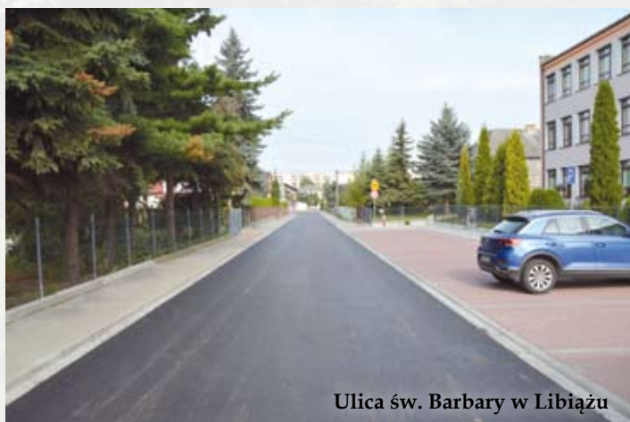
Ulica św. Barbary w Libiążu

Trwa intensywny czas na drogach w naszej gminie. Na finiszu jest przebudowa ul. Św. Barbary. Kolejne miejsca, gdzie można spodziewać się ekip drogowców to: ul. Kresowa w Żarkach i ulice Piaskowa i Słoneczna w Libiążu. To jednak nie wszystko. Na ostatniej sesji radni przegłosowali korektę budżetu obejmującą m.in. zwiększenie wydatków majątkowych o ponad milion złotych. Większość tej kwoty przeznaczona zostanie na libiąskie ulice. Przebudowana zostanie ul. Makowa, drogi wewnętrzne – boczne od ul. Urzędniczej, Leśnej i Jaworowej w Libiążu. W Gromcu przy ul. Husarskiej ułożona zostanie nowa nawierzchnia parkingu, a przy wspomnianej Jaworowej – zjazd na parking. W przypadku Żarek – przed budynkiem Domu Kultury wykonana zostanie nowa nawierzchnia.