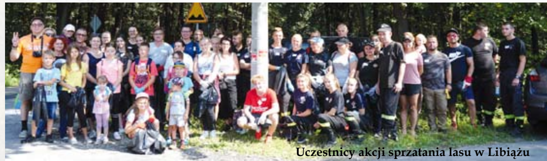
Uczestnicy akcji sprzątnięcia lasu w Libiążu