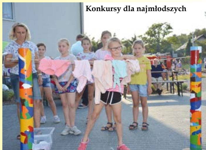
Konkursy dla najmłodszych