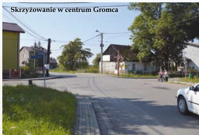
Skrzyżowanie w centrum Gromca

- U zbiegu ul. Nadwiślańskiej i Traugutta powstanie skrzyżowanie z mini rondem - informuje Grzegorz Żuradzki, dyrektor PZD. Ulica Nadwiślańska zostanie przebudowana na odcinku 800m w kierunku Libiąża, aż do skrzyżowania z ul. Czarnieckiego, które również zostanie zmodernizowane. Pojawi się tam m.in. radar mierzący i wyświetlający prędkość kierowców nadjeżdżających od strony Libiąża. Droga na wspomnianym odcinku zostanie poszerzona do 6m i powstanie przy niej chodnik. Przebudowane zostaną zatoki autobusowe. Inwestycja ma rozpocząć się w tym roku, a zakończyć w przyszłym.