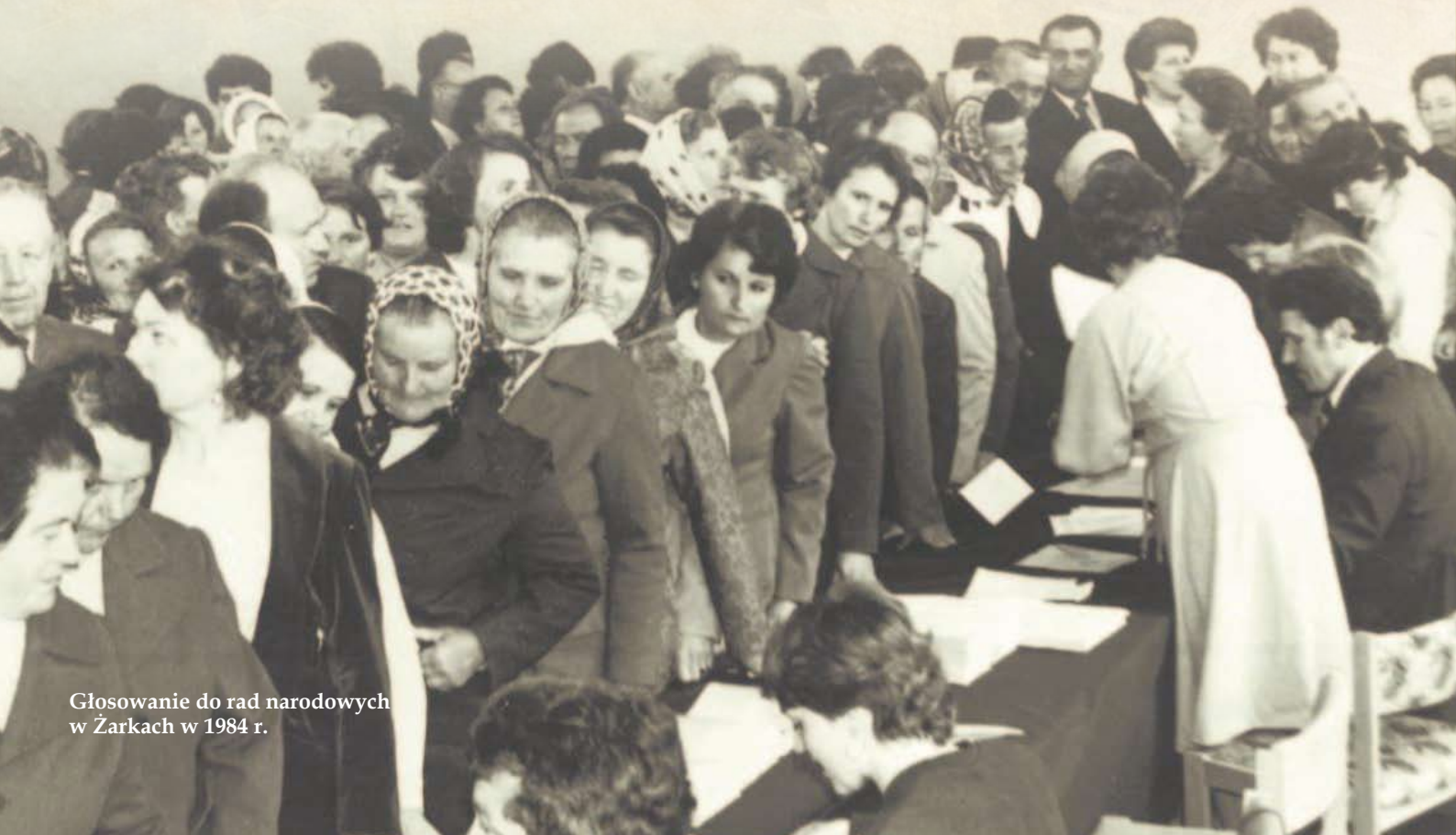
Głosowanie do rad narodowych w Żarkach w 1984 r.