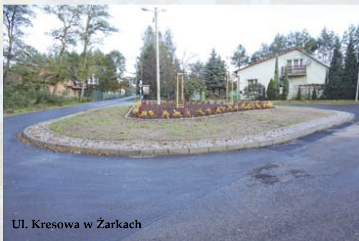
Ul. Kresowa w Żarkach

- przebudowa nawierzchni parkingu przy ul. Husarskiej w Gromcu, 69 975,89 zł, wzmocnienie podbudowy, zabudowa obrzeży, nawierzchnia bitumiczna.