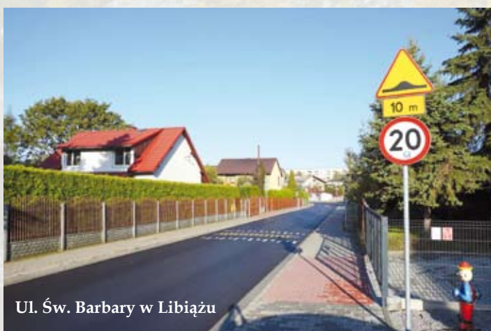
Ul. Św. Barbary w Libiążu