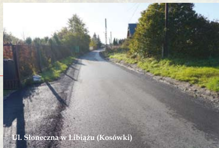
Ul. Słoneczna w Libiążu (Kosówki)

Powoli zbliża się do końca tegoroczne grzybobranie. Ze względu na piękną pogodę, było ono wyjątkowo obfite.