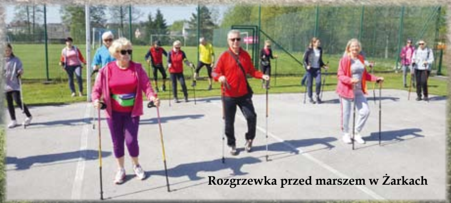
Rozgrzewka przed marszem w Żarkach