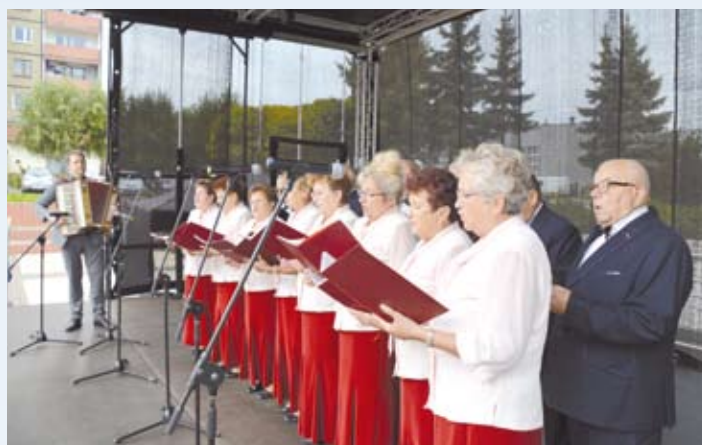
Występ zespołu Wrzos z Żarek