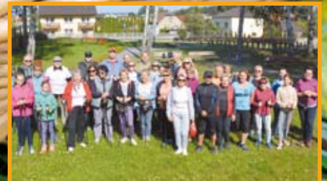
50 KM PIĘĆDZIEŚCIOLECIA