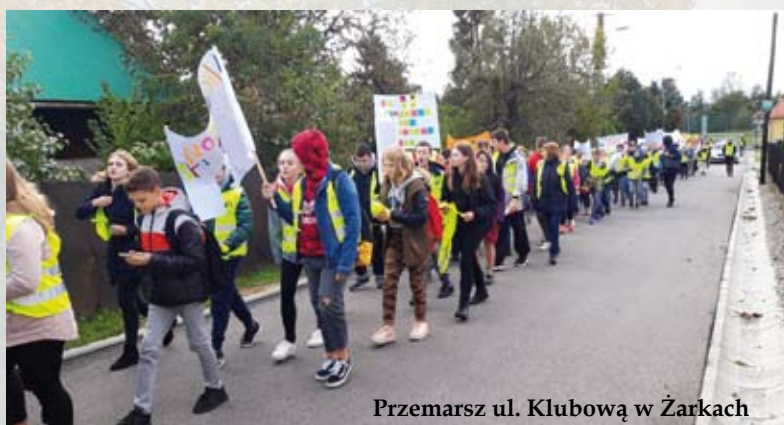
Przemarsz ul. Klubową w Żarkach

ność obowiązkowego noszenia elementów odblaskowych. Wszyscy uczestnicy zaopatrzeni byli w kamizelki odblaskowe, opaski i samodzielnie wykonane transparenty propagujące bezpieczeństwo na drogach.