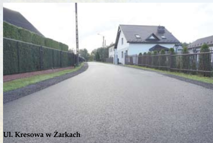
Ul. Kresowa w Żarkach