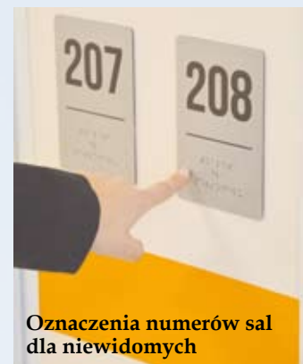
Oznaczenia numerów sal dla niewidomych

Co ważne, placówka jest dostosowana do potrzeb osób niepeł-