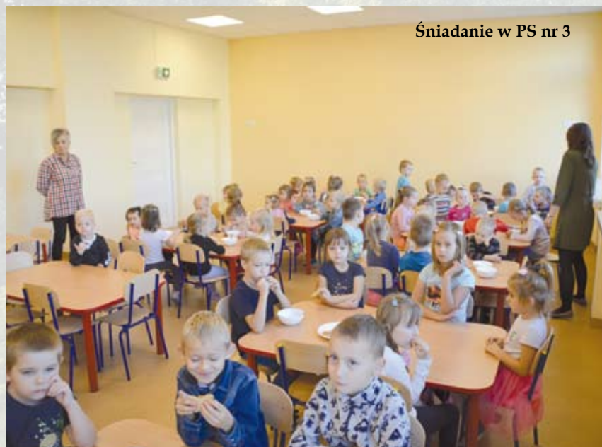
Śniadanie w PS nr 3

Gdy trwają zajęcia na korytarzach panuje cisza. Ożywają one w czasie przerw, a także po południu, gdy rodzice zaczynają odbierać swoje dzieci. I znów, uśmiechów wtedy nie brakuje. Zarówno na twarzach dorosłych, jak i maluchów dzielących się wrażeniami z dnia spędzonego w przedszkolu.