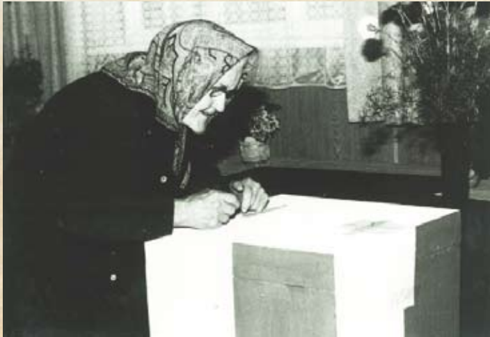
Wybory do gminnych i wojewódzkich rad narodowych w 1984 r.

w inicjatywach organizowanych przez komunistyczne władze, a także postępującym rozprężeniem w aparacie władzy. W pierwszych częściowo wolnych wyborach 4 czerwca 1989 r. frekwencja wśród głosujących w naszej gminie wyniosła 70,1% w I turze, a w turze II była dwukrotnie niższa.