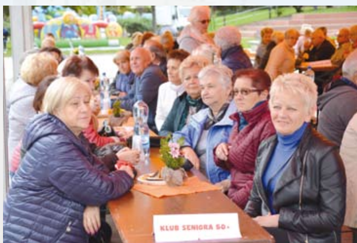
Uczestnicy Libiańskich Senioraliów 2019