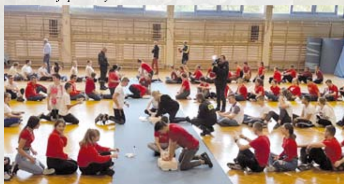
Bicie rekordu w libiążskiej hali sportowej