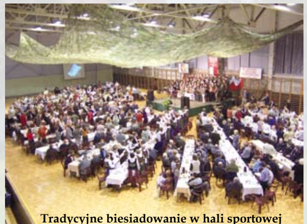
Tradycyjne biesiadowanie w hali sportowej

Wspólne świętowanie 11 Listopada to wieloletnia tradycja gminy Libiąż. Obchody Święta Niepodległości zaczną się uroczystą mszą świętą w intencji Ojczyzny o godz. 9 w kościele pw. Przemienienia Pańskiego. Po niej uczestnicy złożą kwiaty pod Pomnikiem Nieznanego Żołnierza na Cmentarzu w Libiążu. Natomiast o godz. 17 rozpocznie się XXI Biesiada Patriotyczna w Hali Sportowej przy ul. Górniczej 3. W tym roku świętowanie będzie szczególne, bo połączone z jubileuszem 50-lecia uzyskania praw miejskich przez Libiąż.