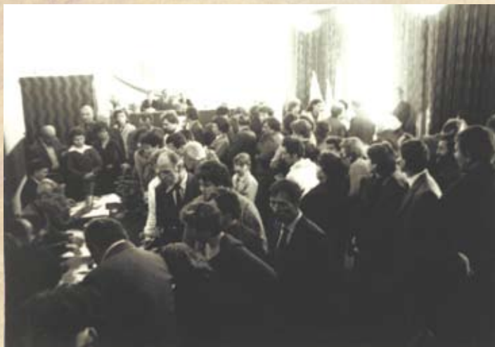
Obwód nr 5 w Domu Kultury w Libiążu - głosowanie podczas wyborów do sejmiku w 1985 r.