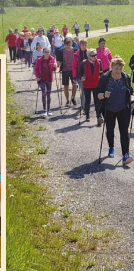
Pamiątkowe zdjęcie uczestników, którzy pokonali 50 km