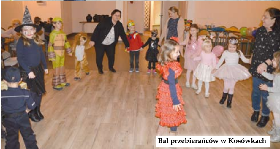
Bal przebierańców w Kosówkach