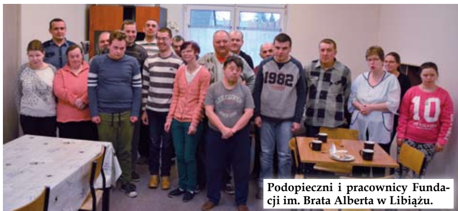
Podopieczni i pracownicy Fundacji im. Brata Alberta w Libiążu.

P o rocznym pobycie w świetlicy w Gromcu podopieczni Warsztatów Terapii Zajęciowej wrócili do macierzystego budynku przy ul. Piłsudskiego w Libiążu.