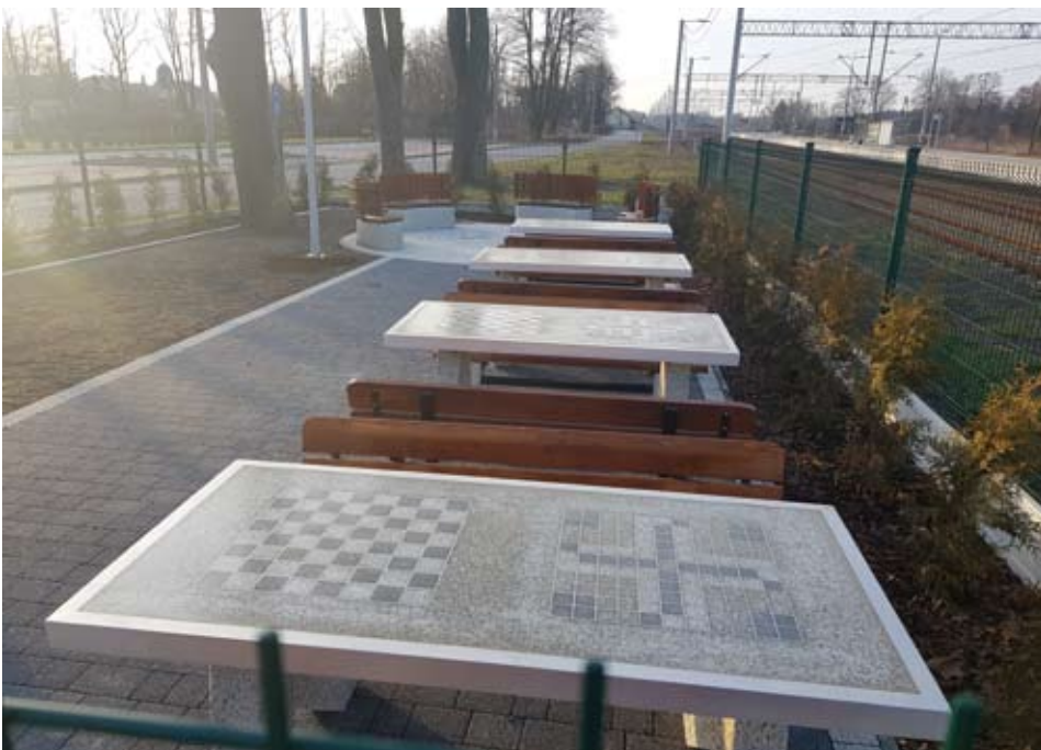
Wkrótce w tym miejscu będą relaksować się osoby starsze z gminy Libiąż.

km torów, przebudowano sieć trakcyjną, 21 rozjazdów, obiekty inżynierskie i urządzenia sterowania ruchem kolejowym. To złożyło się na powstanie nowoczesnej przestrzeni publicznej będącej wizytówką miasta.