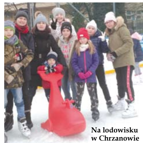
Na lodowisku w Chrzanowie

Ofertę LCK stanowiło prawie 30 wydarzeń i codzienne seanse w Ale!Kino dla dzieci, młodzieży i dorosłych. Tradycyjnie nie zabrakło interesujących wycieczek. W Nadwiślańskim Parku Etnograficznym w Wygietzowie odbyły się warsztaty tworzenia kwiatów z bibuły i okolicznościowych kartek, a także pieczenia serc z piernika. Na łyżwach można było poszaleć na chrzanowskim lodowisku.