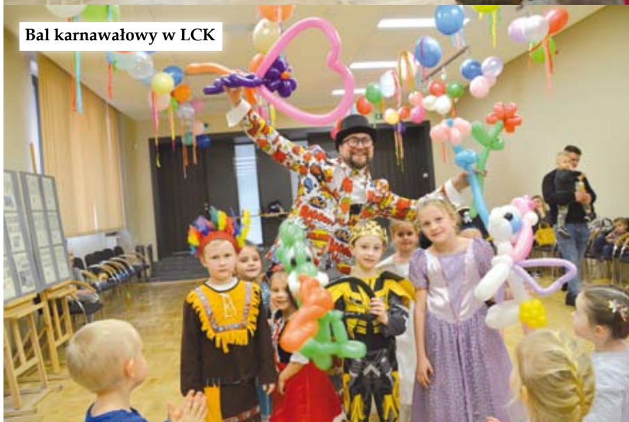
Bał karnawałowy w LCK