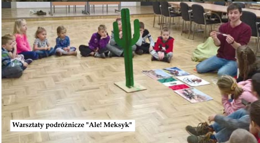
Warsztaty podróżnicze "Ale! Meksyk"