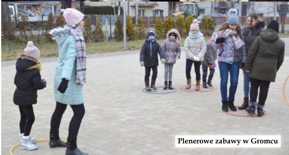
Plenerowe zabawy w Gromcu