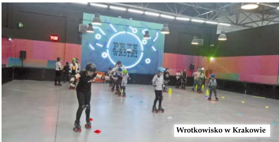
Wrotkowisko w Krakowie