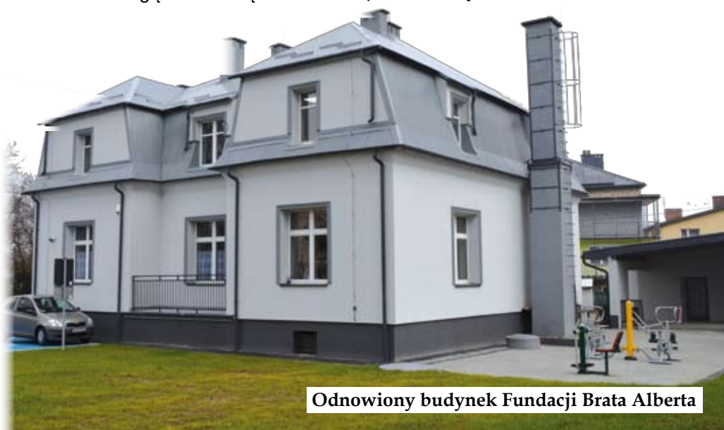
Odnowiony budynek Fundacji Brata Alberta