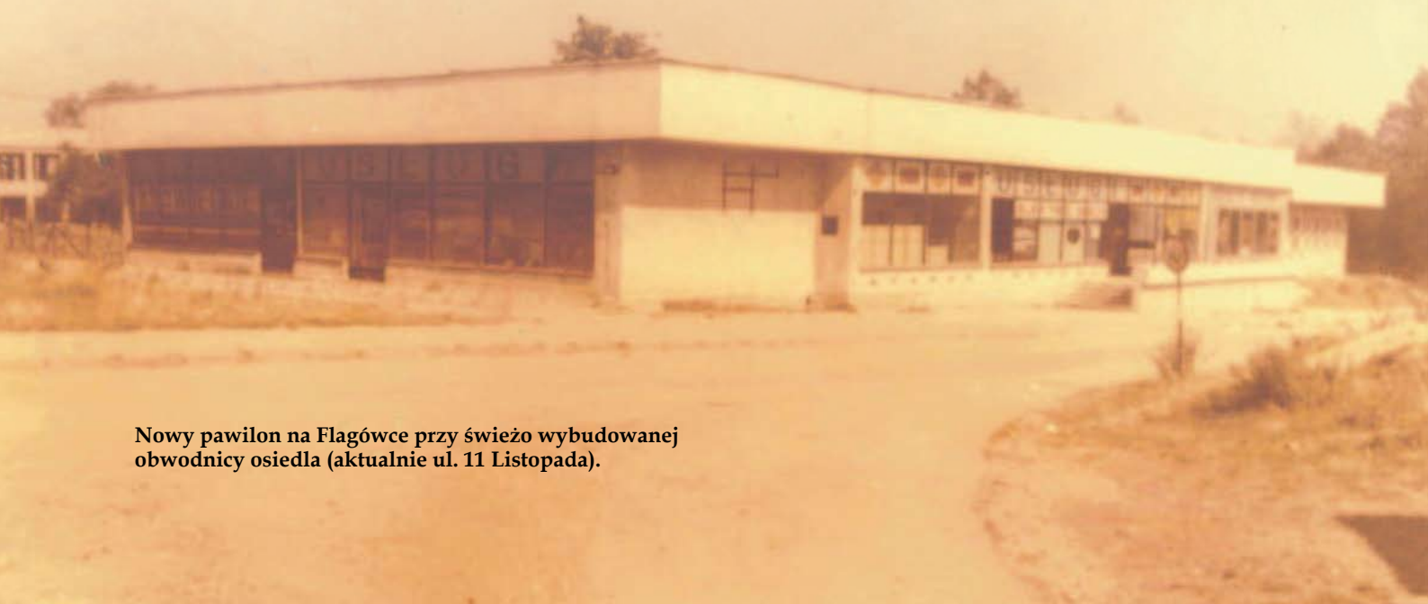
Nowy pawilon na Flagówce przy świeżo wybudowanej obwodnicy osiedla (aktualnie ul. 11 Listopada).

oprac. Łukasz Płatek na podst. „Kroniki Miasta i Gminy Libiąż” oraz „Janina o sobie” pod red. R. Gałuszki; zdjęcia ze zbiorów UM w Libiążu.