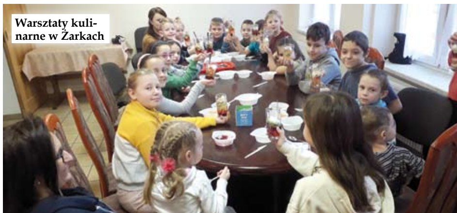
Warsztaty kulinarne w Żarkach