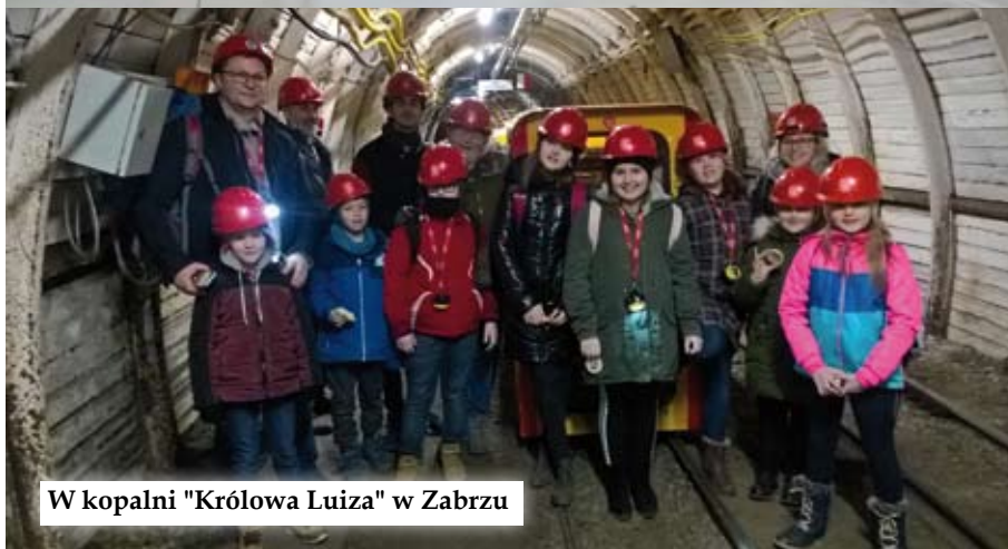
W kopalni "Królowa Luiza" w Zabrzu