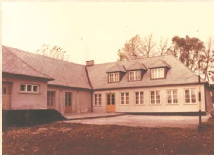
Gminny Ośrodek Kultury w Żarkach w 1980 r.

Rok 1980 zapisał się w historii jako czas wybuchu najpierw społecznego niezadowolonia, a potem społecz-