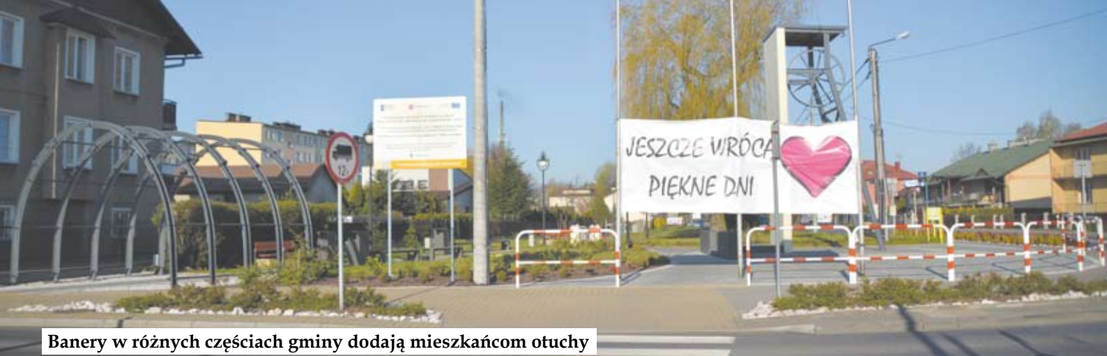
Banery w różnych częściach gminy dodają mieszkańcom otuchy