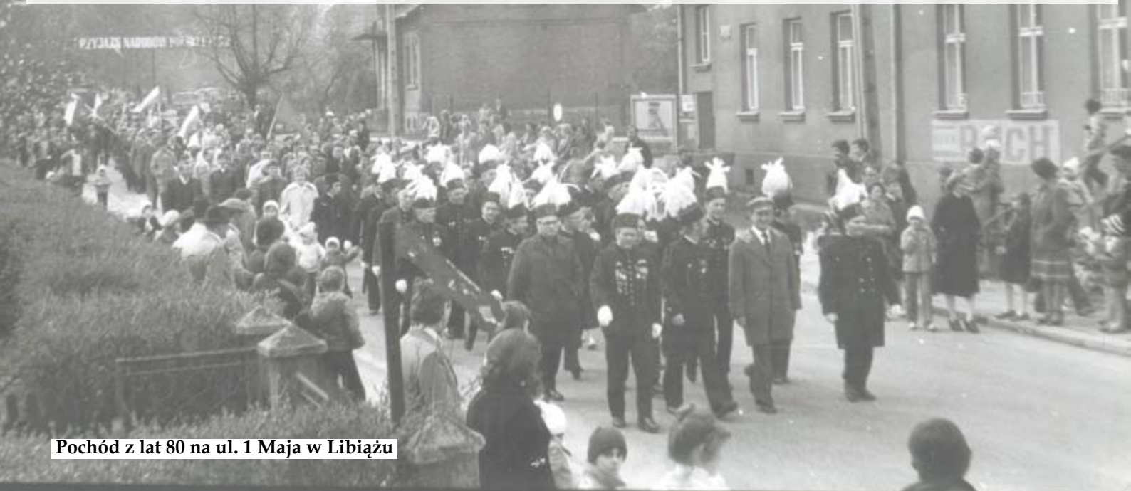
Pochód z lat 80 na ul. 1 Maja w Libiążu

Trudno nie wspomnieć o historii. 1 maja wypada Międzynarodowe Święto Pracy lub inaczej Międzynarodowy Dzień Solidarności Ludzi Pracy. Zostało ustanowione w 1889 roku na pierwszym kongresie Drugiej Międzynarodówki w Paryżu. Miało wówczas upamiętnić masakrę robotników, która miała miejsce 1886 roku w Chicago. W Polsce jest świętem państwowym od 1950 r. W okresie Polski Ludowej było szczególnie obchodzone. W całym kraju organizowane były specjalne pochody, w których przymusowo brali udział pracownicy zakładów pracy i instytucji, a także uczniowie i nauczyciele. Maszerował więc prawie każdy. Obowiązkowe były transparenty, plakaty, chorągiewki i balony, a także przemówienie I sekretarza PZPR. W Libiążu pochód formował się na parkingu przy kopalni. Ludzie maszerowali ul. Górnica, 1 Maja, aż na stadion przy ul. Piłsudskiego. Tam po części „oficjalnej” odbywał się festyn. Ostatni pochód w Libiążu miał miejsce w 1989 r.