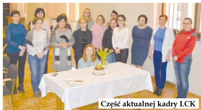
Część aktualnej kadry LCK