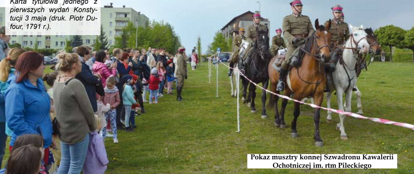
Pokaz musztry konnej Szwadronu Kawalerii Ochotniczej im. rtm Pileckiego