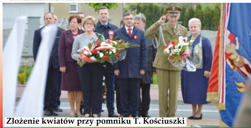
Złożenie kwiatów przy pomniku T. Kościuszki