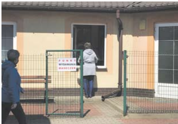
Część osób odebrała maseczki osobiście w punkcie ich wydawania na targowisku miejskim

dowierzali, że dostaną je za darmo w prezencie od gminy. - Naprawdę? Wystarczy podać adres i nic nie trzeba płacić?! To super! Dzwonię do sąsiadów, żeby też przyszli – mówili zadowolony młody mężczyzna.