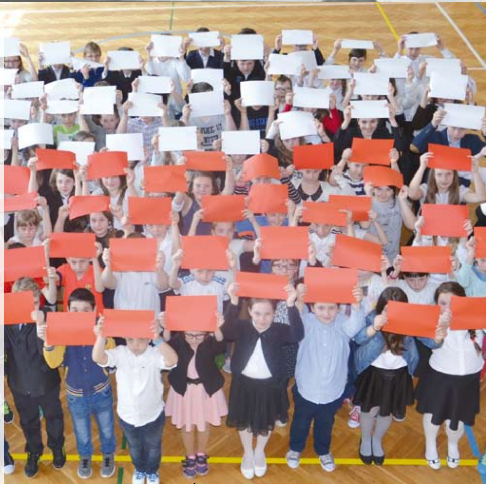
Święto Flagi w SP nr 2 w Libiążu z 2019 r.

W czasach komunistycznych flagę wywieszali głównie działacze partyjni. Ten okres minął już dawno temu, jednak trudno oprzeć się wrażeniu, że prezentowanie biało-czerwonych barw niektórym wciąż kojarzy się z tym czasem. Pamiętajmy jednak, że nasza flaga narodowa ma długą historię. Barwy biała i czerwona zostały uznane za narodowe po raz pierwszy 3 maja 1792 r. podczas obchodów pierwszej rocznicy uchwalenia Konstytucji 3 Maja. W jej trakcie mężczyźni mieli przepasane biało-czerwone szarfy, a kobiety białe stroje i czerwone wstęgi. Tymi kolorami posługiwali się również powstańcy w czasie insurekcji kościuszkowskiej. Od tego momentu te barwy były nieodłącznie kojarzone z Polską i polskimi wysiłkami niepodległościowymi. Aby podkreślić znaczenie flagi i zachęcić mieszkańców do jej prezentowania, w 2004 r. dzień 2 maja ustanowiony został Dniem Flagi Rzeczypospolitej Polskiej. Pamiętajmy, aby tego dnia z dumą zaprezentować nasze barwy narodowe. To pokaże nasz patriotyzm, a także jedność, co jest szczególnie ważne w obecnych, trudnych czasach.