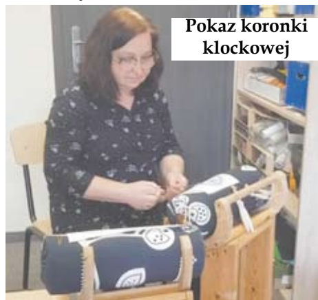
Pokaz koronki klockowej

rzeczy, więc wyszło pięknie. Dziękujemy za ciepłe przyjęcie tego materiału. To dodało nam skrzydeł i zachęciło do tworzenia kolejnych. Pojawiły się m.in. kurs podstawowych kroków tanecznych bluesa, przepis na proste w wykonaniu muffinki, prezentacja koronki klockowej.