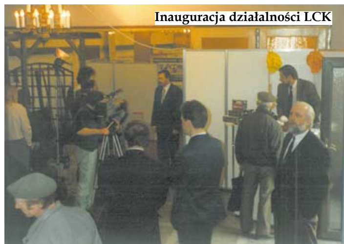
Inauguracja działalności LCK

świętowanie obu tych okazji. Gdy zakończą się ograniczenia związane z epidemią, będziecie mogli się o tym przekonać oraz zapoznać się z historią placówki. CZEKAMY NA WAS!