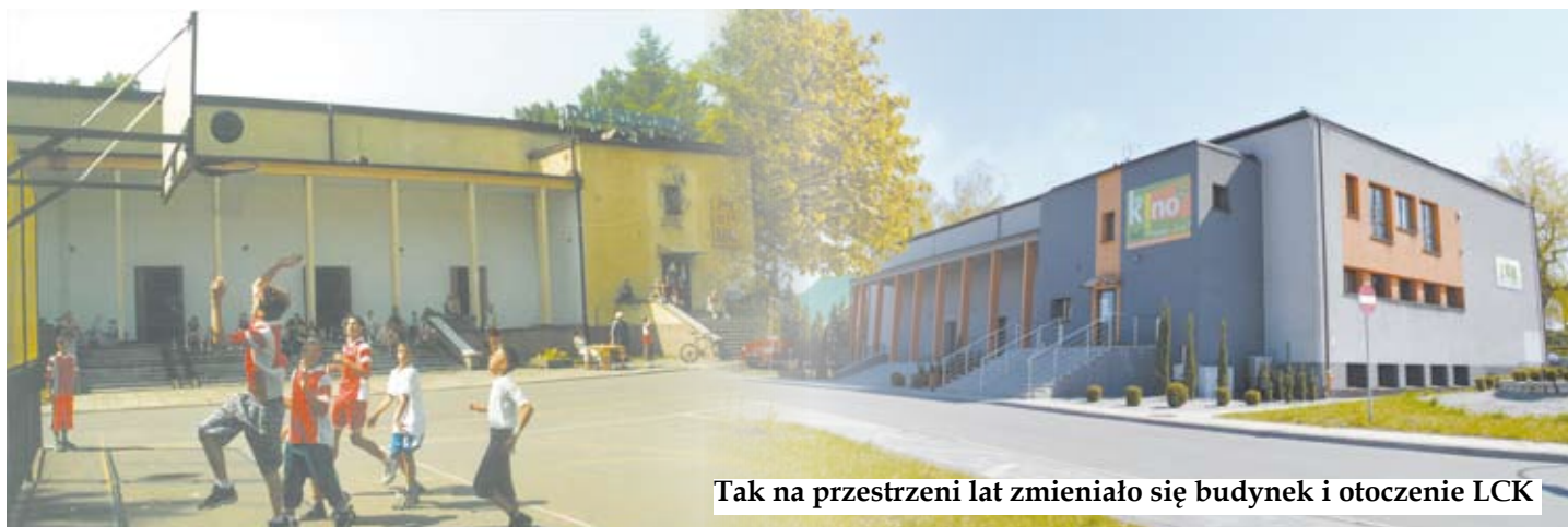
Tak na przestrzeni lat zmieniało się budynek i otoczenie LCK