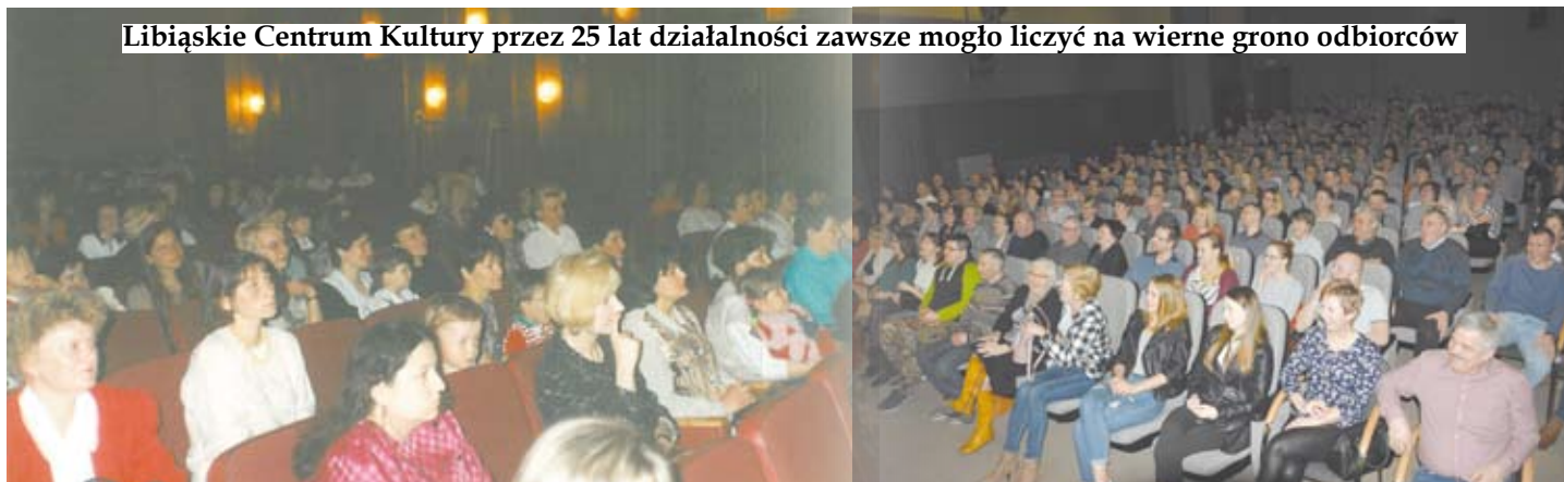
Libiąskie Centrum Kultury przez 25 lat działalności zawsze mogło liczyć na wierne grono odbiorców