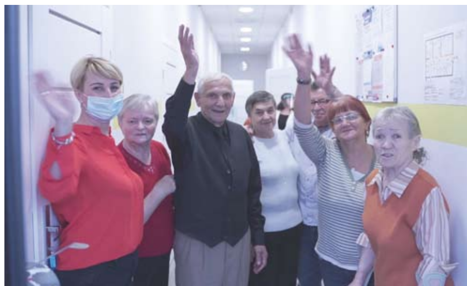
▲ W libiążskim Domu Seniora + podopieczni czują się jak w domu

Dzienny Dom Senior+ w Libiążu funkcjonuje od poniedziałku do piątku w godzinach od 6.00 do 16.00.