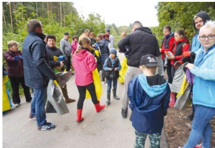
^ Uczestnicy akcji byli w różnym wieku. Nie brakowało też dzieci