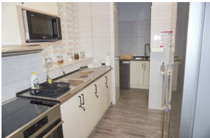
^ Pomieszczenie kuchenne