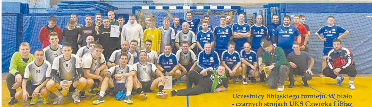
Uczestnicy libiąskiego turnieju. W biało-czarnych strojach UKS Czwórka Libiąż