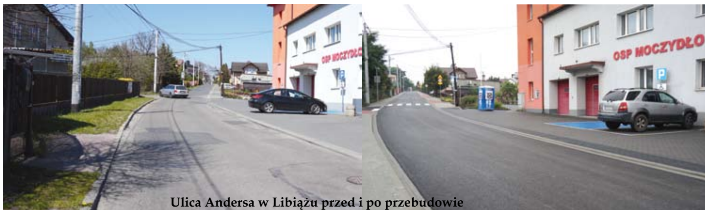
Ulica Andersa w Libiążu przed i po przebudowie

Ponadto zakończyła się przebudowa ul. Czarnieckiego w Gromcu. Poza wzmocnieniem podbudowy i położeniem nowej nawierzchni jezdni, wykonano także pobocza tłuczniowe. Wartość prac to ok. 106 tys. zł.