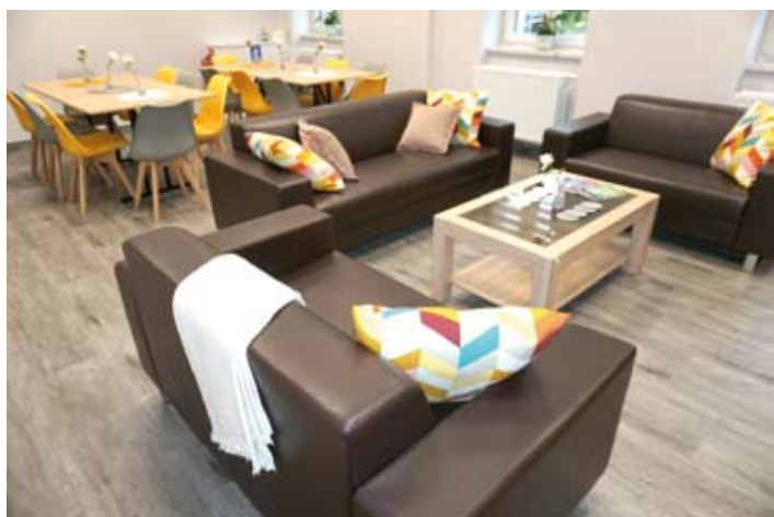
^ Pokój spotkań