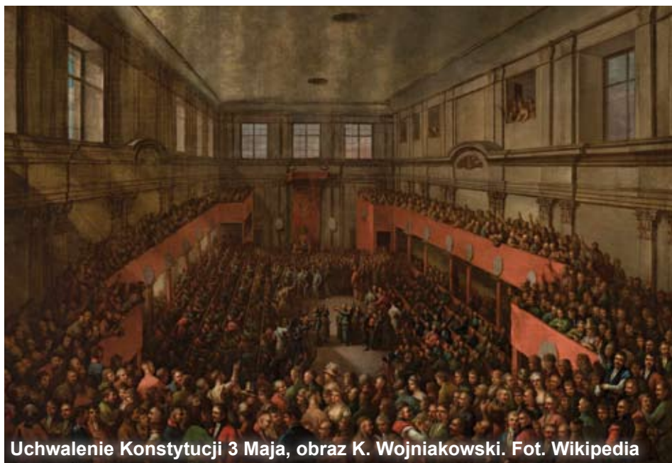
Uchwalenie Konstytucji 3 Maja, obraz K. Wojniakowski.

Wielu Polaków wybrało emigrację by bić się za „wolność waszą i naszą”. Nadzieje wiązane w sojuszu z Francją, gdzie u boku Napoleona powstały w 1797 Legiony Polskie. Symbolem wiary w niepodległość stała się w 1797 pieśń legionistów napisana przez Józefa Wybickiego, zwana też „Mazurem Dąbrowskiego”, która w XX wieku została polskim hymnem narodowym. Krótkotrwałą nadzieję na załążek własnego państwa dało utworzone przez Napoleona w latach 1807-1915 Księstwo Warszawskie.