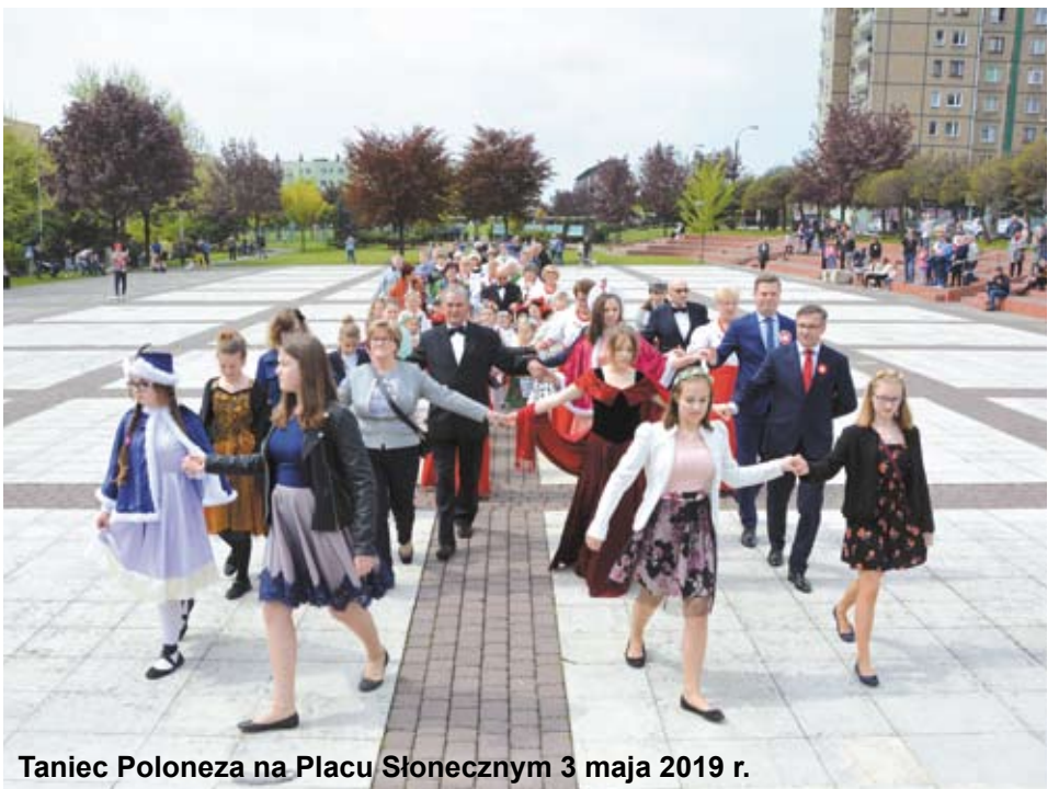
Taniec Poloneza na Placu Słonecznym 3 maja 2019 r.

jest to święto symboli narodowych, historii i narodowej tradycji. Święto radośnie manifestowanego patriotyzmu Polaków. Dzień wolny od pracy spędzany w gronie rodzin i przyjaciół – na placach, wiecach, przemarszach, defiladach, festynach i koncertach.