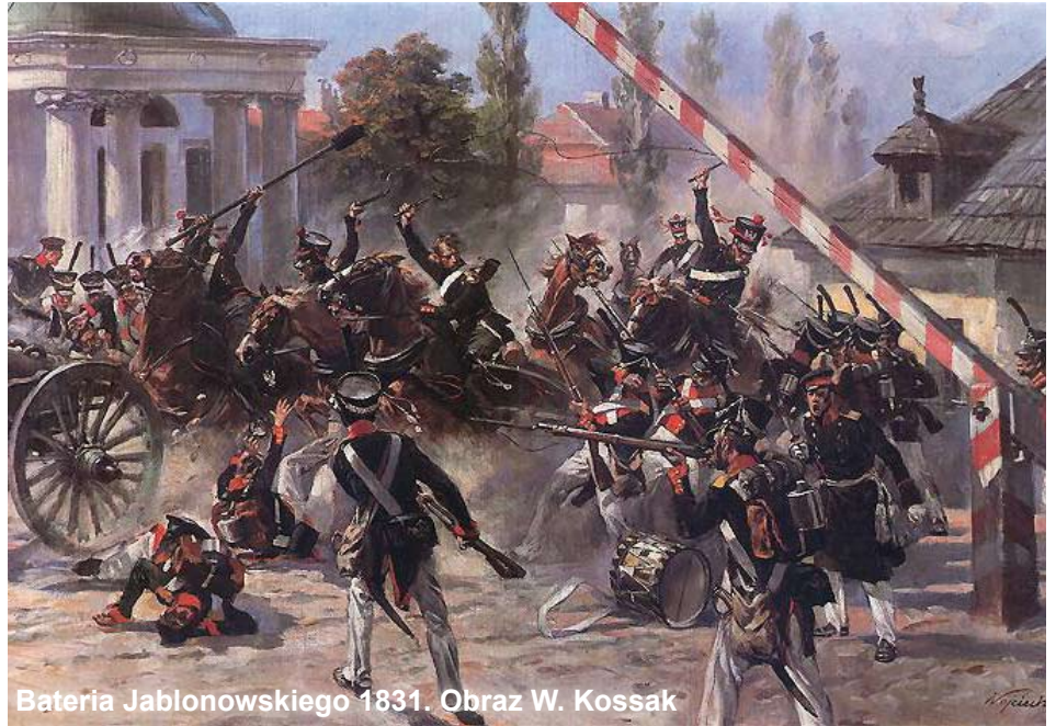
Bateria Jabłonowskiego 1831. Obraz W. Kossak

W pełni swobodne obchody święta 3 Maja powróciły dopiero po obradach „tzw. okrągłego stołu” w 1989 roku. 6 kwietnia 1990 roku Sejm odrodzonej i niepodległej Rzeczypospolitej ustanowił rocznicę uchwalenia Konstytucji 3 Maja jako oficjalne święto narodowe. Dzisiaj