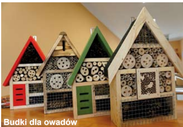
Budki dla owadów

- To bardzo ciekawa akcja. Idealnie wpisuje się w działania ekologiczne, które realizuje nasze przedszkole. Tak się składa, że sąsiadujemy z pasie-