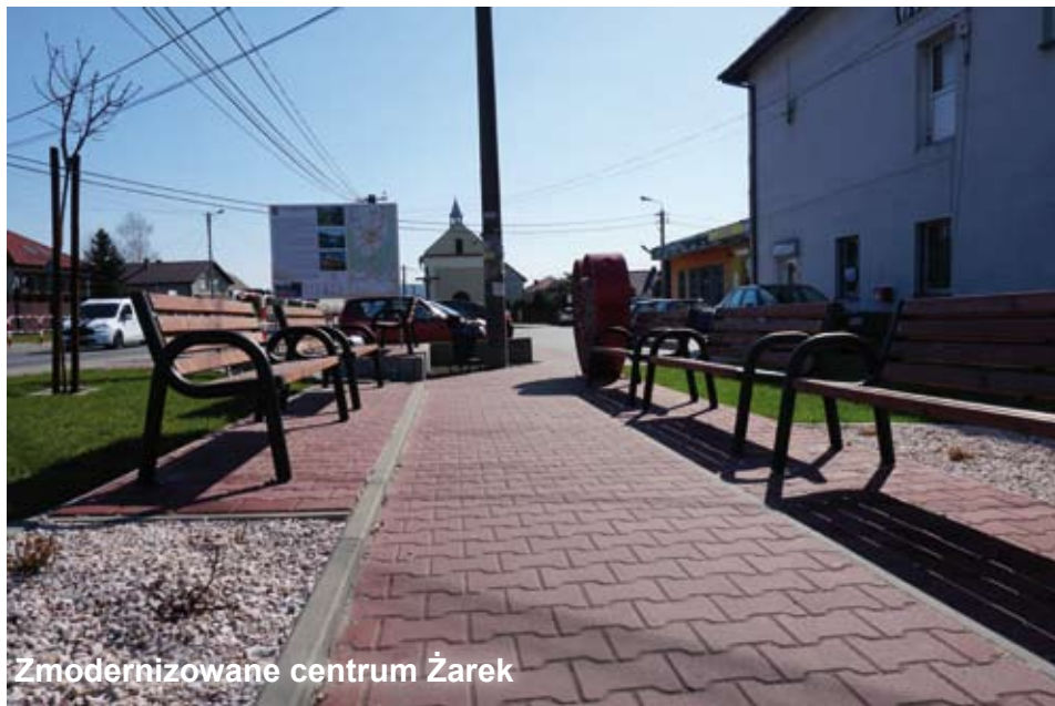
Zmodernizowane centrum Żarek

M ieszkańcy sołectwa mają powody do zadowolenia. Teren przy ul. Piastów został uporządkowany i ładnie zagospodarowany. Gmina Libiąż zrealizowała projekt za pośrednictwem Lokalnej Grupy Działania „Partnerstwo na Jurze” ze środków Europejskiego Funduszu Rolnego na Rzecz Rozwoju Obszarów Wiejskich „Europa inwestująca w obszary wiejskie”.