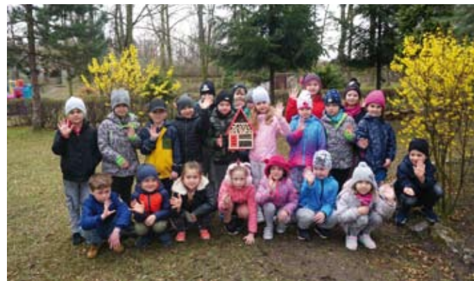
Budki trafiły do dzieci z przedszkola nr 2