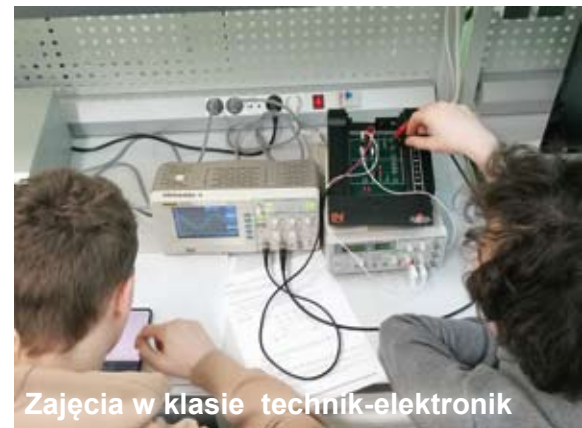
Zajęcia w klasie technik-elektronik

Odpowiadając na jego potrzeby, w przyszłym roku szkolnym pojawią się