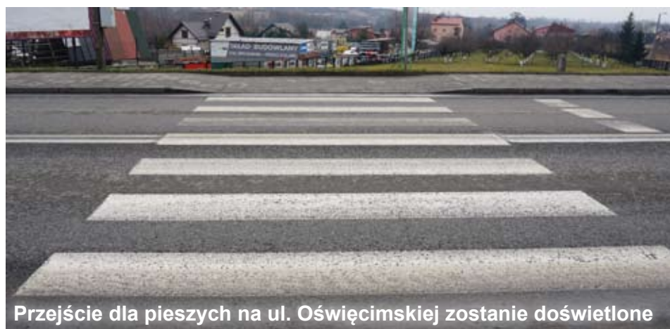
Przejście dla pieszych na ul. Oświęcimskiej zostanie doświetlone

Jeszcze w tym roku dwa kolejne przejścia dla pieszych w gminie Libiąż zostaną doświetlone. Chodzi o pasy na ruchliwych drogach wojewódzkich nr 780 i 933, z których korzysta sporo osób.