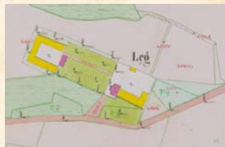
Zabudowania folwarku w Łęgu na mapie z 1848 r.

podane oczywiście według oryginalnej pisowni.