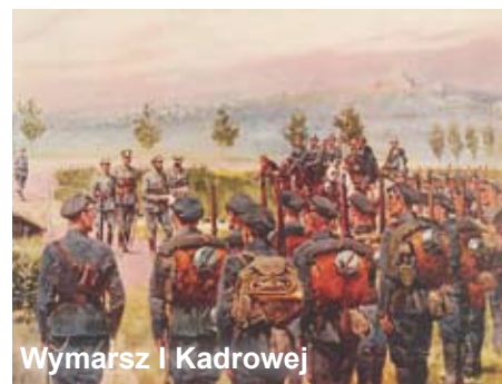
Wymarsz I Kadrowej

wyciągniętą siłą obronną i porządną z ogólnej siły narodu. W kraju i na emigracji zaczęły tworzyć się organizacje spiskowe mające na celu przygotowanie zrywu zbrojnego. Na przywódcę przyszłego powstania wyznaczono Tadeusza Kościuszkę, bohatera wojny o niepodległość Stanów Zjednoczonych oraz uczestnika wojny w obronie Konstytucji 3 Maja. Akt powstania i uroczy-