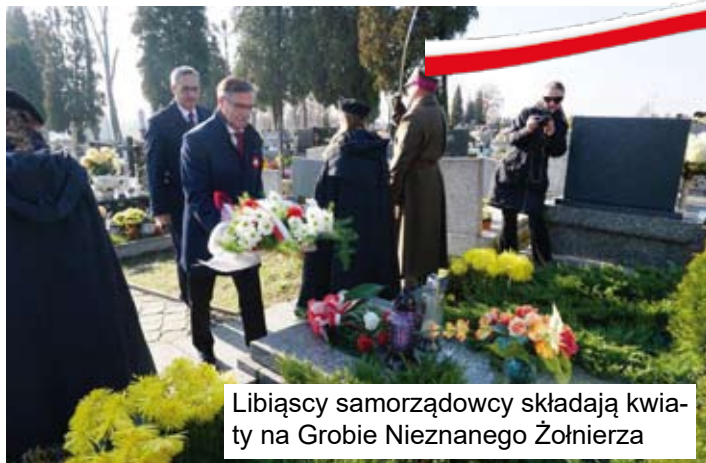
Libiąscy samorządowcy składają kwiaty na Grobie Nieznanego Żołnierza