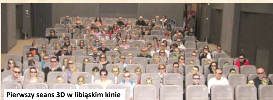
Pierwszy seans 3D w libiąskim kinie

okolicznościowe projekcje z okazji wydarzeń państwowych czy Dyskusyjne Koła Filmowe, w tym projekt "Ale!Stare Kino". Były też organizowane specjalne wydarzenia takie jak dni dziecka, halloween czy walentynki, oczywiście z repertuarem dopasowanym do okoliczności.