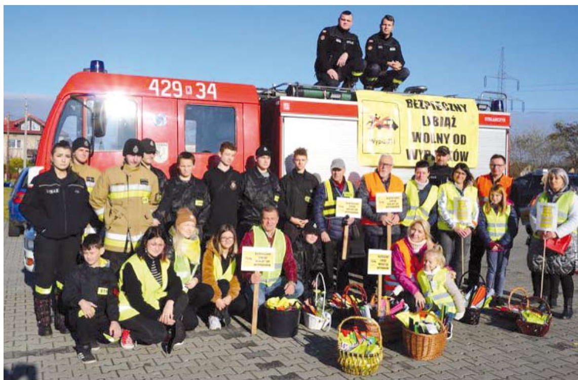
Organizatorzy i wolontariusze biorący udział w tegorocznej akcji „Bezpieczny Libiąż wolny od wypadków”.

Gdy nie ma odblasku i jest ubrany na ciemno, widać go dopiero z odległości 20 metrów. Pamiętajcie o tym i noście odblaski!