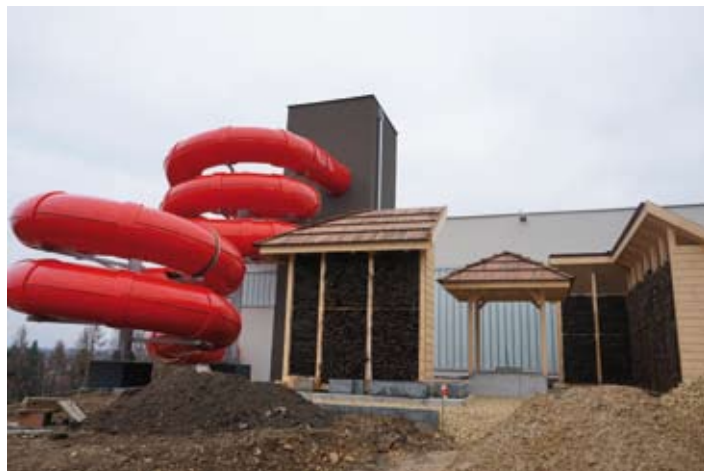
Jest już praktycznie gotowa tężnia solankowa

Największa inwestycja w historii gminy Libiąż powoli dobiega końca. Aktualnie trwają prace wykończeniowe i związane z wyposażeniem obiektu. Niecki basenowe są praktycznie gotowe. Podobnie sauny. Końca dobiegają roboty przy grocie solnej, a także znajdującej się na zewnątrz budynku tężni solankowej. Z tężni będzie można korzystać bezpłatnie, niezależnie od pływalni. Na frontowej ścianie budynku pięknie prezentuje się ścianka wspinaczkowa. Ona także jest już gotowa.