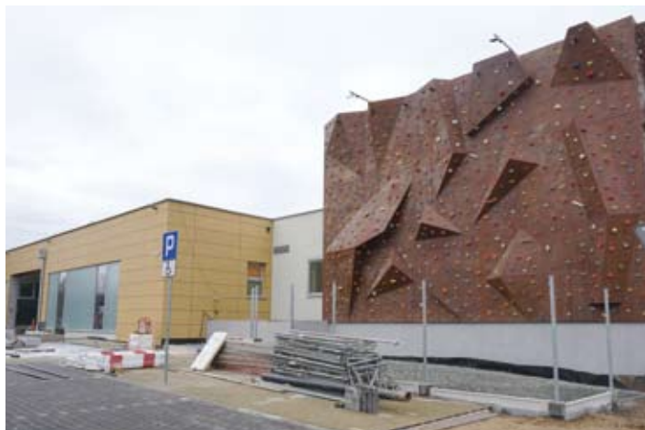
Wejście na krytą pływalnię i ścianka wspinaczkowa

Z namy termin otwarcia krytej pływalni w Libiążu. To 28 kwietnia przyszłego roku. W jednym miejscu mieszkańcy będą mogli popływać, skorzystać ze zjeżdżali, grot solnej, sauny, a także tężni solankowej i ścianki do wspinaczki. W podziemiach ma działać komercyjna strzelnica.