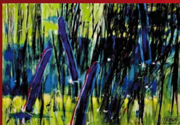
Cecylia Furgał - Promień