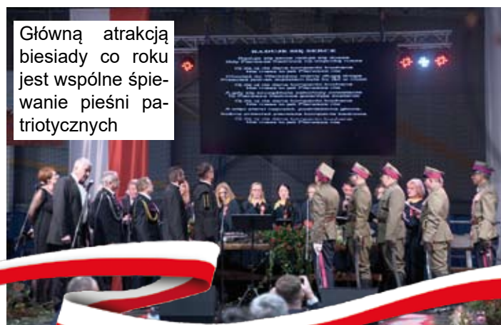
Główną atrakcją biesiady co roku jest wspólne śpiewanie pieśni patriotycznych