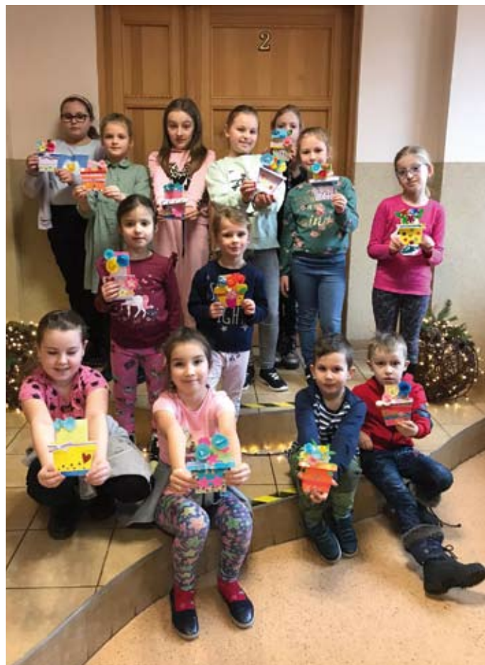
Zajęcia plastyczne w Żarkach

warsztatów etniczno-rytmicznych miały okazję do tańca i zabawy przy akompaniamencie różnych instrumentów. Ciekawe były również zajęcia capoeiry i tai chi. Swoje zdolności manualne i plastyczne młodzi i starsi ćwiczyli podczas warsztatów ceramicznych i plastycznych. Powstały wtedy piękne kolaże, prezenty na Dzień Babci i Dzień Dziadka, a także maski karnawałowe. Te ozdoby przydały się podczas balów, które odbyły się w Żarkach, Kosówkach i Libiążu. Czas miło spędzili nie tylko dzieci, bo w zabawę włączyli się także rodzice. Publiczność zgromadziły również teatryki lalkowe „Baśń o 12 miesiącach” wystawiane przez instruktorów LCK. Dodatkowo, po występach dzieci mogły obejrzeć kukielki i próbować je własnoręcznie animować.