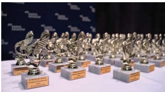
Statuetki ufundowane przez Starostwo Powiatowe w Chrzanowie