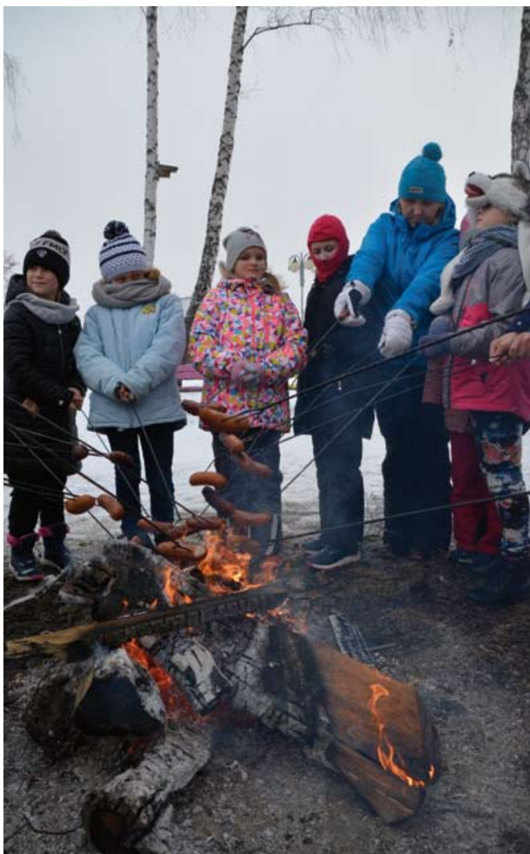
Ognisko z pieczonymi kielbaskami przy LCK