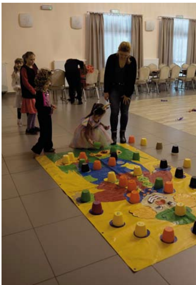
Gry i zabawy w Kosówkach