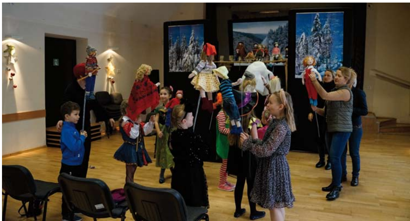
Teatryk lalkowy „Baśń o 12 miesiącach”