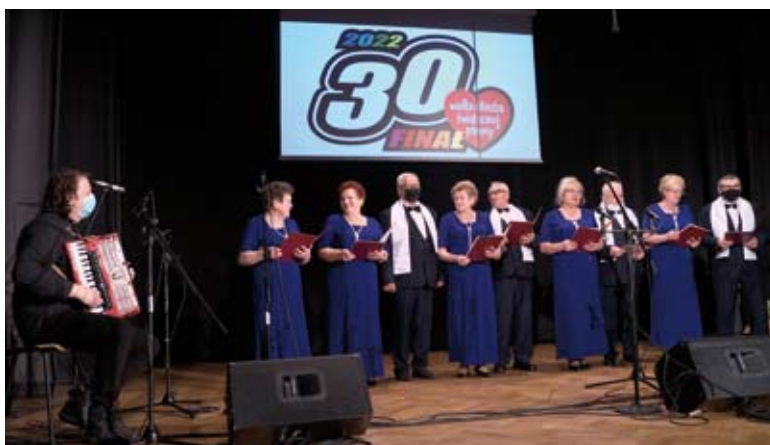
Występ Grupy Śpiewaczej Wrzos