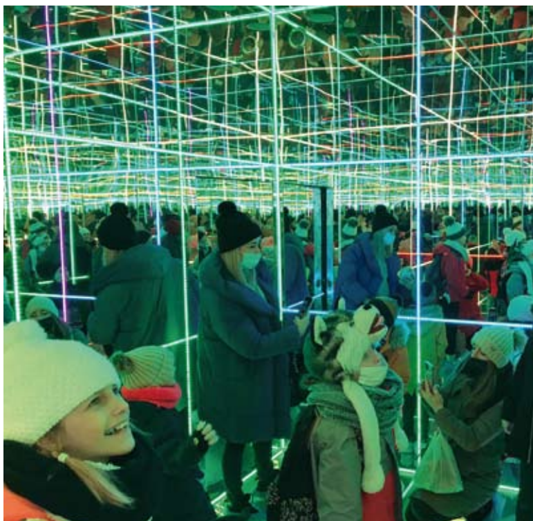
Wycieczka do Krakowa