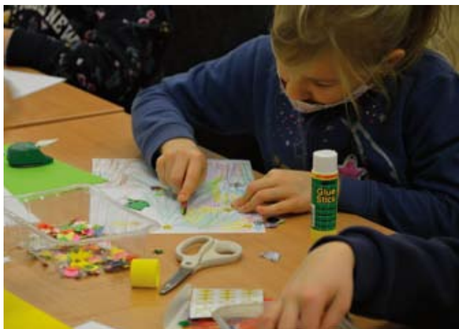
Zajęcia plastyczne w Libiążu