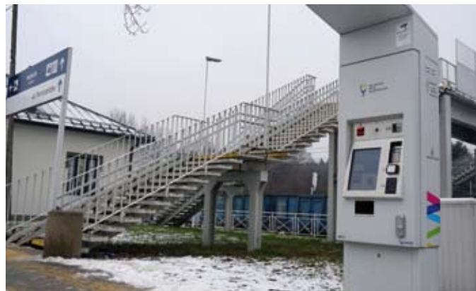
Biletomat przy stacji PKP w Libiążu

są to: Tarnów, Zakopane, Wieliczka, Nowy Targ, Miechów czy Oświęcim. Korzystanie z biletomatu jest bardzo proste. Wystarczy postępować zgodnie z instrukcją na wyświetlaczu. Płatność jest bezgotówkowa i odbywa się za pomocą kart płatniczych.