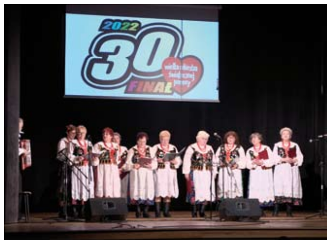
Występ Koła Śpiewaczego Libiążanki