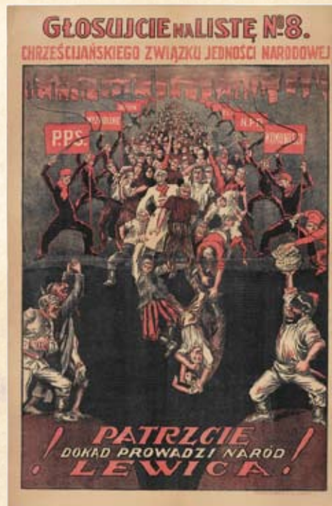
Plakat wyborczy listy nr 8 (Chrześcijańskiego Związku Jedności Narodowej) w wyborach z 1922 r.