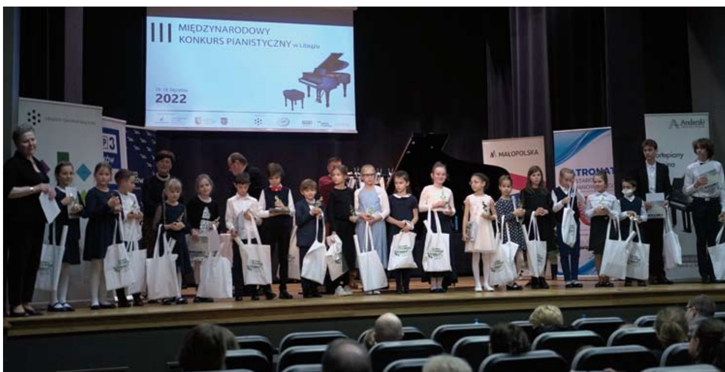
Uczestnicy III Międzynarodowego Konkursu Pianistycznego Libiąż 2022