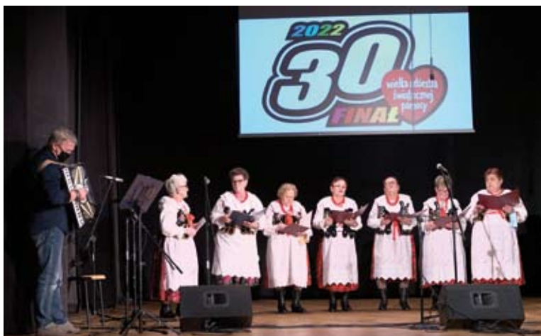
Występ Koła Śpiewaczego Macierzanki

taką kwotę udało się zebrać podczas 30. finału WOŚP w gminie Libiąż