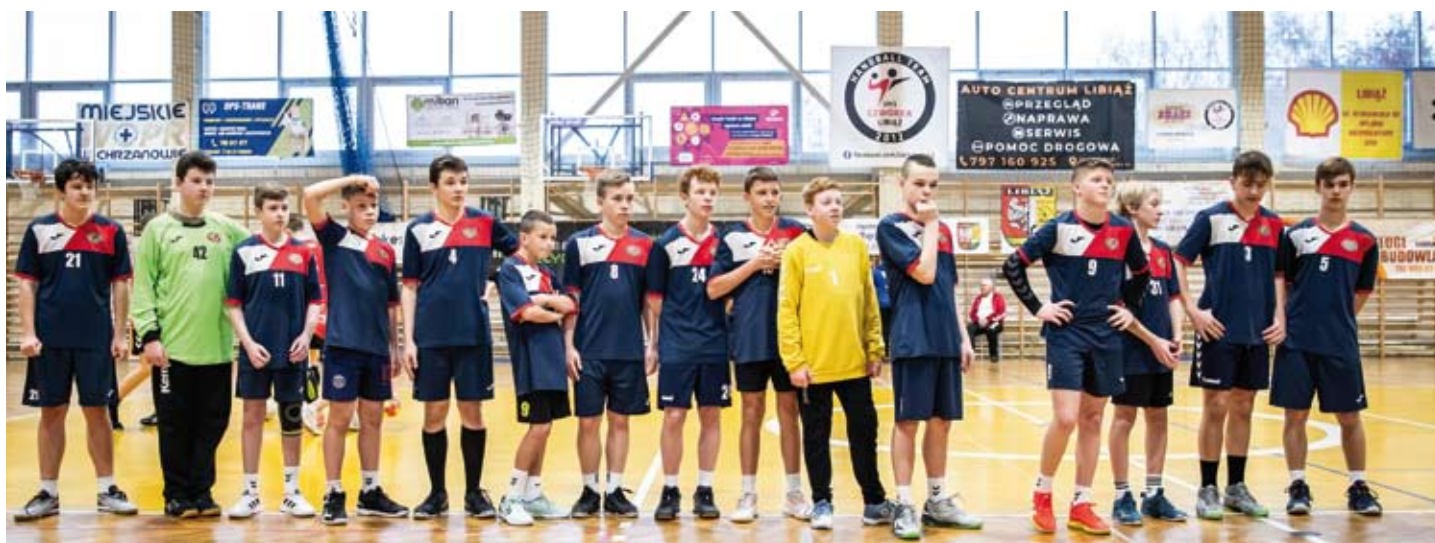
Zawodnicy UKS „Czwórka” Libiąż