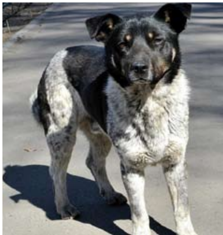
Bezpańskie psy z gminy Libiąż trafiają do schroniska w Chełmku

W przypadku zaginięcia zwierzęcia, prosimy o jak najszybszy kontakt telefoniczny z pracownikami schroniska, by sprawdzić czy pies nie został tu przywieziony.