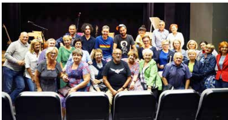
Występ zespołu „Dorośli” w ramach letnich koncertów „Na Leżakach”