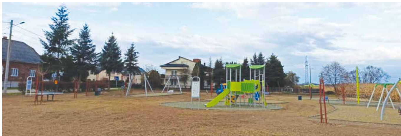
Kompleks sportowo-rekreacyjny przy ul. Kolonia w Gromcu

Jesteśmy pewni, że będzie to jedno z ulubionych miejsc do odpoczynku i rekreacji w Gromcu.