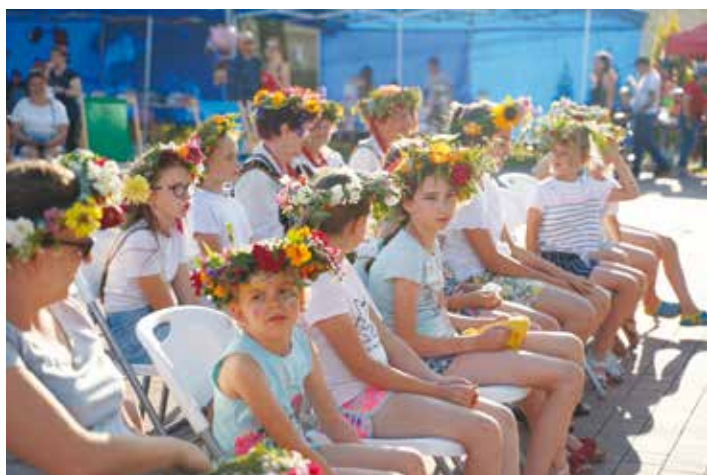
„Wiślanej Nocy Świętojańskiej” w Gromcu