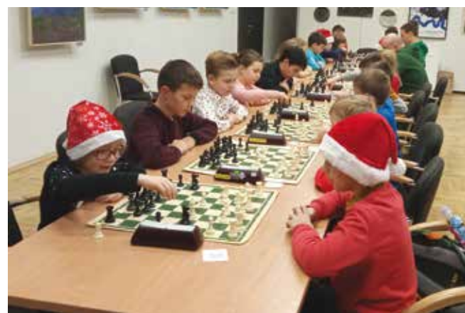
Mikołajkowy Turniej Szachowy zorganizowany przez GOS Energia Libiąż w LCK