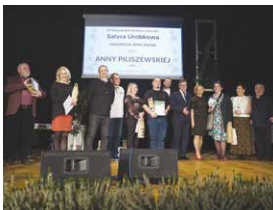
Gala Satyry Urobkowej 2022