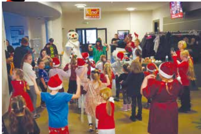
Wspólne tańce w LCK

Wizyta Mikołaja, gry, zabawy, konkursy, pieczenie ciasteczek, „bitwa śnieżna”, wspólne tańce, turniej szachowy, teatryk w wykonaniu grupy "Pióro" - mikołajki z Libiąskim Centrum Kultury w Libiążu, Żarkach i Gromcu były pełne atrakcji.