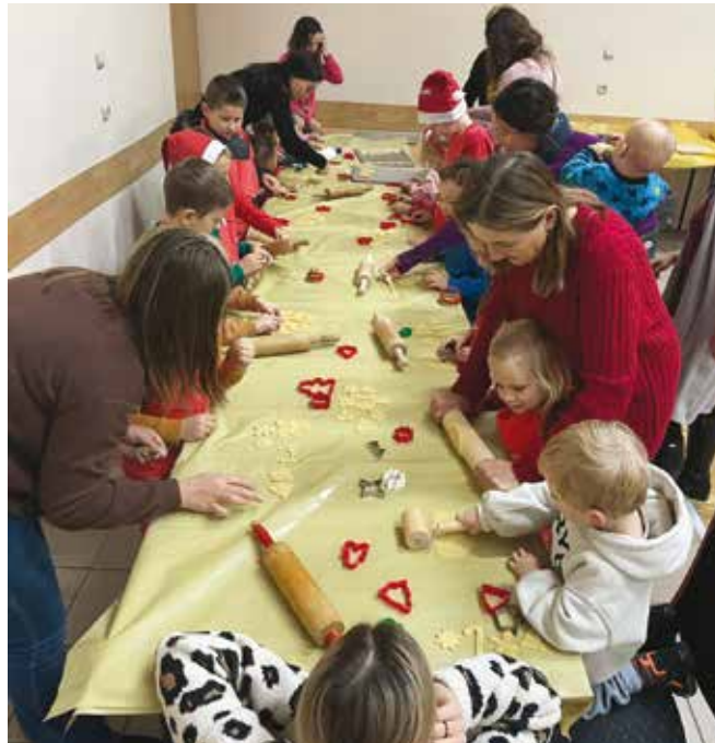
Cukiernia św. Mikołaja w Gromcu