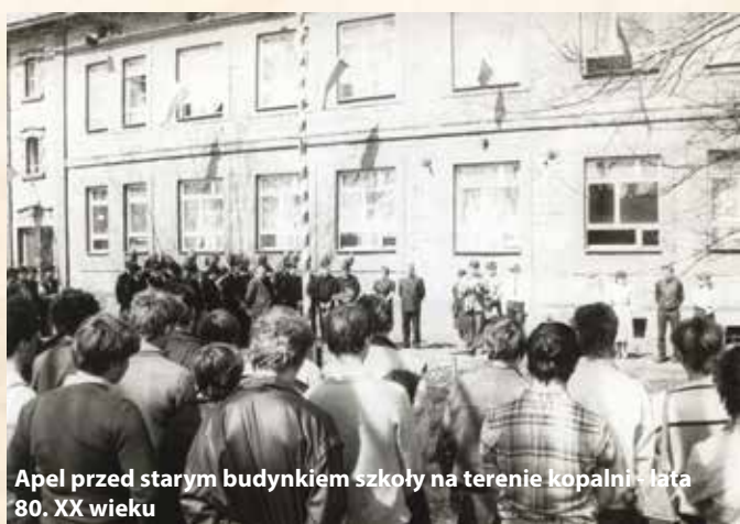
Apel przed starym budynkiem szkoły na terenie kopalni - lata 80. XX wieku