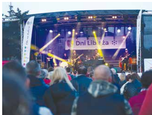
Koncert zespołu Sztynwy Pal Azji podczas Dni Libiąża 2022