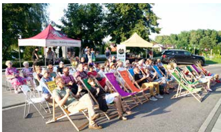
Koncert „Na Leżakach”