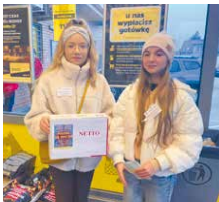
Wolontariuszki podczas zbiórki

Dzięki hojności mieszkańców jeszcze przed świętami do rodzin z gminy Libiąż znajdujących się w trudnej sytuacji życiowej trafiły świąteczne paczki. To efekt zbiórki żywności pod hasłem „Podziel się sercem” zorganizowanej pod patronatem Rady Miejskiej w Libiążu.