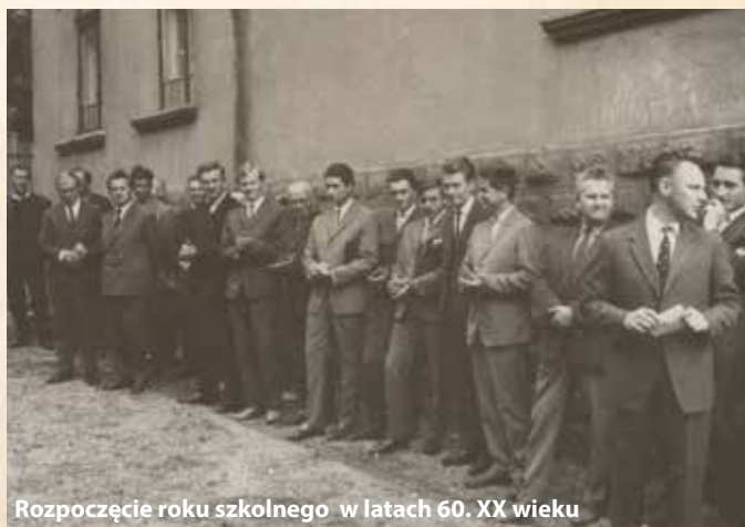
Rozpoczęcie roku szkolnego w latach 60. XX wieku

Szkoła została utworzona 1 września 1962 r. decyzją Podsekretarza Stanu w Ministerstwie Górnictwa i Energetyki. Pierwotna nazwa to: Zasadnicza Szkoła Górnicza Kopalni Węgla Kamiennego „Janina” w Libiążu. Prologiem do utworzenia placówki była działalność w latach 1945-1954 3-Klasowej Szkoły Doksztalującej Zawodowej Przemysłu Węglowego. Później przekształcona w Szkołę Przemysłową Górniczą Jaworznicko-Mikołowskiego Zjednoczenia Przemysłu Węglowego, a w kolejnych latach w Zasadniczą Szkołę Górniczą Ministerstwa Górnictwa. Utworzenie takiej placówki oświatowej w Libiążu – wówczas wsi – podyktowane było potrzebą uzupełnienia kadr dla rozbudowującej się kopalni. Zajęcia odbywały się w zakładzie i w budynku na Leśniowej. Jesienią 1954 r. szkołę zlikwidowano, ale do tego momentu jej mury opuściło ok. 200 absolwentów.