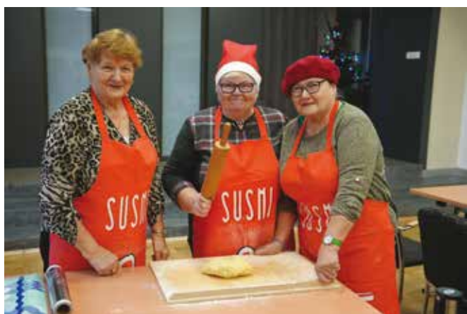
Dziękujemy paniom z KGW „Libiążanki” za pomoc w organizacji Cukierni św. Mikołaja