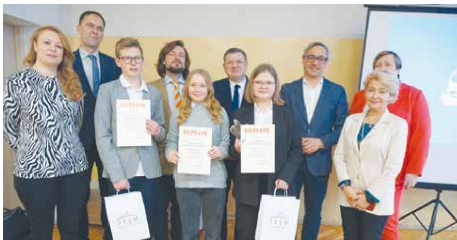
Uczestnicy i organizatorzy konkursu