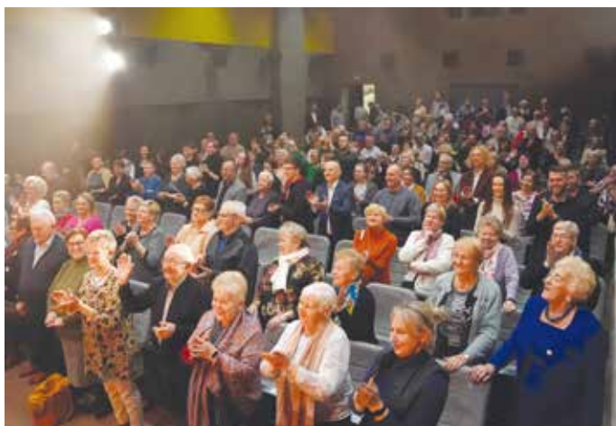
Owacja na stojąco po występie