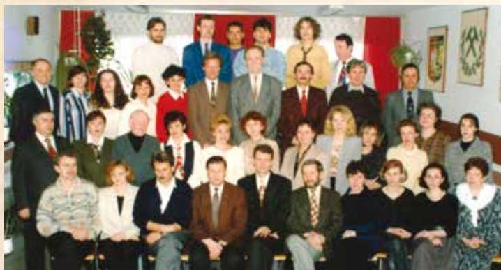
Grono pedagogiczne w roku szkolnym 1995/1996