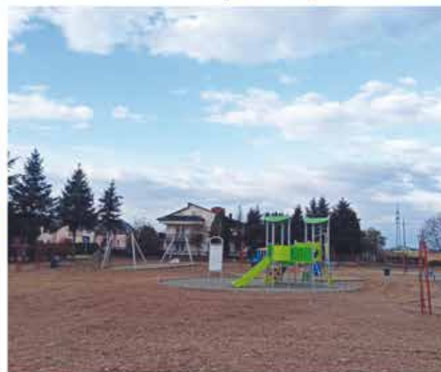
Plac zabaw w Gromcu