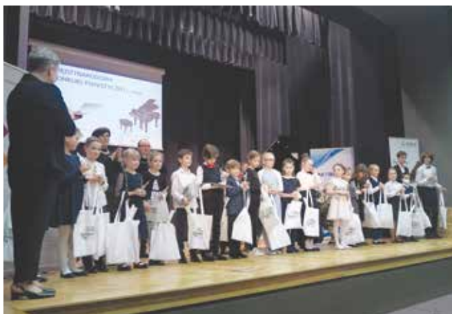
III Międzynarodowy Konkurs Pianistyczny w Libiążu