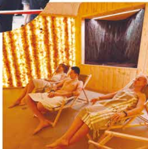
Strefa saun - Park Wodny Libiąż