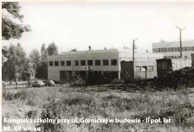
Kompleks szkolny przy ul. Górnicy w budowie - II poł. lat 80. XX wieku