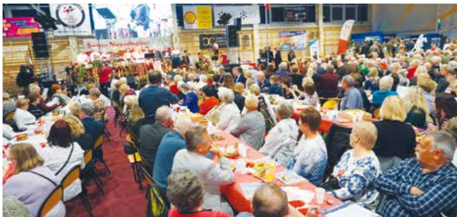
Uczestnicy tegorocznej Biesiady

11 listopada w naszej gminie było radośnie i biało-czerwono.