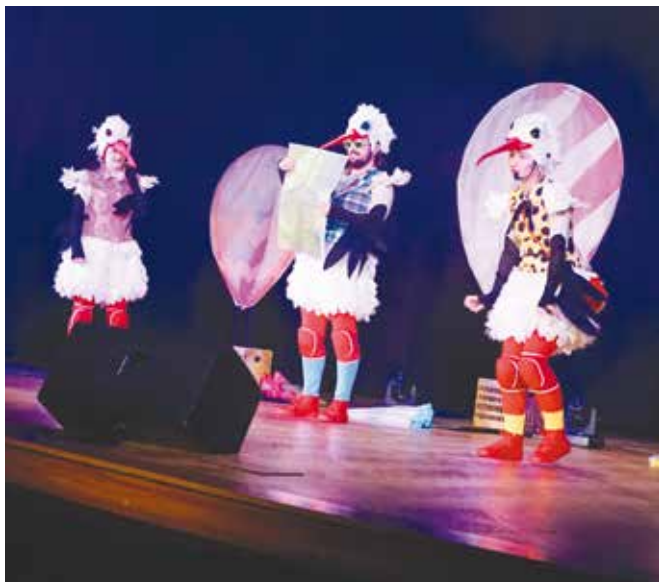
Spektakl „Ekonolulu” w wykonaniu Teatru Kultureska

„Prezent dla Ziemi”. Laureaci otrzymali nagrody ufundowane przez libiąski magistrat.