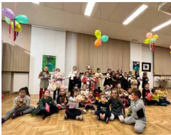
Dzień Pluszowego Misia w LCK

nie koncerty na „scenie pod filarami”. Libiąski Bieg z Uśmiechem przyciągnął do naszego miasta fanów tego sportu. 11 listopada mieszkańcy Libiąża i okolic bawili się podczas Biesiady Patriotycznej. Grudzień jest również pełen wydarzeń, o czym przekonacie się Państwo przeglądając ten, a także kolejny numer „Kuriera Libiąskiego”.