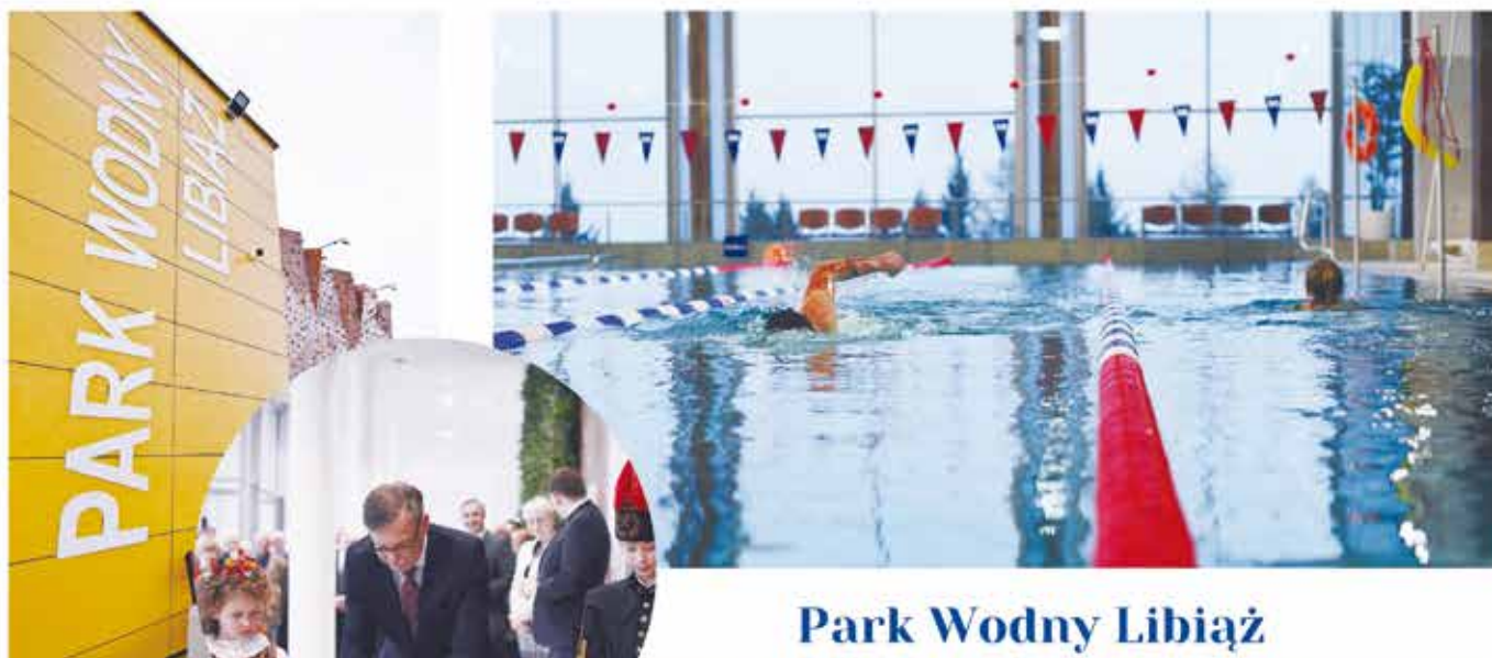
Park Wodny Libiąż