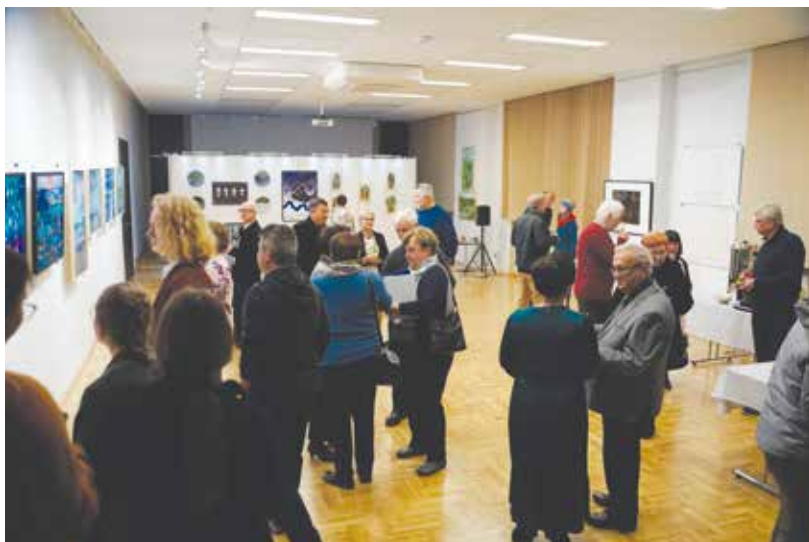
Wernisaz wystawy „Nadwiślańskie Impresje Gminy Libiąż”.