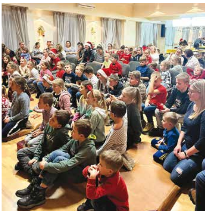
Mikołajki w Żarkach