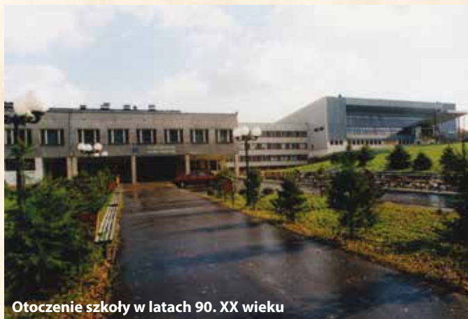
Otoczenie szkoły w latach 90. XX wieku