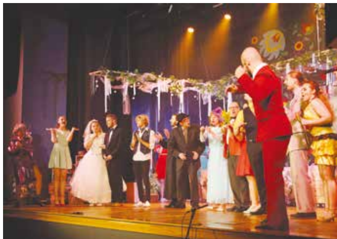
Aktorzy podczas musicalu na scenie