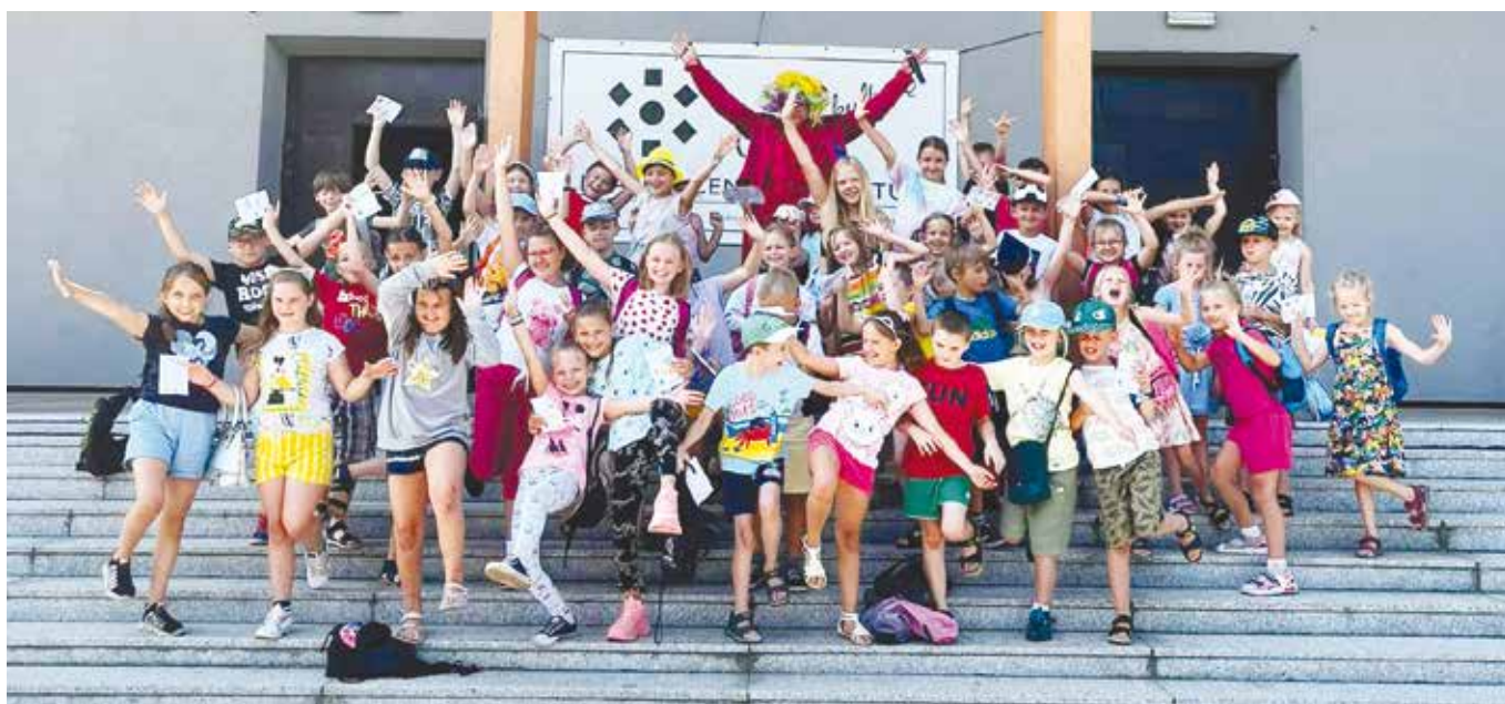
Letnia Akademia Pana Kleksa

a to tylko część działalności LCK w 2022 r.