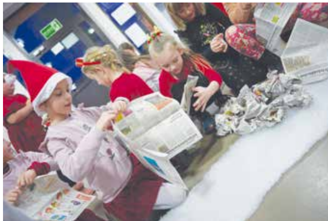
Przygotowania do „śnieżnej bitwy”