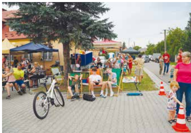
Piknik na powitanie lata w Żarkach