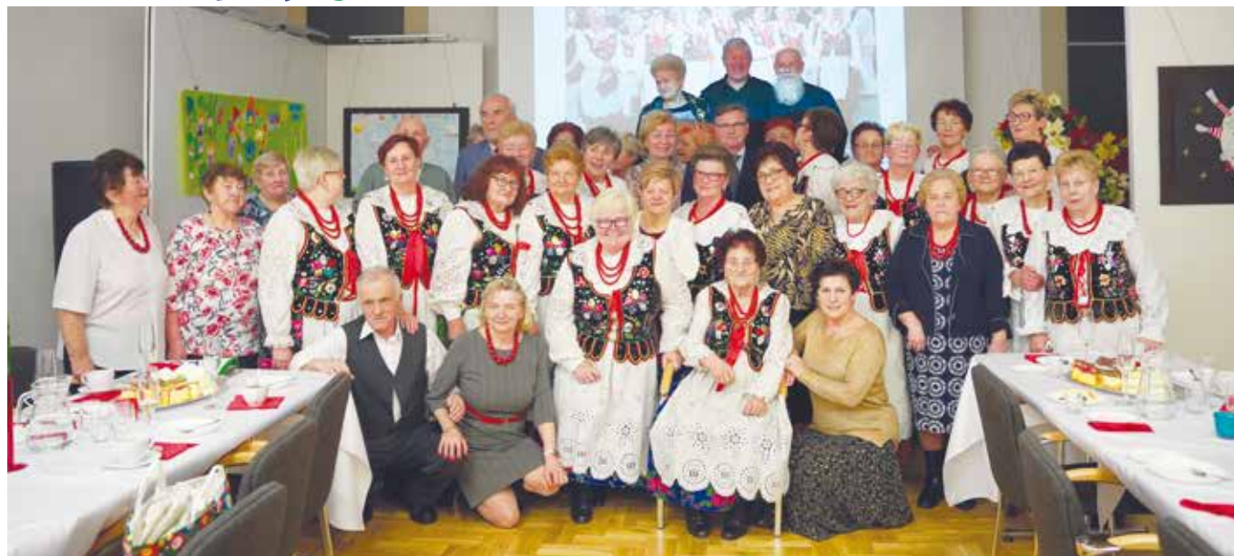
Spotkanie KGW „Libiążanki”

Zespół Śpiewaczy "Libiążanki" działający w ramach Koła Gospodyń Wiejskich w Libiążu ma już 40 lat.