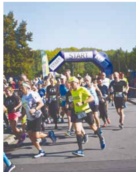
Libiąski Bieg z Uśmiechem 2022

a to tylko część działalności LCK w 2022 r.