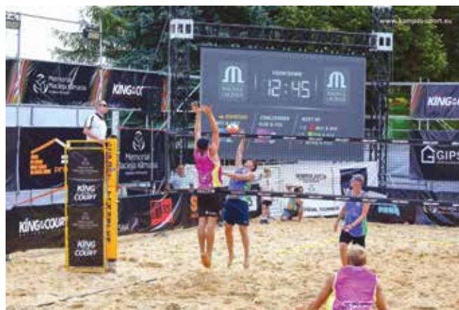
Zawody były rozgrywane w ramach King of the Court