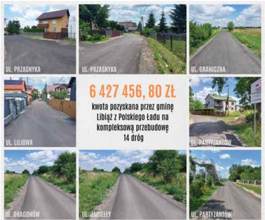
Modernizowane ulice w gminie Libiąż

Prace przebiegają zgodnie z harmonogramem. Ich zakres przewiduje m.in. wzmocnienie podbudowy i wymianę starej nawierzchni. Na niektórych gminnych drogach roboty się zakończyły. W Gromcu wyremontowana została ul. Graniczna i ul. Dragonów, a w Żarkach ul. Przasnyka. W Libiążu prace zakończyły się na ulicach: Liliowej, Jagiełły, Łokietka i Partyzantów, a na ul. Jaskótczej została jeszcze do położenia warstwa ścieralna. Wykonane zostaną tu także roboty wykończeniowe. Jeżeli chodzi o pozostałe gminne drogi objęte projektem, to trwają roboty związane z infrastrukturą wodociągową i gazową. Dopiero po ich zakończeniu, będzie można wznowić prace drogowe. Do wykonania pozostały w Żarkach ulice: Fałata i Trylogii, a w Libiążu ulice: Owocowa, Rolna, Górna i Łabędzia.