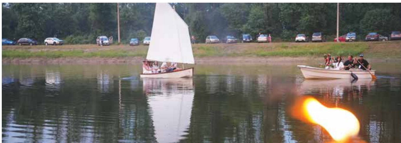
Rzucanie wianków podczas Nocy Świętojańskiej

Wiele emocji wzbudziły pokazy akrobatyki powietrznej w wykonaniu podopiecznych Power Studio w Chrzanowie. Na scenie zaprezentował się najpierw zespół Ludzie, a później gwiazda wieczoru, czyli Loka. Po występie uczestnicy symbolicznie puścili wianki na wodzie. Wieczór zakończył pokaz Teatru Ognia Tesseract.