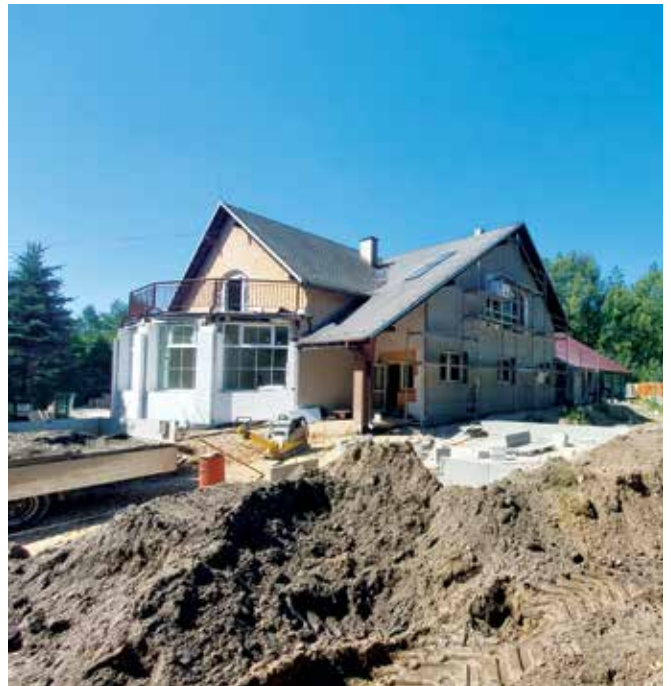
Modernizowana Świetlica w Kosówkach

- W związku z prowadzonymi pracami świetlica w Kosówkach jest nieczynna. Zakres prac jest szeroki. Wykonywane jest zaplecze sanitarne, magazynowe i gastronomiczne oraz wymieniana stolarka okienna i drzwiowa. Poza tym wykonamy przebudowę części dachu i wymienimy pokrycie. Na po-