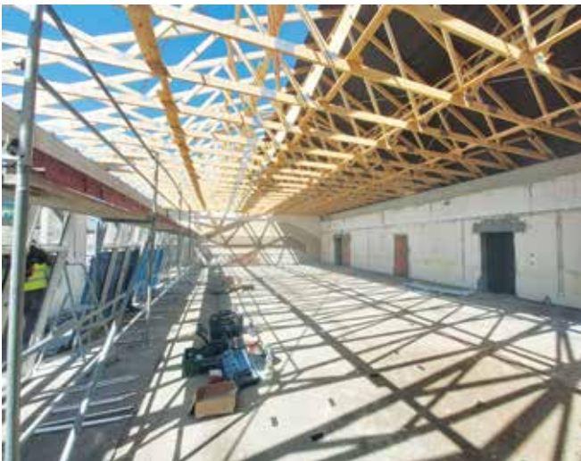
Wnętrze przebudowywanej Świetlicy w Gromcu

Jednocześnie modernizowana jest świetlica w Gromcu oraz zaplecze klubu sportowego, na czym najbardziej zależało gminie i lokalnej społeczności, a także znajdująca się w budynku obok filia Miejskiej Biblioteki Publicznej w Libiążu.