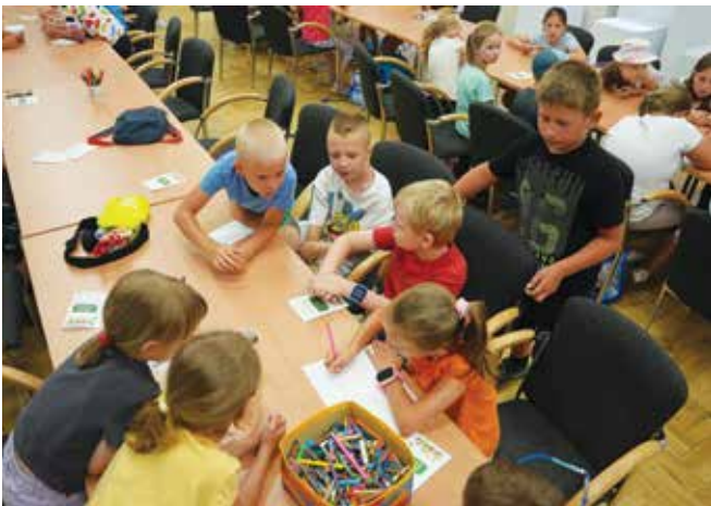
Rozdanie Dzienniczków Zoologa