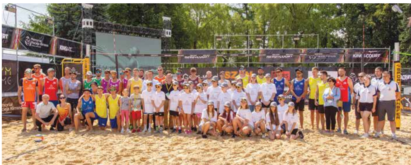
Pamiętkowe zdjęcie zawodników, organizatorów i wolontariuszy