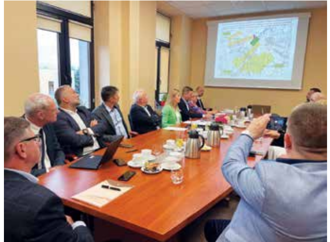
Kolejne spotkanie zaplanowano na październik. Tym razem odbędzie się w gminie Babice, gdzie mieszkańcy także odczuwają wstrząsy.