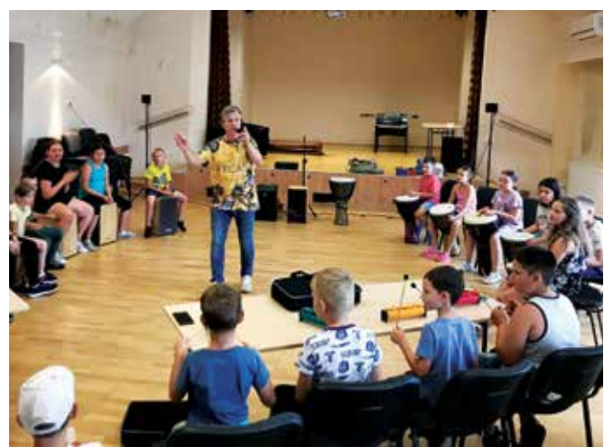
Warsztaty bębniarskie w Żarkach