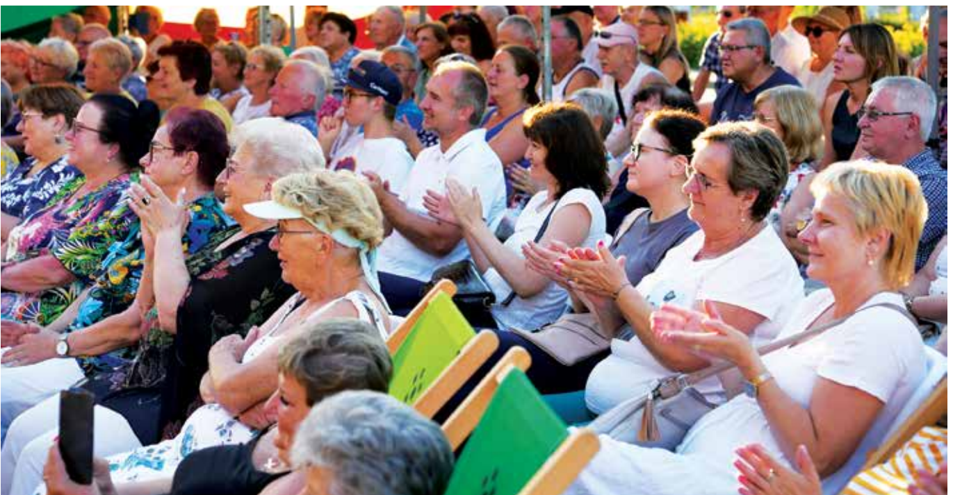
Publiczność podczas występu Kabaretu RAK

My się z Respondkiem na scenie świetnie bawimy. Jesteśmy stworzeni, aby improwizować, ponabijać się z siebie. Czasem nawet balansujemy na granicy dobrego smaku, ale o to chodzi w kabarecie. Najważniejsze, żeby ludzie dobrze się bawili.