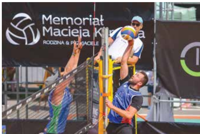
Zawodnicy rywalizowali o każdą piłkę