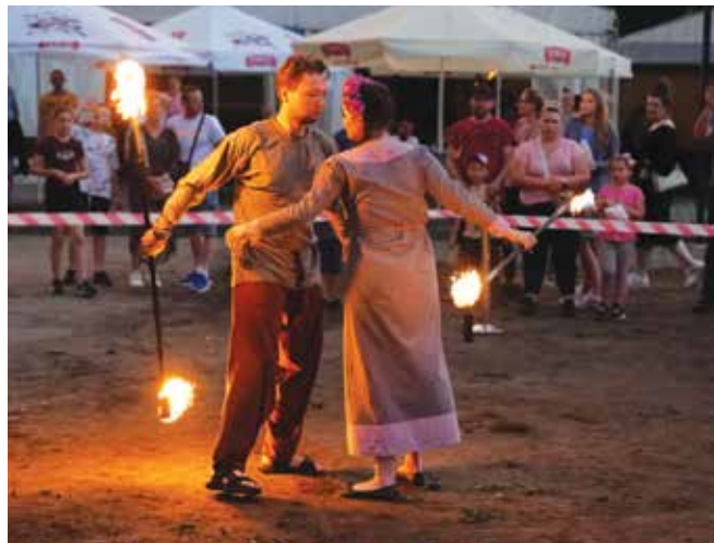
Taniec w wykonaniu Teatru Ognia Tesseract

skiego Bezan Yacht Clubu, która oferowała rejsy po jeziorze i udział w konkursach.