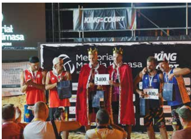
Koronacja zwycięzców turnieju