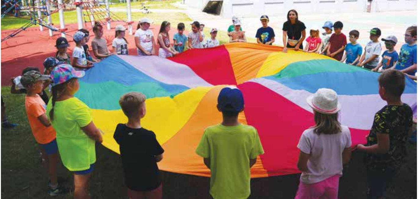
Zabawy w Miejskim Ośrodku Rekreacyjno-Sportowym

Wycieczki do ciekawych miejsc, poznawanie całego świata, zajęcia sportowe, warsztaty ceramiczne, bębniarskie, wokalne, rejs po Wiśle i wizyta w fabryce krówek – to tylko część wakacyjnych propozycji LCK dla dzieci i młodzieży. Ostatnia odsłona cyklu Wakacje dookoła świata „Podróż za jeden uśmiech” rozpocznie się w czwartek 28 sierpnia.