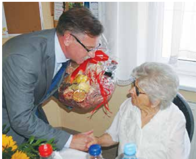
Życzenia Jubilatce złożył także burmistrz Libiąża

Gdy tylko jest ciepło, czas spędza siedząc na ganku, popijając kawę ciastko. Na pytanie, czego jej życzy z okazji tak wyjątkowych urodzin, uśmiecha się i odpowiada – zdrowia. Tego jej więc życzymy: zdrowia, wielu radosnych i słonecznych dni!