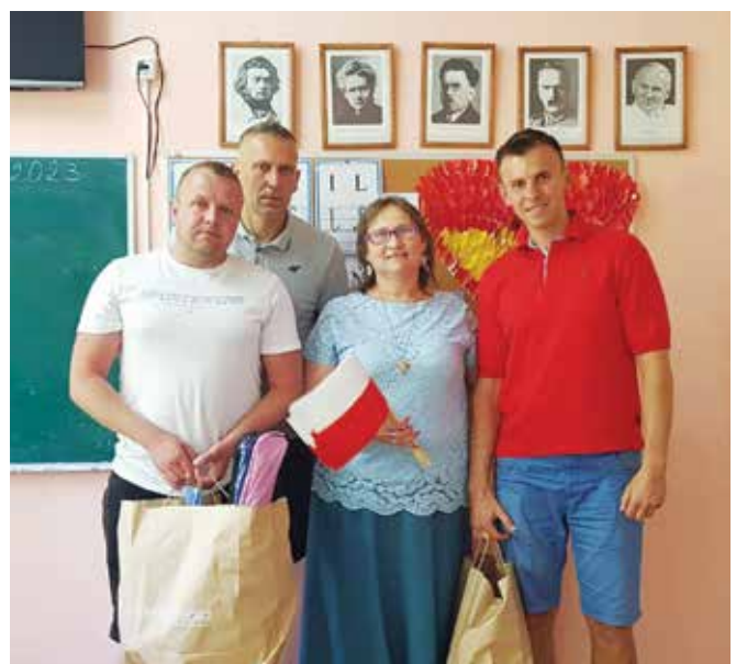
Kibice z opiekunką polskiej klasy w Glodeni

uczą się czytać i pisać w języku polskim, a także kultywują ojczyste tradycje. Do uczniów trafiły m.in. artykuły szkolne oraz sprzęt sportowy.