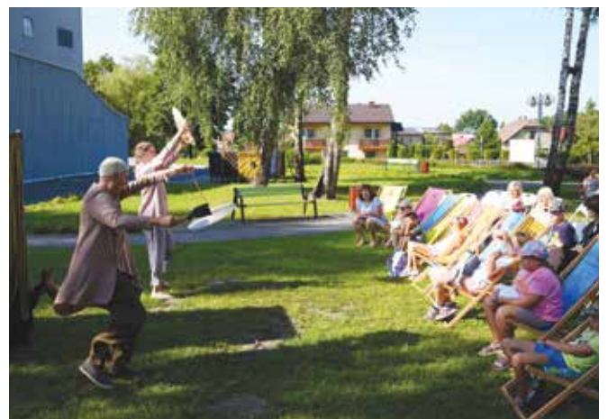
Spektakl „Ananas” w wykonaniu Teatru USZYTY