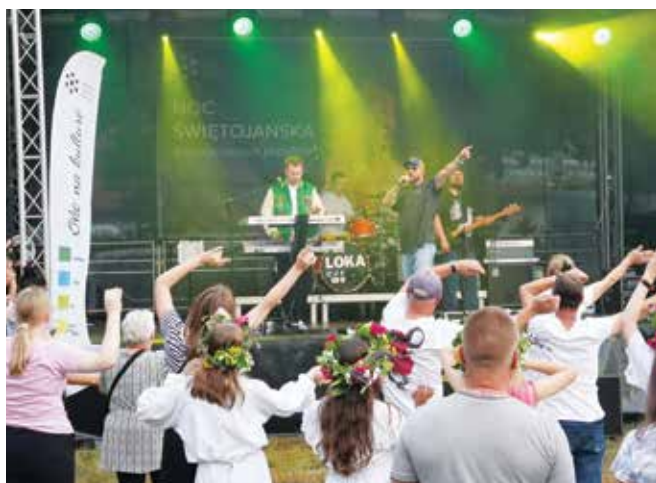
Koncert Zespołu LOKA