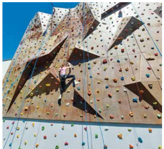
Ścianka wspinaczkowa w Parku Wodnym Libiąż

W weekendy obowiązuje oferta specjalna – użytkownicy nie muszą wcześniej rezerwować obiektu. Natomiast na recepcję trzeba się zgłosić minimum 20 minut wcześniej, by wnieść opłatę i złożyć niezbędne oświadczenia.