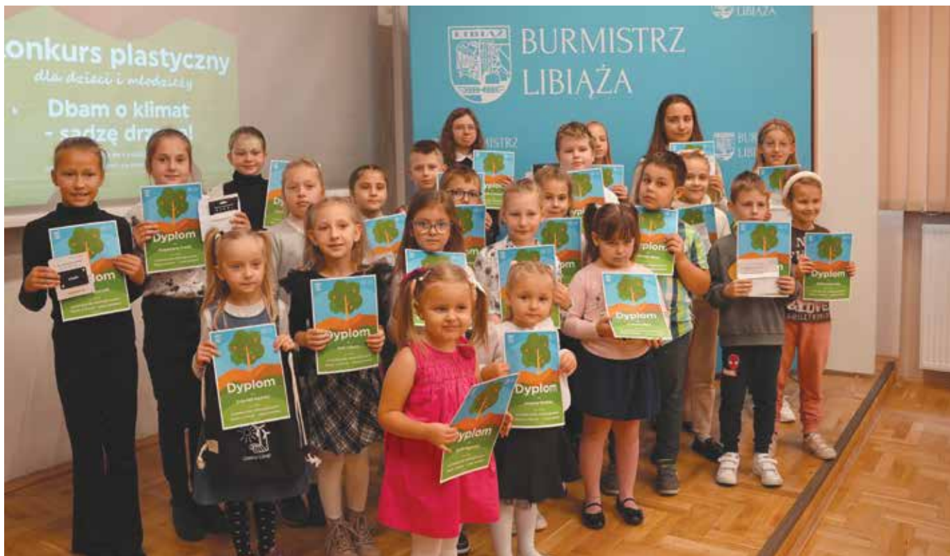
Nagrodzeni uczestnicy konkursu „Dbam o klimat - sadzę drzewa”

Blisko 100 pięknych prac wykonanych przez niezwykle uzdolnione dzieci z naszej gminy wpłynęło na ekologiczny konkurs zorganizowany przez Wydział Ochrony Środowiska Urzędu Miejskiego w Libiążu oraz Libiąskie Centrum Kultury.