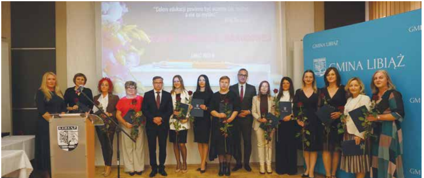
Uroczystość wręczenia nagród dla dyrektorów i nauczycieli w LCK

Tradycyjnie już Dzień Edukacji Narodowej był w gminie Libiąż okazją do podziękowania nauczycielom i pracownikom oświaty. Burmistrz Libiąża wręczył także nagrody za szczególne osiągnięcia dydaktyczne, wychowawcze i opiekuńcze.