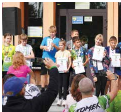
Zwycięzcy Biegu z Uśmiechem dla dzieci