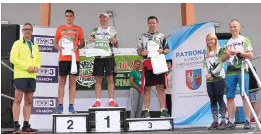
Wręczenie nagród w kategorii Gmina Libiąż Najszybszy Mężczyzna 10 km