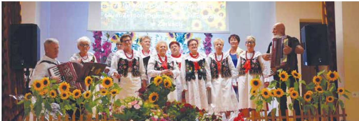
Występ Macierzanek podczas jubileuszu

Uroczysta msza, życzenia, gratulacje, wspomnienia i występy oraz pyszny tort – tak we wrześniu świętowaliśmy jubileusz 75 lat Koła Gospodyń Wiejskich w Żarkach oraz 65 lat Zespołu Śpiewaczego Macierzanki w Żarkach.