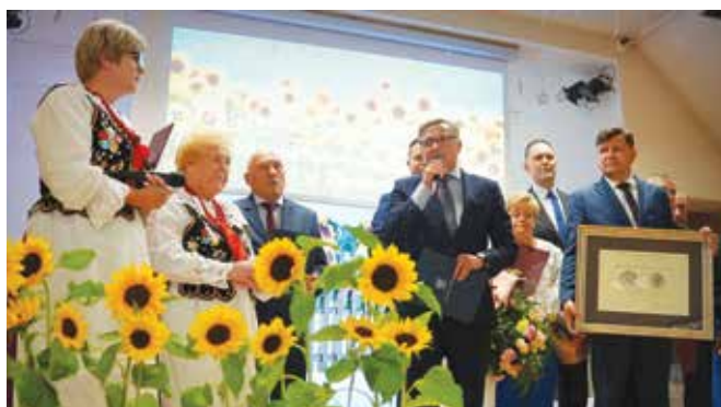
Gratulacje dla KGW składa burmistrz i zaproszeni goście