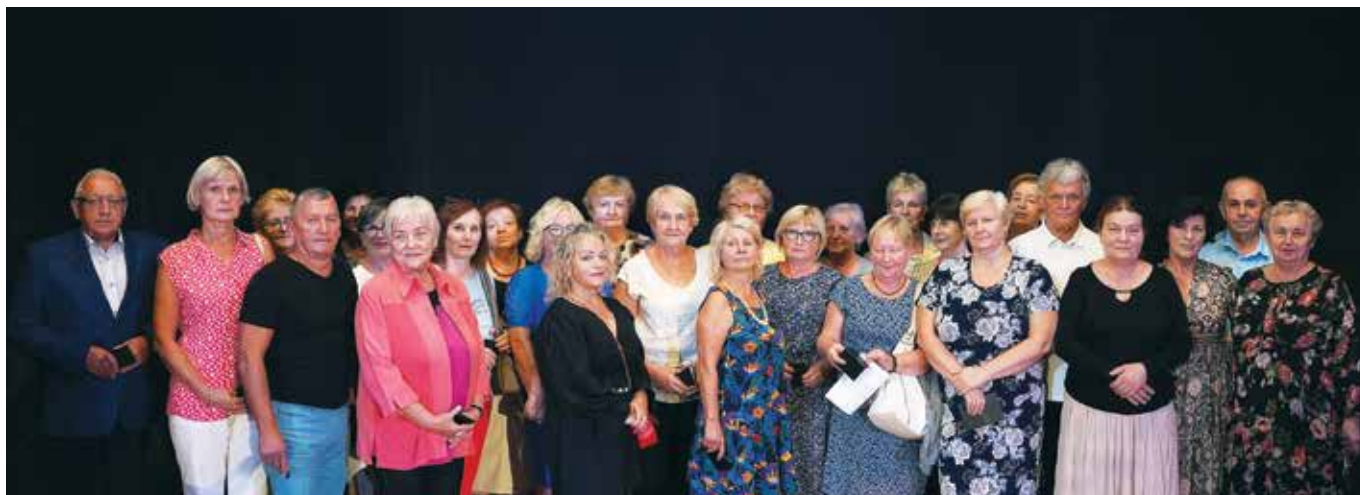
Podczas inauguracji nowego semestru UTW w Libiążu

w Kętach występem „Lata 20., lata 30.”. Po występie seniorzy zostali zaproszeni do Galerii Sztuki LCK, na wernisaż wystawy „Ginący świat” Justyny Harris. Mogli tam zobaczyć nie tylko wykonane w stylu harmonizmu prace, ale podziwiać cały proces tworzenia obrazów.