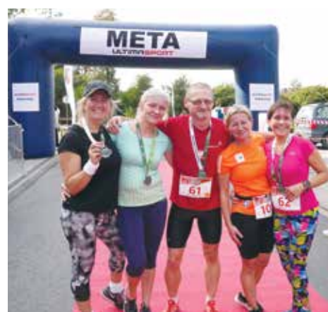
Uczestnicy Libiąskiego Biegu z Uśmiechem z pamiątkowymi medalami