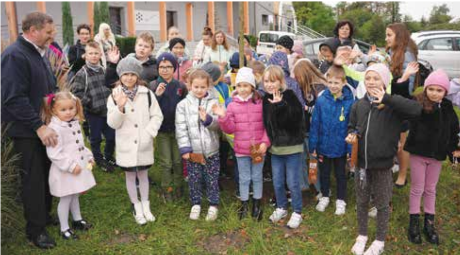
Uczestnicy konkursu zasadzili blisko 4-metrowe drzewo przy LCK