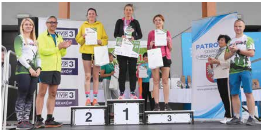
Wręczenie nagród w kategorii Gmina Libiąż Najszybsza Kobieta 5 km