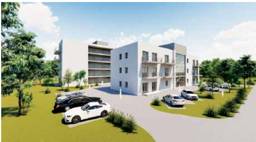
Wizualizacja nowych bloków.

Spółka SIM Zagłębie, która w Libiążu wybuduje nowe mieszkania, zaprezentowała wizualizację dwóch bloków. Jeżeli wszystko pójdzie zgodnie z planem, budowa rozpocznie się w 2024 roku.