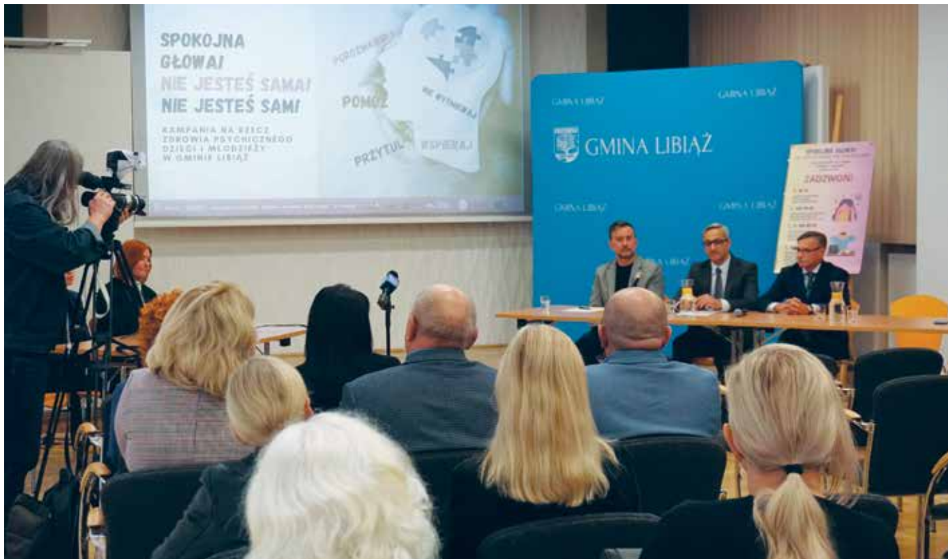
Konferencja inauguracyjna kampanię gminy Libiąż

W Światowym Dniu Zdrowia Psychicznego gmina Libiąż zainicjowała kampanię wspierającą zdrowie psychiczne dzieci i młodzieży pod hasłem „Spokojna głowa! Nie jesteś sama! Nie jesteś sam!”. Jej celem jest okazanie wsparcia uczniom w kryzysie psychicznym i przekonanie ich do tego, by nie wstydzić się sięgać po pomoc.