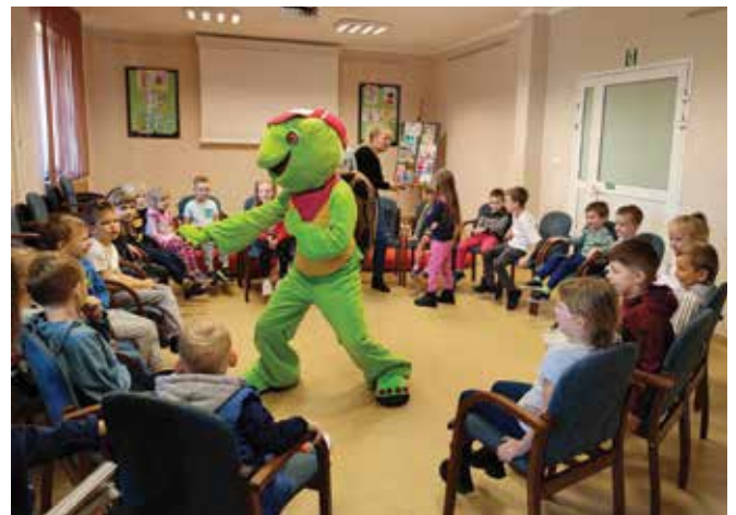
Spotkanie z żółwiem Franklinem

Prace dzieci można obejrzeć na wystawie w Miejskiej Bibliotece Publicznej.