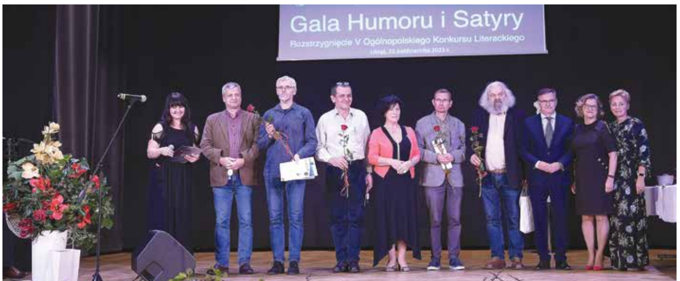
Uczestnicy Gali Humoru i Satyry w Libiążu