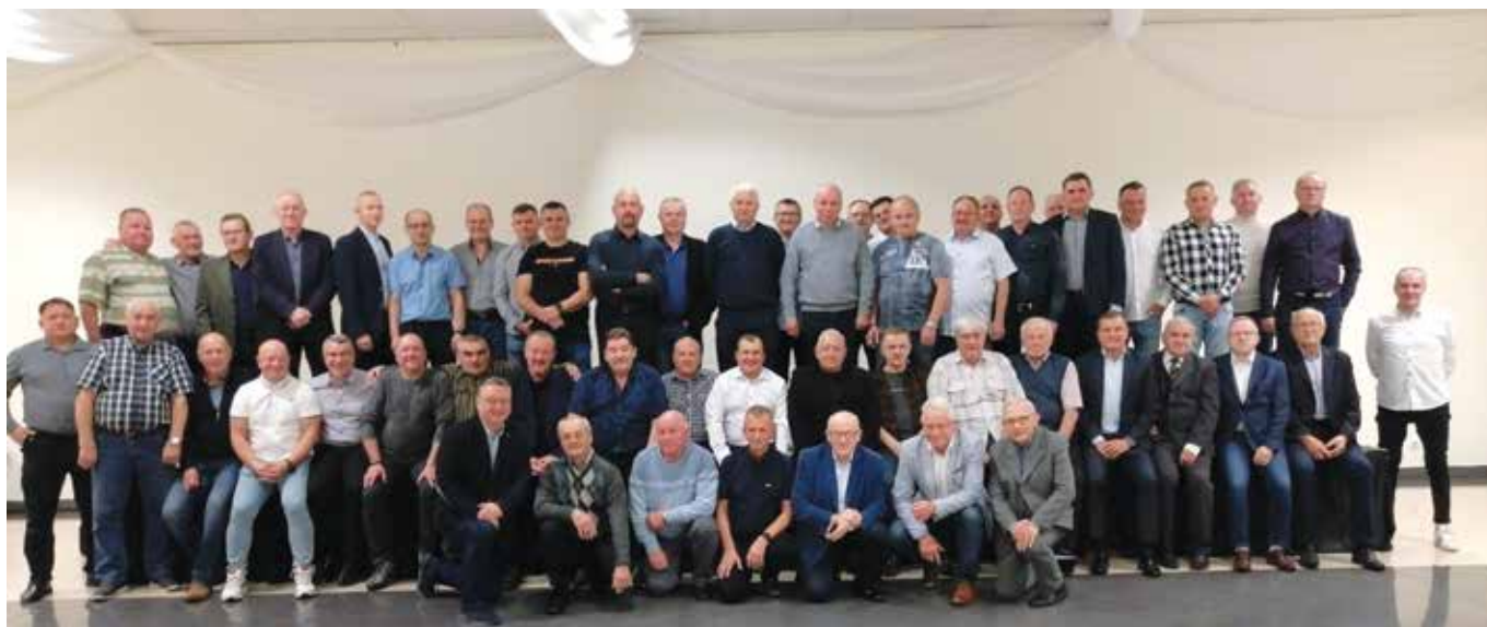
Pamiątkowe zdjęcie uczestników spotkania.