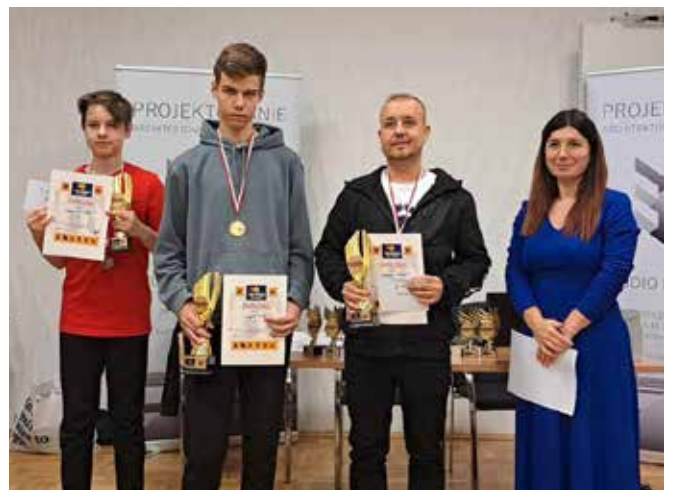
Zwycięzcy turnieju.