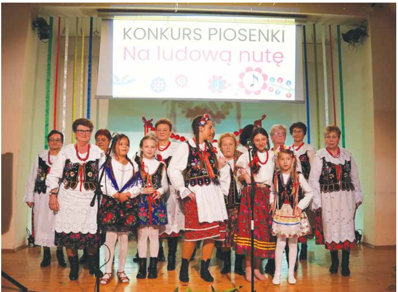
Uczestnicy konkursu „Na ludową nutę”