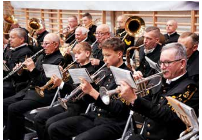
Występ Górniczej Orkiestry Dętej ZG Janina