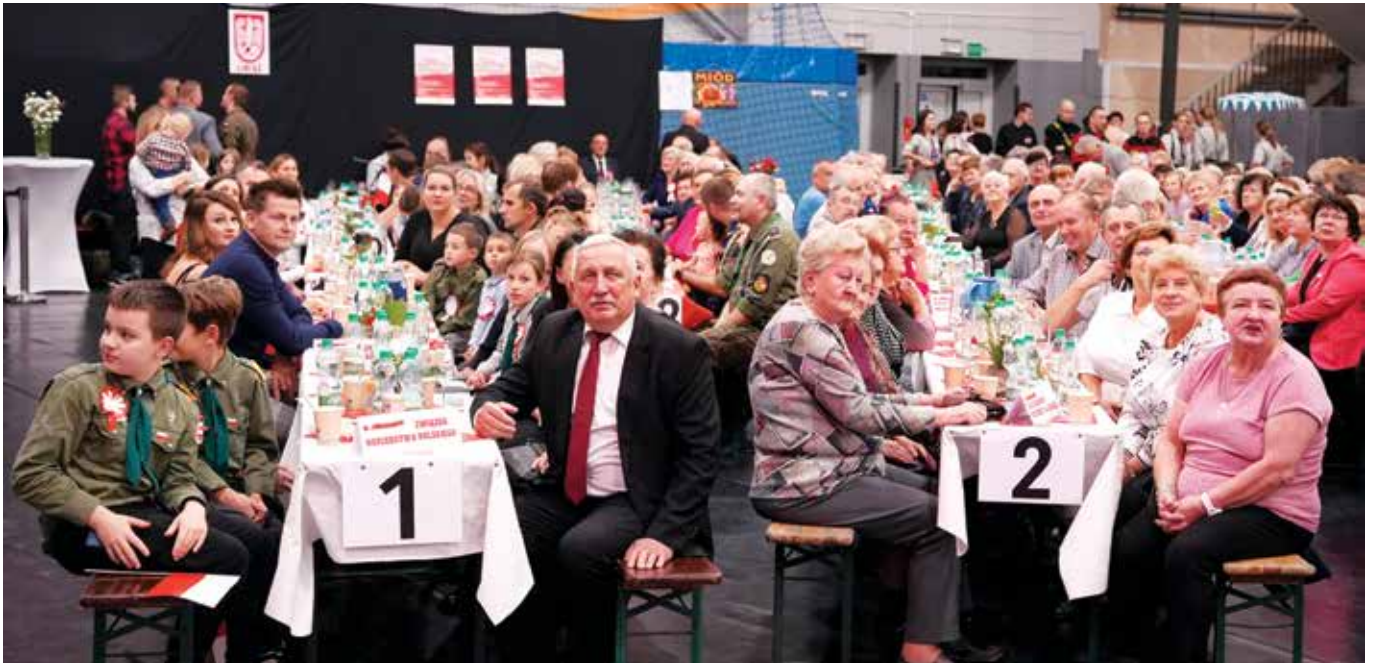
Uczestnicy 25 Libiąskiej Biesiady Patriotycznej

Miejska Biblioteka Publiczna w Libiążu Stowarzyszenie Muzyków Canticum Canticorum Wodociągi Chrzanowskie sp. z o. o. Maciej Rodziński z La-sad sp. z o. o. ZHP Hufiec Chrzanów Drużyna Libiąż Szkoła Tańca „Magic Dance”