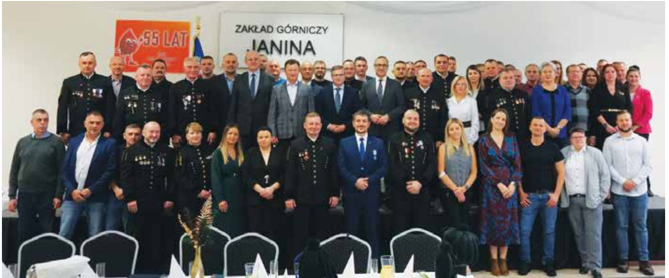
Jubileuszowe spotkanie libiąskich krwiodawców

Stowarzyszenie Honorowych Dawców Krwi przy ZG Janina w Libiążu obchodziło jubileusz 55-lecia. Zanim krwiodawcy zaczęli świętować, honorowo oddali krew podczas kolejnej już zorganizowanej w tym roku zbiórki.