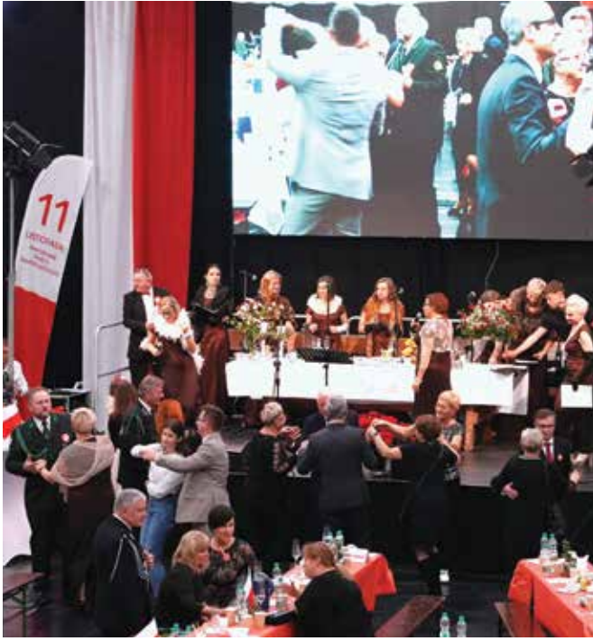
Podczas biesiady można było potańczyć