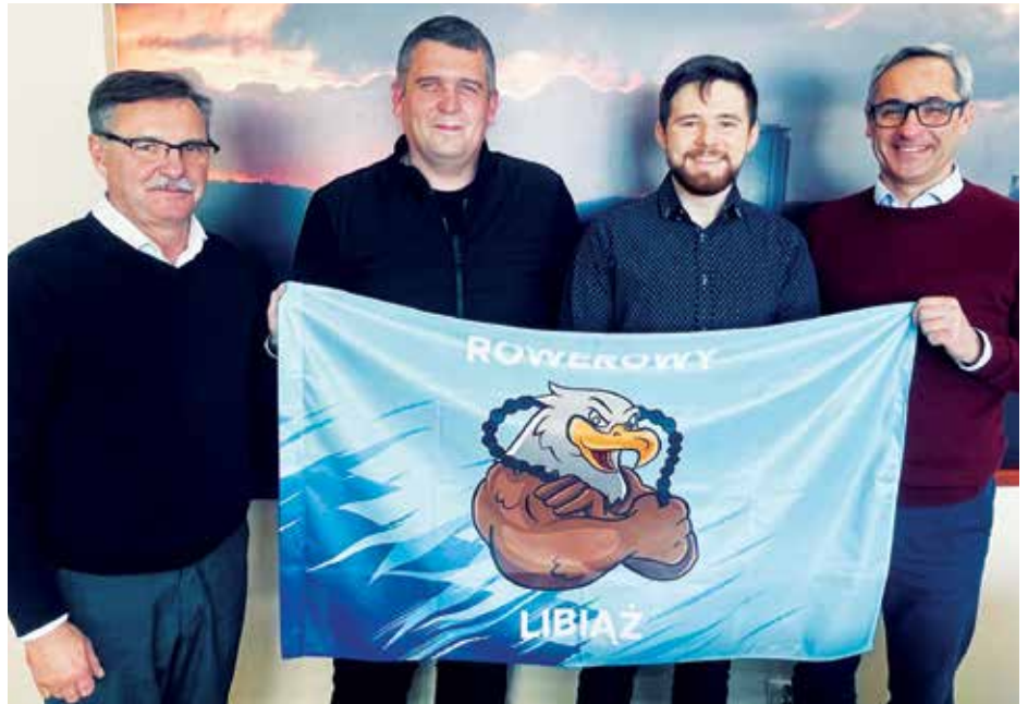
Przedstawiciele grupy Rowerowy Libiąż podczas spotkania z burmistrzem Libiąża i jego zastępcą.

Przypomniał, że dzięki współpracy gminy i powiatu chrzanowskiego otwarta została ścieżka rowerowa w lesie między wiaduktem w Kroczymie-