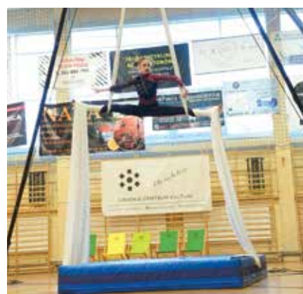
Pokaz akrobatyki sportowej

Wyniki: GRAND PRIX: BIRG – Dom Kultury w Kętach Skos Team – Zespół Taneczny Skos Euphoria – Studio Tańca Prestiż - Just Dance Studio Wyniki w poszczególnych kategoriach na www.lck.libiaz.pl