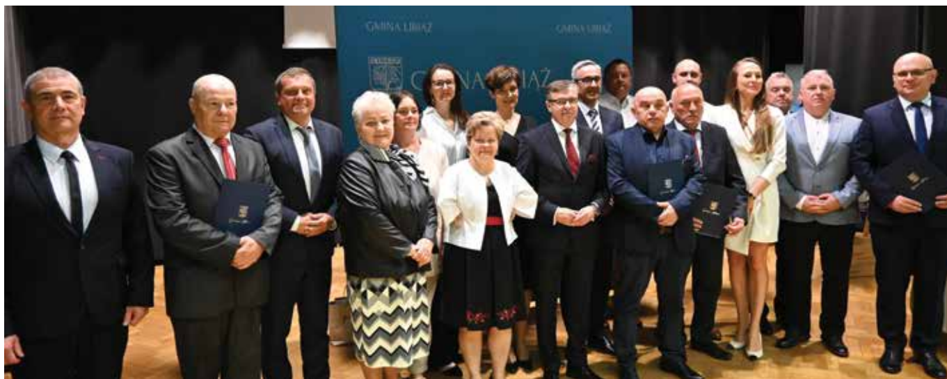
Inauguracyjna sesja Rady Miejskiej w Libiążu