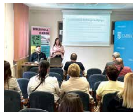
Prelekcja policjantów KWP w Krakowie

W czerwcu planowane jest zakończenie projektu, ale gmina już myśli o podjęciu kolejnych działań na rzecz wsparcia zdrowia psychicznego dzieci i młodzieży.