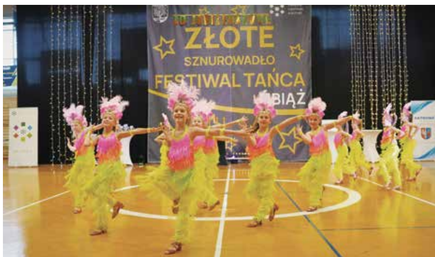
Występ zespołu Oreo