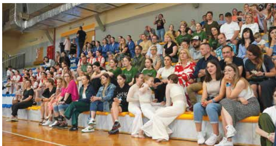
Publiczność podczas festiwalu