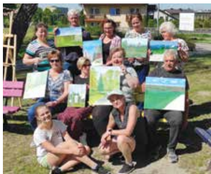
Uczestnicy majowego pleneru