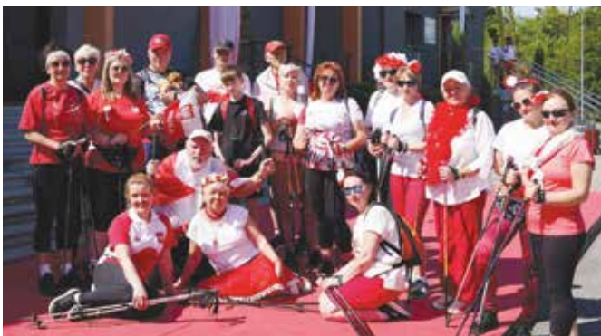
Uczestnicy marszu nordic walking

złożeniu kwiatów pod pomnikiem Tadeusza Kościuszki, barwny korowód przeszedł na Plac Słoneczny. Tam, zgodnie z libiąską tradycją, mieszkańcy pod wodzą zespołu Bratkwie odtąpili poloneza.