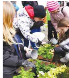
Wspólne sadzenie drzew i kwiatów przy budynku LCK