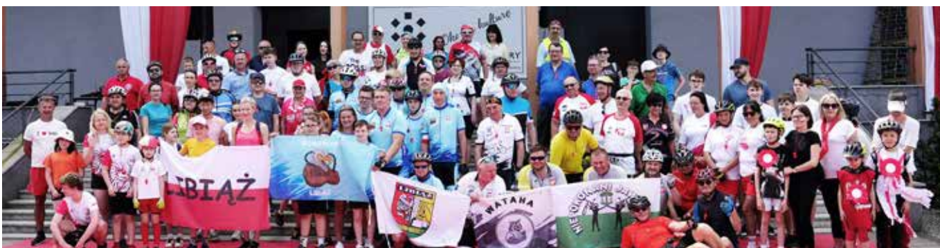
Uczestnicy Rajdu Rowerowego dla BIAŁO-CZERWONEJ