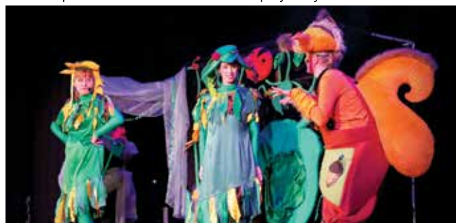
Spektakl o przygodach Frędzelki i Wiercipiętka