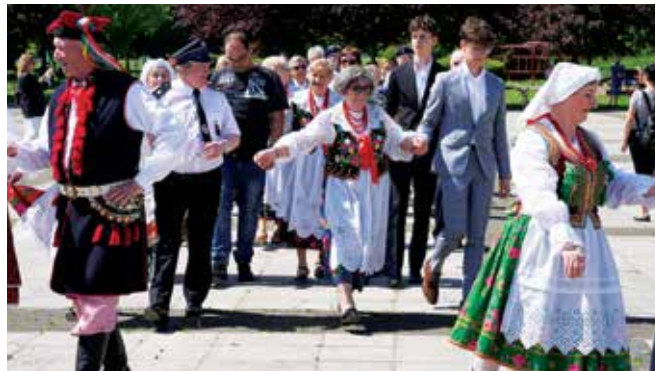
Tradycyjny polonez na Placu Słonecznym