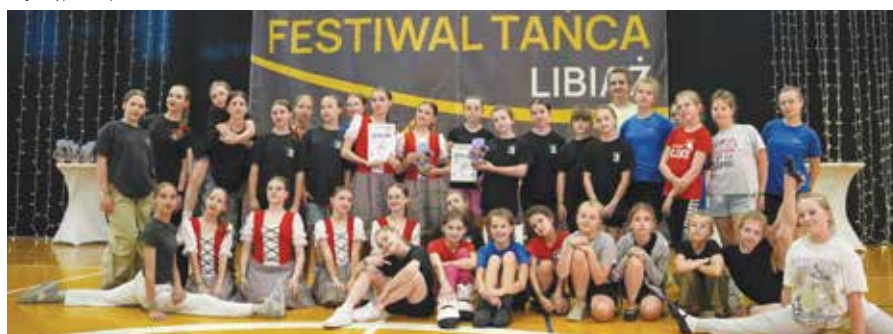
Pamiątkowe zdjęcie uczestników festiwalu