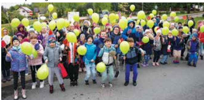
Dzień Ziemi w LCK