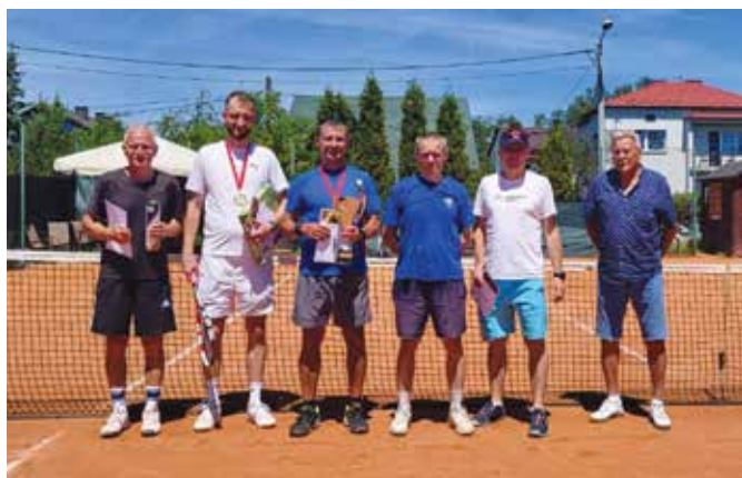
Uczestnicy turnieju tenisa ziemnego