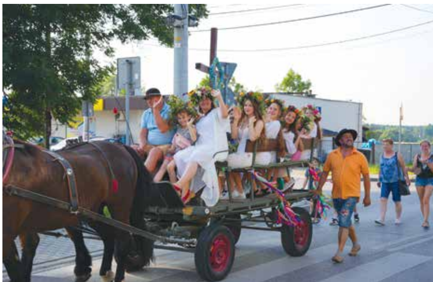
Korowód zmierzający nad Wisłę

Atrakcji, szczególnie dla najmłodszych, nie brakowało. Był Festiwal Kolorów Holi, dmuchańce, gry i zabawy, malowanie