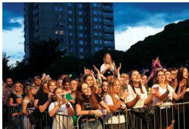
Publiczność podczas występu Oskara Cymśa