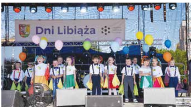
Uczestnicy przeglądu Twórczości Dzieci i Młodzieży z naszej gminy