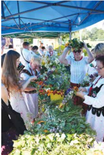
Warsztaty wicia wianków