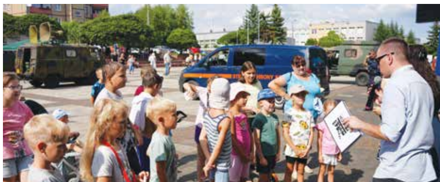
Konkurs historyczny dla uczestników pikniku

Południowy Koncern Węglowy i Wodociągi Chrzanowskie. Nie zabrakło quizów i konkursów historycznych z nagrodami, a Szachty Libiąskie zaprezentowały pokaz tresury psów.