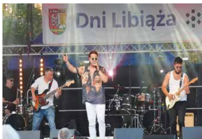
Koncert zespołu Ludzie