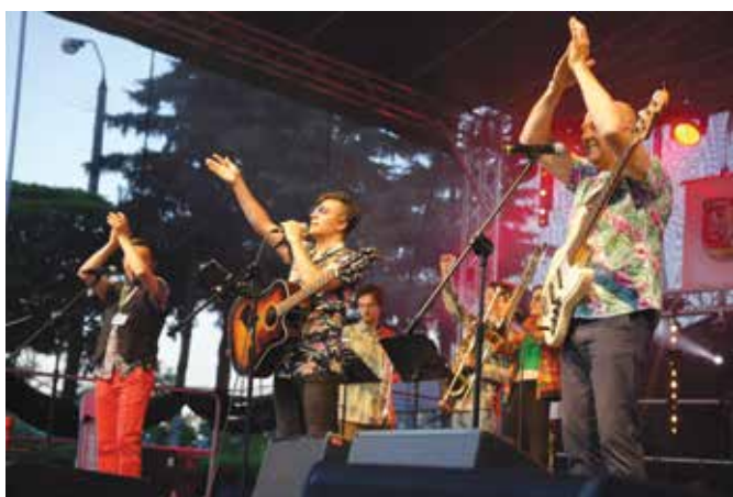
Zespół Rumba Wachaca