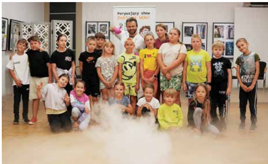
Wystrzałowe warsztaty szalonego naukowca – Doktora WOW

W tym roku zajęcia odbywają się pod nazwą „Wakacje w chmurach”. Jest ona związana z projektem, na realizację którego LCK otrzymało dotację w wysokości 59 tys. zł z Ministerstwa Kultury i Dziedzictwa Narodowego. W ramach inicjatywy zainspirowanej historią libiąskiej szkoły szybowcowej, zorganizowany zostanie także