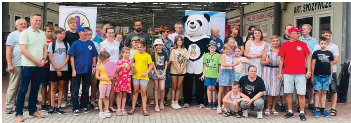
Uczestnicy spotkania integracyjnego

Było dużo śmiechu, dobrej muzyki, świetnej zabawy i zdrowych przekąsek oraz konkursy z nagrodami. Dobrze bawiły się zarówno dzieci jak i dorośli.