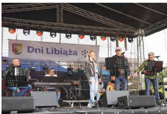
Występ grupy Słowem malowane