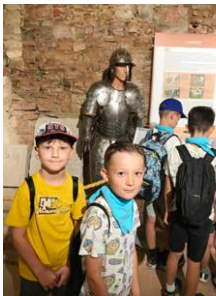
Wycieczka na Zamek Lipowiec