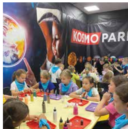
Wycieczka do Kosmoparku