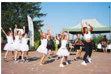
Występ grupy teatralnej LCK „Teatranki”