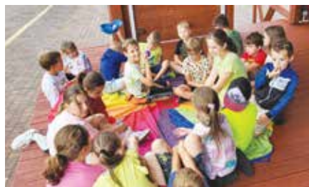
Wakacyjne zajęcia w Gromcu