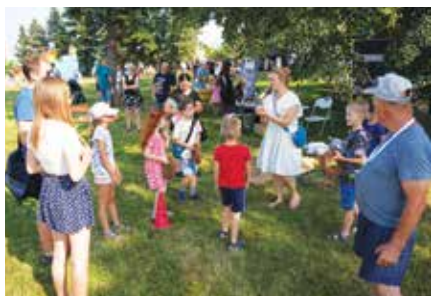
Animacje dla dzieci

Sponsorem Głównym imprezy była firma Operator Gazociągów Przesyłowych GAZ-SYSTEM S.A. www.gaz-system.pl