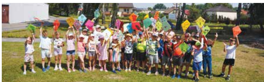
Uczestnicy „Wakacji w chmurach”