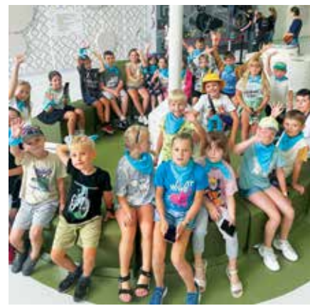
Wyjazd do Małopolskiego Centrum Nauki Cogiteon

W powodu remontu Domu Kultury w Żarkach, dzieci z tego sołectwa są dowożone do LCK. Dużym zainteresowaniem cieszą się wycieczki. Wizyta w Centrum Nauki Cogiteon czy Kosmoparku w Częstochowie sprawiła wiele frajdy nie tylko najmłodszym, ale także ich opiekunom.