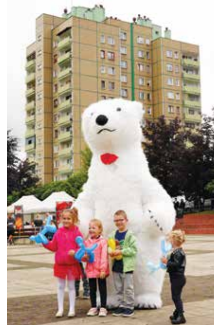
Pamiętkowe zdjęcie z misiem