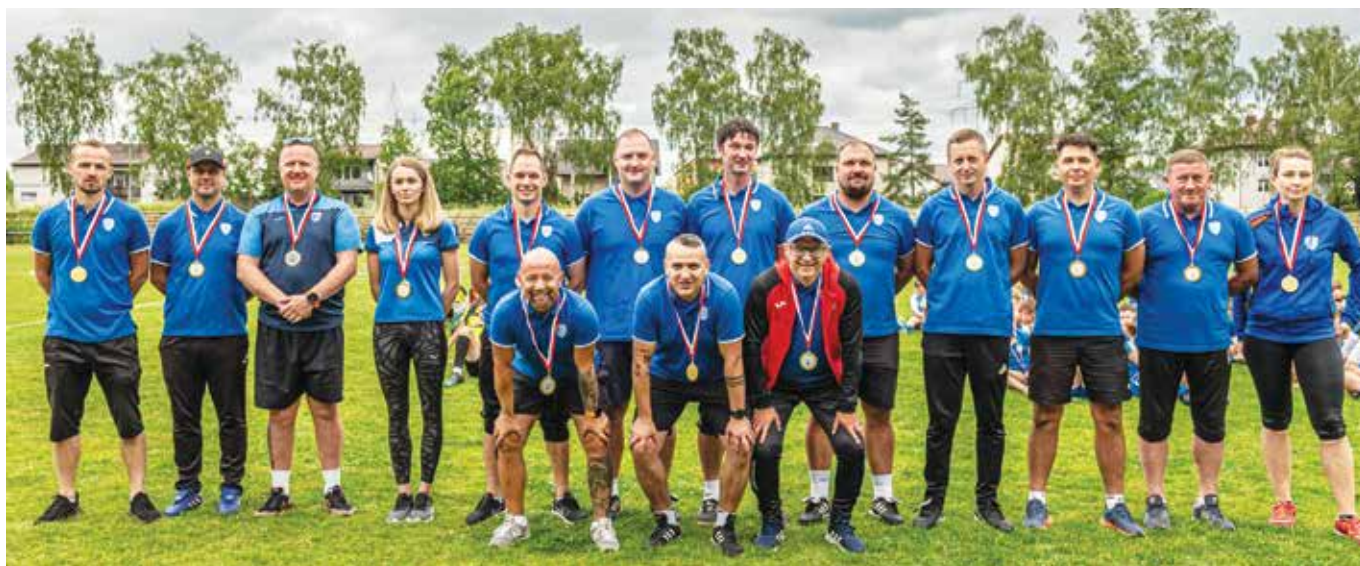
Pamiętkowe zdjęcie trenerów Górnika

Z tej okazji pracownicy, współpracownicy i sympatycy klubu, wychowankowie i ich rodzice, a także zarząd i trenerzy wzięli udział w rodzinnym pikniku. Po części oficjalnej,