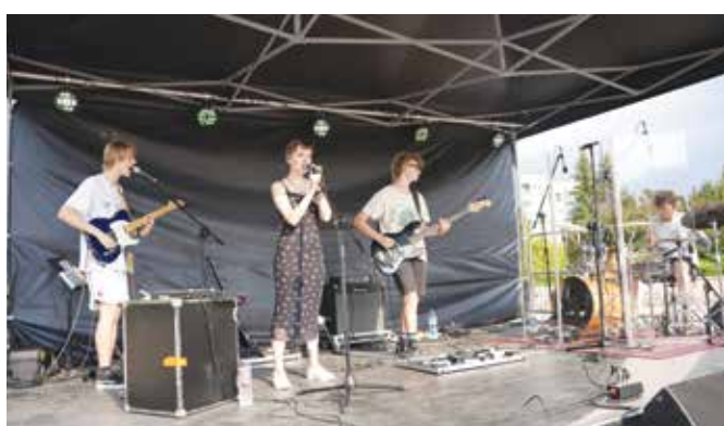
Koncert zespołu Zautek