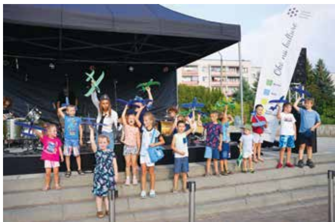
Puszczanie styropianowych modeli samolotów