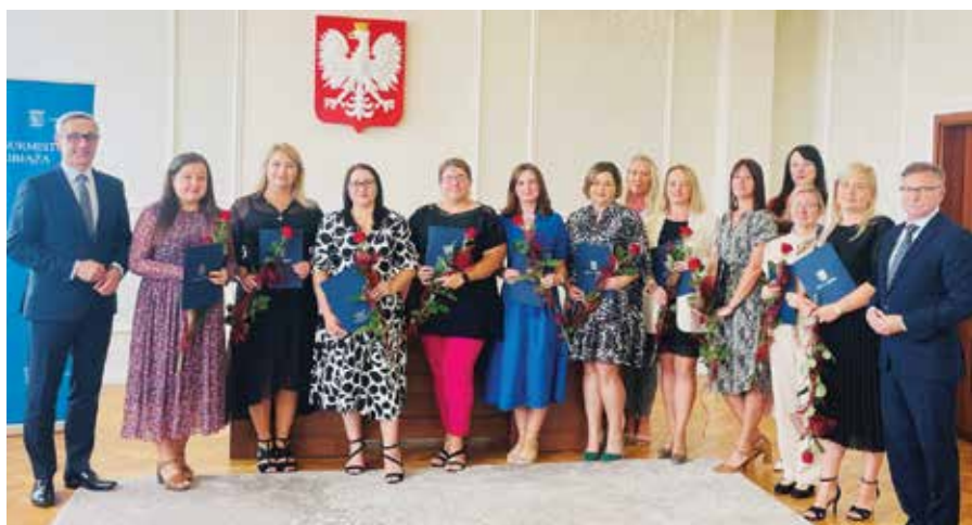
Spotkanie z awansowanymi nauczycielkami