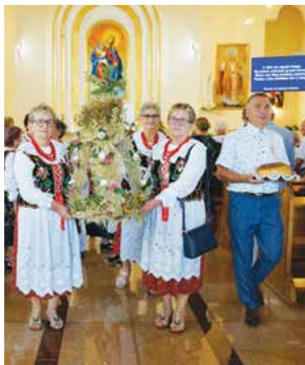
Msza św. w kościele w Gromcu

Przed uczestnikami wystąpiła również grupa teatralno-kabaretowa UTW w Libiążu. Impreza zakończyła się biesiadą pod gwiazdami.