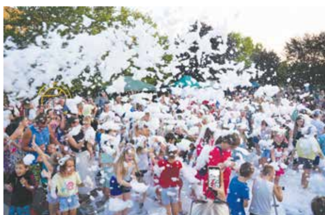
Taniec w chmurach - Piana Party