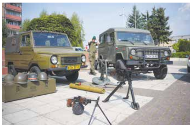
Stoisko Prywatnego Muzeum Techniki Wojskowej w Rajsku