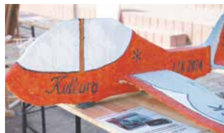
Wykonany podczas wakacyjnych zajęć model szybowca

Dofinansowano ze środków Ministra Kultury i Dziedzictwa Narodowego w ramach programu Narodowego Centrum Kultury: Kultura – Interwencje. Edycja 2024