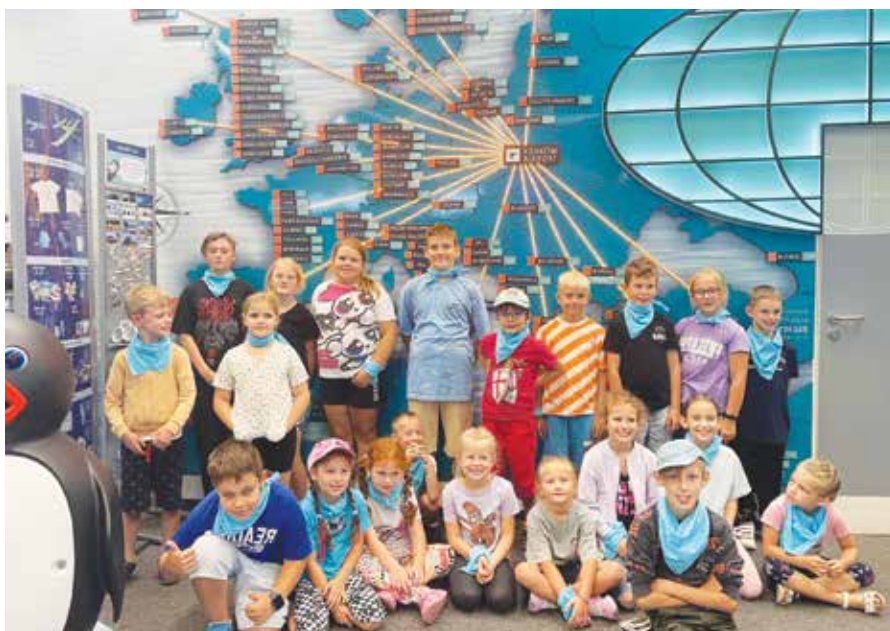
Wycieczka do Centrum Edukacji Lotniczej w Krakowie

Tegoroczne letnie zajęcia pod hasłem „Wakacje w chmurach” były związane z projektem realizowanym przez LCK. Temat przewodni stanowiła libiąska szkoła szybowcowa i lotnictwo. W sierpniu dzieci składały modele samolotów, a podczas warsztatów ceramicznych – samodzielnie je lepily. Nie zabrakło gier, zabaw i konkursów na powietrzu. Intresujące były wycieczki, m.in. na górę szybowcową w Libiążu, do Centrum Edukacji Lotniczej w Krakowie, Muzeum Lotnictwa Polskiego w Krakowie i Jumpcity w Katowicach. Duże wrażenie na młodych mieszkańcach zrobiły projekcje w kinie sferycznym. Zajęcia odbywały się w LCK i w Gromcu, z powodu remontu Domu Kultury w Żarkach, dzieci z tego libiąskiego sołectwa były przywożone do Libiąża. Ostatnią częścią cyklu były Dni Otwar-