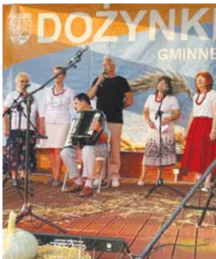
Występ grupy teatralno-kabaretowej UTW