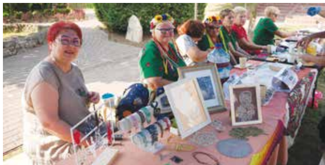
Stoisko sekcji koronki klockowej i KGW Libiąż