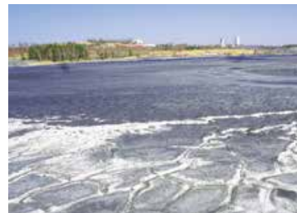
Teren hałdy w Libiążu

Blisko 20 tysięcy ton gruntu zostanie wykorzystanych do rekultywacji Obiektu Unieszkodliwiania Odpadów Wydobywczych przy ul. Krakowskiej w Libiążu czyli kopalnianej hałdy. Docelowo gmina Libiąż chce przejąć część terenu od kopalni, uzbroić go i utworzyć tu atrakcyjny teren inwestycyjny.