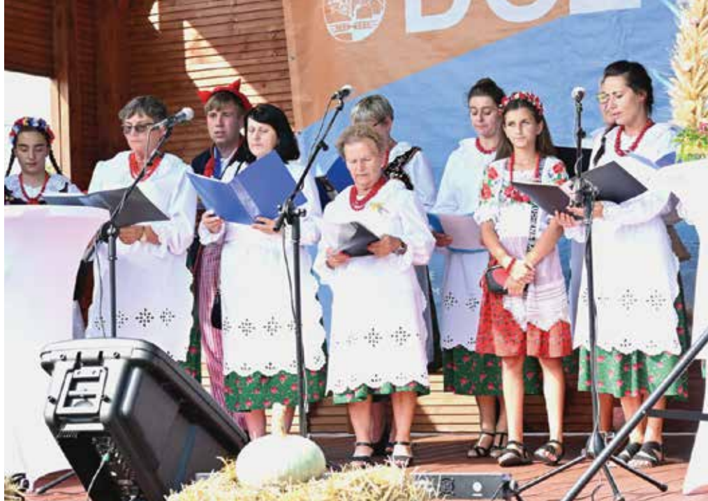
Występ Zespołu Śpiewaczego „Gromcaneczki”