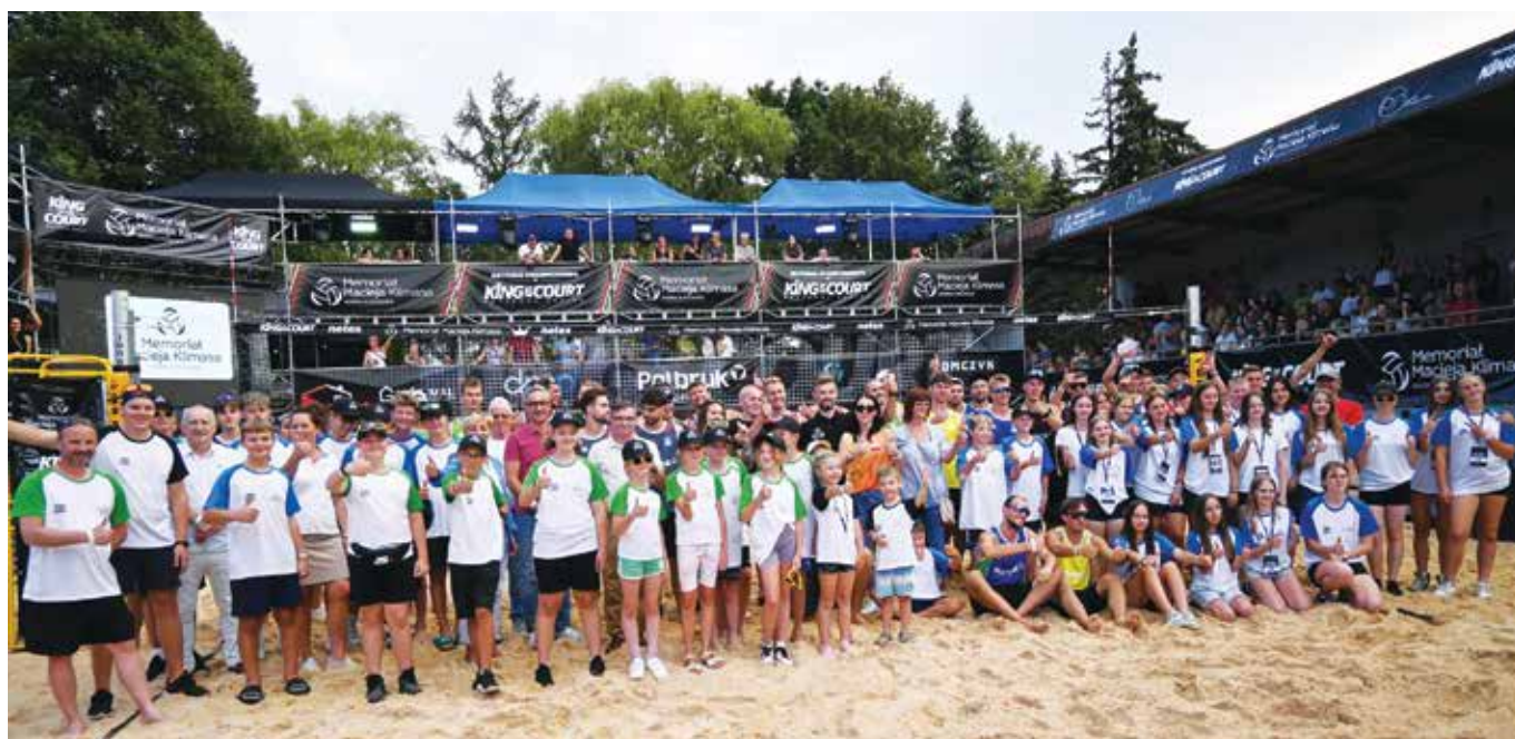
Organizatorzy, wolontariusze i uczestnicy Memoriału

Tegoroczna edycja memoriału trwała w dniach 26-27 lipca. Wydarzenie było transmitowane w sieci. Zawodnicy rywalizowali na specjalnie usypanym piaszczystym boisku na terenie Miejskiego Ośrodka Rekreacyjno-Sportowego. Widzowie mogli oglądać zmagania na specjalnie ustawionych trybunach. Poza rywalizacją duetów w formule King of the Court, wiele emocji dostarczył mecz gwiazd, w którym wystąpili m.in. Fabian Drzyzga, Rafał Buszek, ikona polskiej siatkówki plażowej Mariusz Prudel oraz gość specjalny turnieju - pochodzący z Libiąża aktor Marcin Korcz.