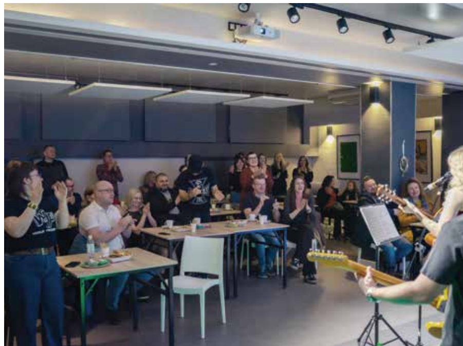
Urodzinowy koncert przyciągnął liczne grono fanów lokalnej muzyki

„Wersja Próbną”, czyli zespół złożony z młodych muzyków, którzy wielokrotnie występowali podczas wydarzeń organizowanych w naszej gminie, świętował piąte urodziny na Scenie Młodych Libiąskiego Centrum Kultury. Gratulujemy! Życzymy sukcesów i występów na największych polskich i światowych scenach. Kapeli będzie można posłuchać na nadchodzących Dniach Libiąża 2026 – szczegóły na s. 24.