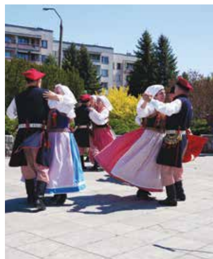
Na Placu Słonecznym zatańczył zespół „Bratkowie”