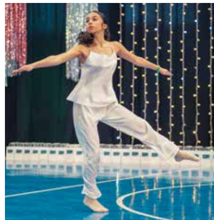
Solowe występy artystów