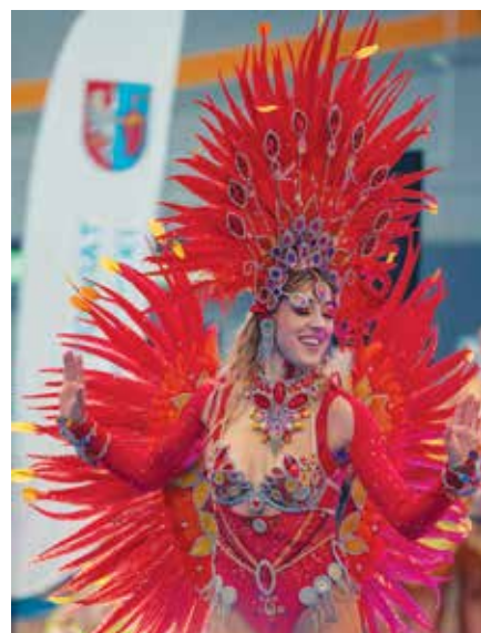
Pokaz taneczny „Baila Dance Show”