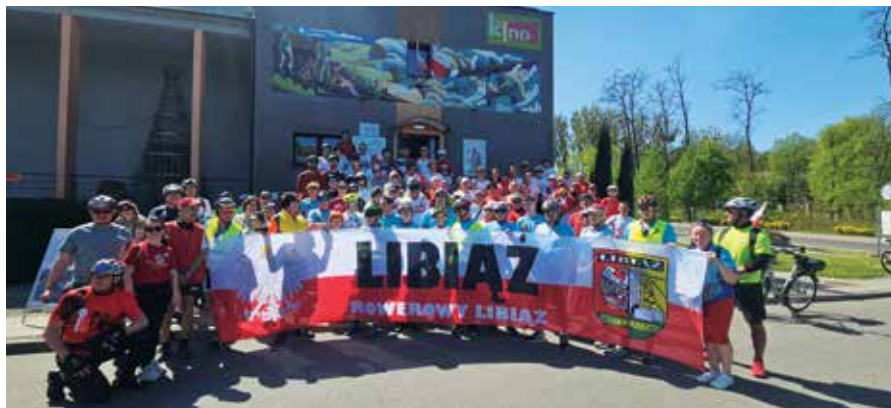
Uczestnicy rajdu rowerowego