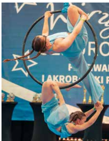
Akrobatyka na kole wymaga odwagi