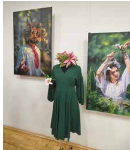
Wystawa inspirowana słowiańskimi tradycjami