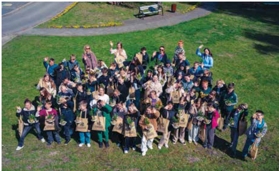
Uczestnicy tegorocznego Dnia Ziemi w LCK

W organizację Dnia Ziemi włączyła się firma Miki – lider zielonych zmian oraz Związek Międzygminny „Gospodarka Komunalna” w Chrzanowie.