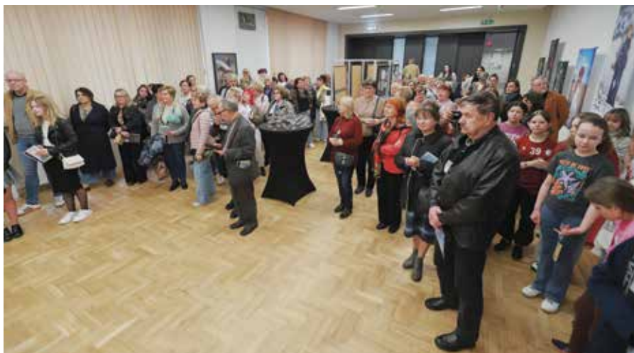
Wernisaże cieszą się dużym zainteresowaniem miłośników sztuki