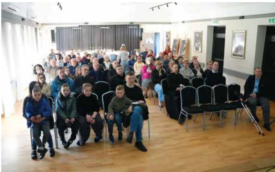
Mieszkańcy i pasjonaci historii podczas prelekcji archeologicznej w Domu Kultury w Żarkach

nych prowadzonych w rejonie Żarek-Ziajek. Nie zabrakło ciekawostek i pytań o to, co jeszcze może skrywać ziemia pod naszymi stopami.