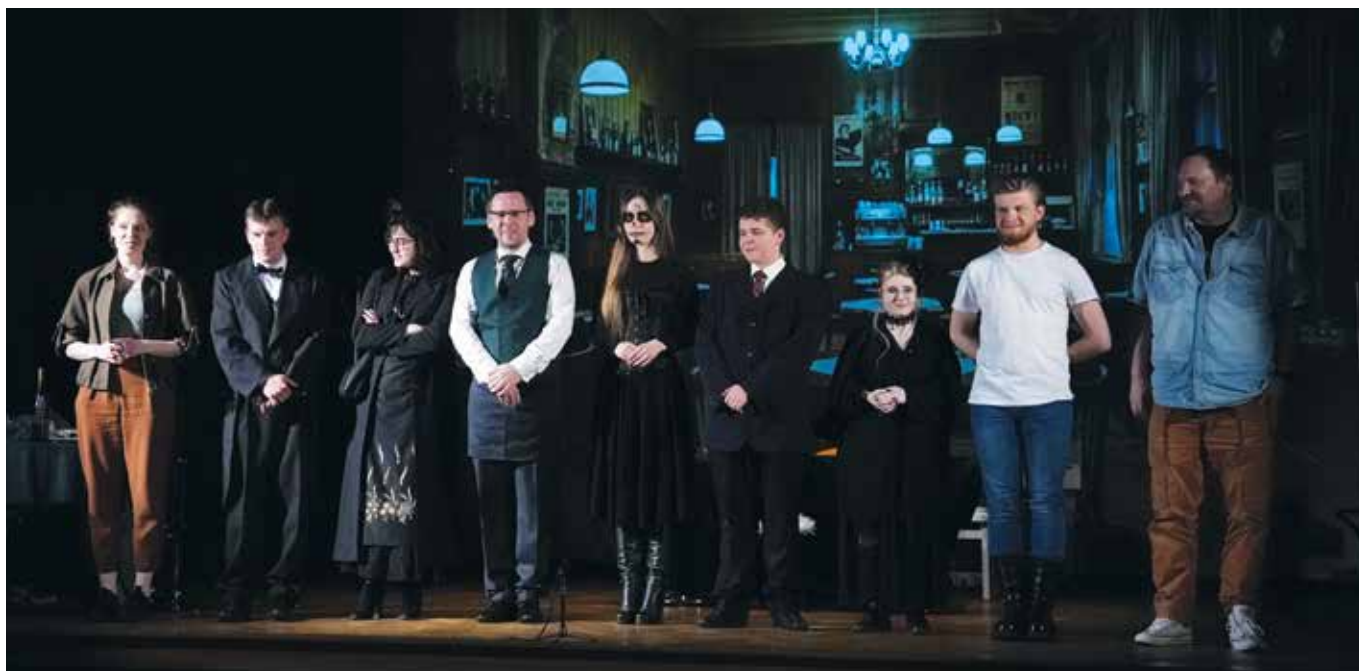
Członkowie grupy teatralnej „Scena Zasole” z Osiedlowego Domu Kultury Zasole w Oświęcimiu

Salwy śmiechu i gromkie brawa – tak publiczność przyjęła Grupę Kabaretową „Z górki” z Uniwersytetu Trzeciego Wieku w Libiążu podczas Chrzanowskiej Wiosny Artystycznej Seniorów.