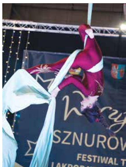
Efektowne akrobacje nad ziemią