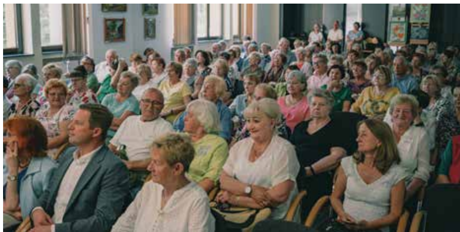
Zakończenie kolejnego semestru UTW w Libiążu