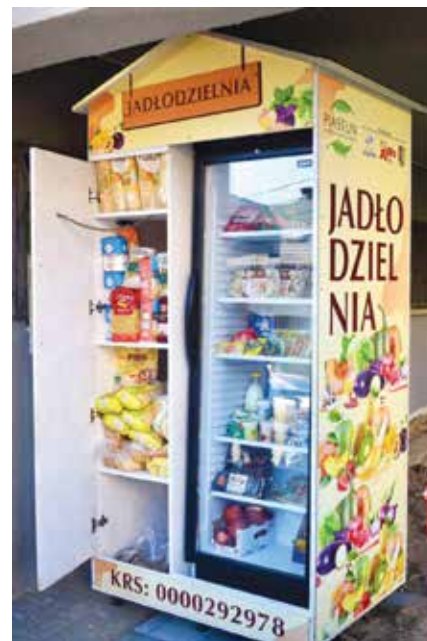
Lodówka ustawiona przy MCM

nowek-Zajęc apeluje, by do lodówki trafiły wyłącznie produkty dobrej jakości.