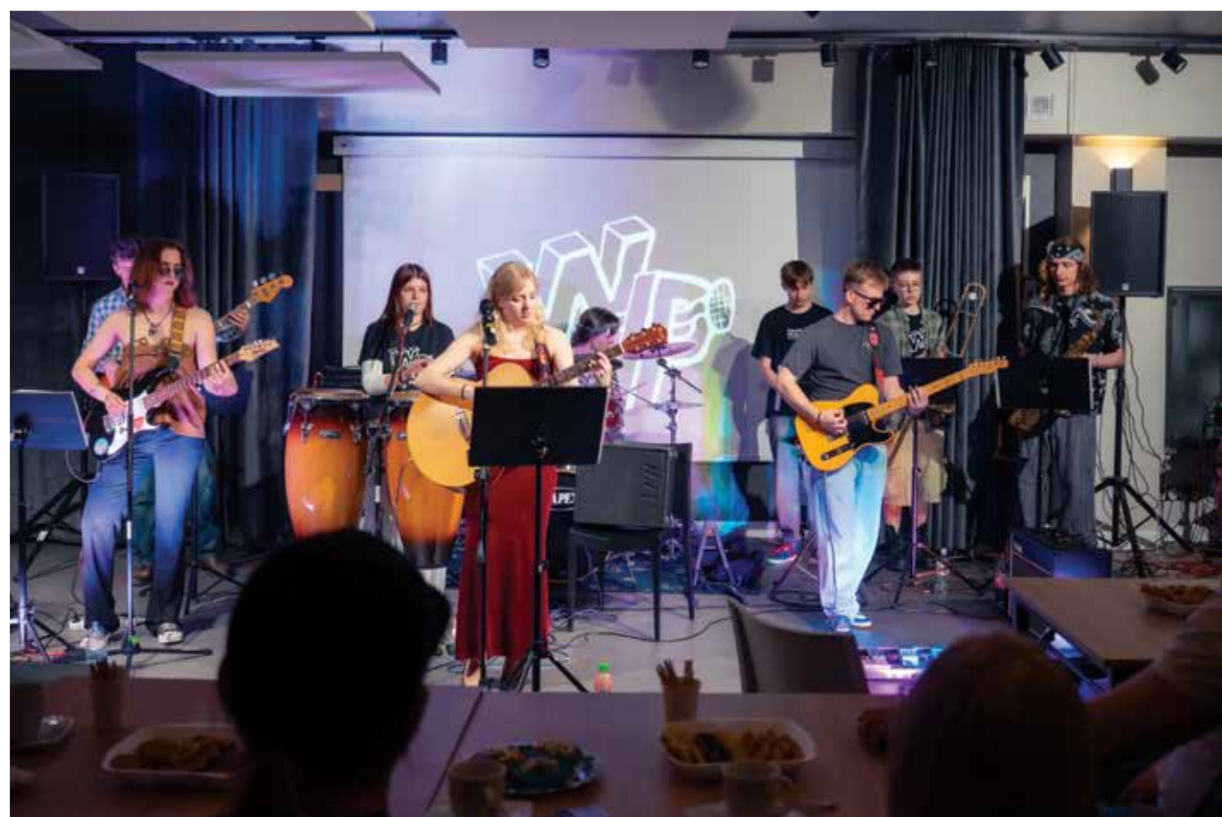
Zespół „Wersja Próbną” w pełnym składzie podczas swojego święta na Scenie Młodych