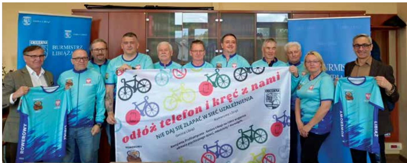
Grupa Rowerowy Libiąż podczas spotkania z burmistrzem Libiąża i jego zastępcą

Grupa Rowerowy Libiąż, która z roku na rok działa coraz prężniej, włączyła się do gminnej kampanii profilaktycznej „Odłóż telefon i żyj. Nie daj się złapać w sieć uzależnienia”. Pod hasłem „Odłóż telefon i kręć z Rowerowy Libiąż” rowerzyści zachęcają mieszkańców, szczególnie dzieci i młodzież, by ograniczyli czas spędzany przed ekranami telefonów, tabletów i komputerów, a zamiast tego postawili na aktywność fizyczną.