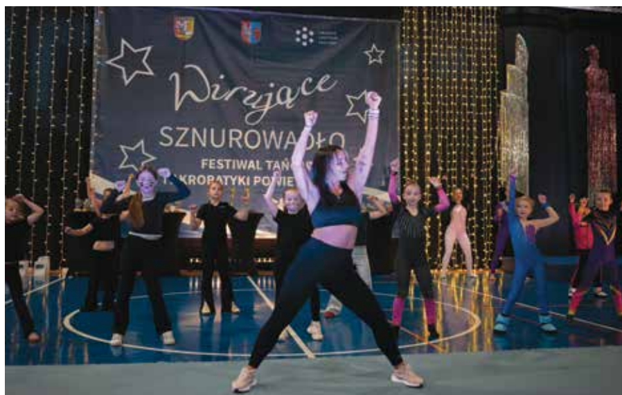
Pokaz grupy tanecznej LCK „Teatranki”