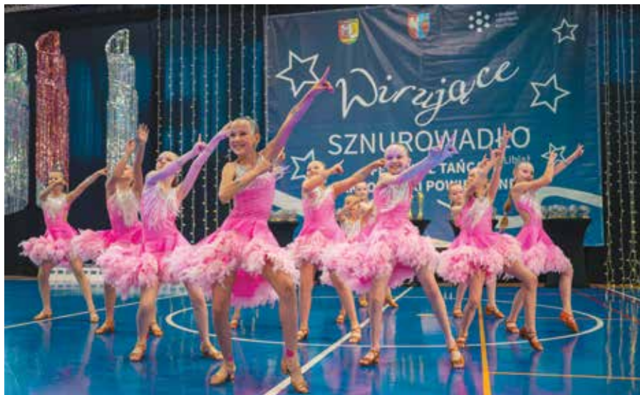
Widowiskowy i pełen pasji występ w wykonaniu małych tancerzy