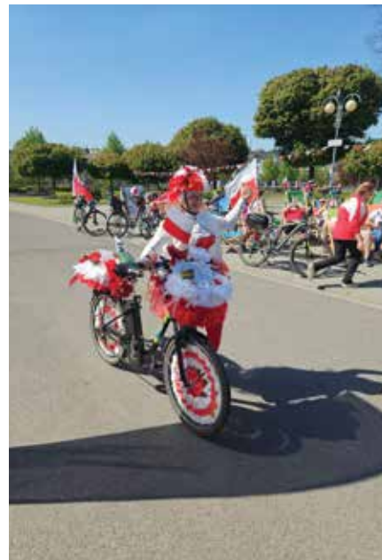
Na mecie uczestnicy w najciekawszych biało-czerwonych strojach otrzymali upominki