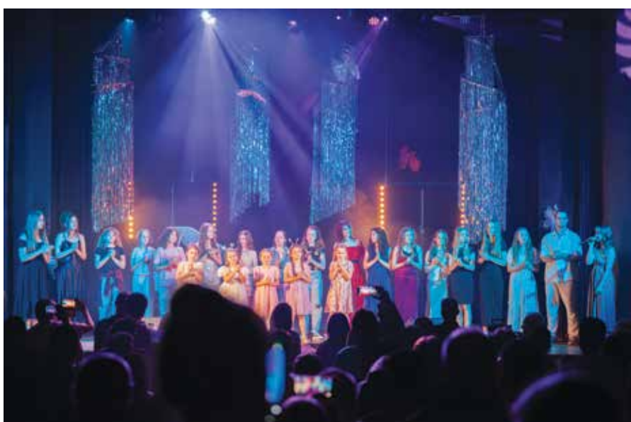
Twórcy koncertu na scenie LCK

Wydarzenie było jedną z wielu propozycji