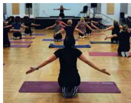
Ruch, uśmiech i chwila dla siebie

czas, zadbać o siebie i po prostu złapać pozytywny reset od codzienności.