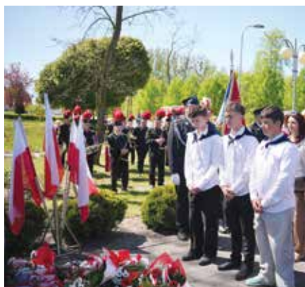
Uroczystość pod pomnikiem Tadeusza Kościuszki