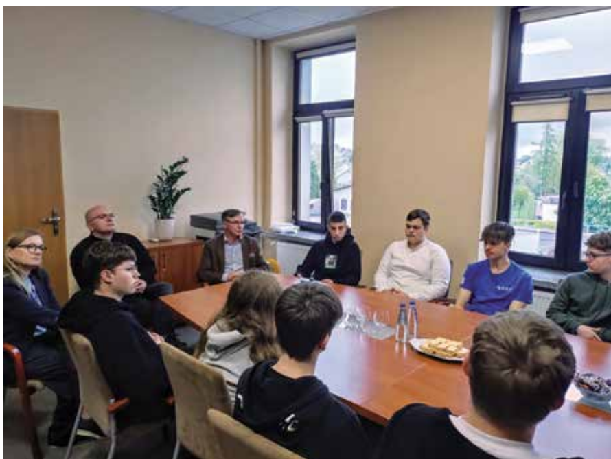
Spotkanie z młodzieżą w urzędzie

Tego typu spotkania mają szczególne znaczenie w edukacji młodych ludzi. Pozwalają nie tylko zdobyć praktyczną wiedzę o funkcjonowaniu samorządu, ale również zrozumieć, jak wiele odpowiedzialności wiąże się z pracą na rzecz mieszkańców. Bezpośredni kontakt z urzędnikami i możliwość obserwowania pracy urzędu „od środka” sprawiają, że uczniowie lepiej rozumieją mechanizmy działania administracji publicznej oraz rolę samorządu