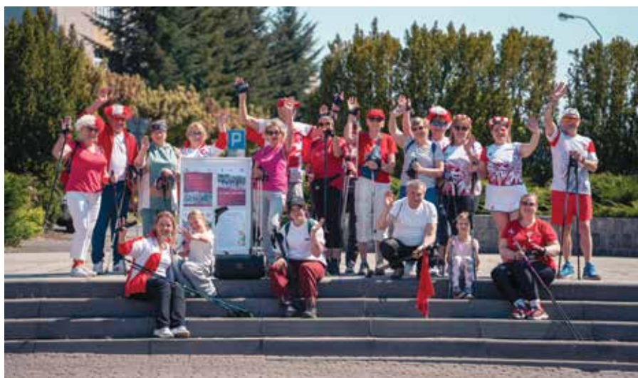
Pamiątkowe zdjęcie uczestników Marszu Nordic Walking "Dla Biało-Czerwonej" na Placu Słonecznym