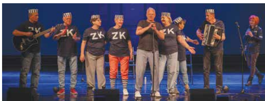
Grupa Kabaretowa „Z górki” podczas występu w Chrzanowie

Libiąscy seniorzy zaprezentowali swój program kabaretowy, po raz kolejny udowadniając, że energii, dystansu do siebie i scenicznej charyzmy można im tylko pozazdrościć. Występ po raz kolejny (wcześniej mogli go obejrzeć inni studenci, a także mieszkańcy Żarek podczas występu w domu kultury) spotkał się z bardzo ciepłym przyjęciem widowni, która nagrodziła artystów głośnymi brawami.