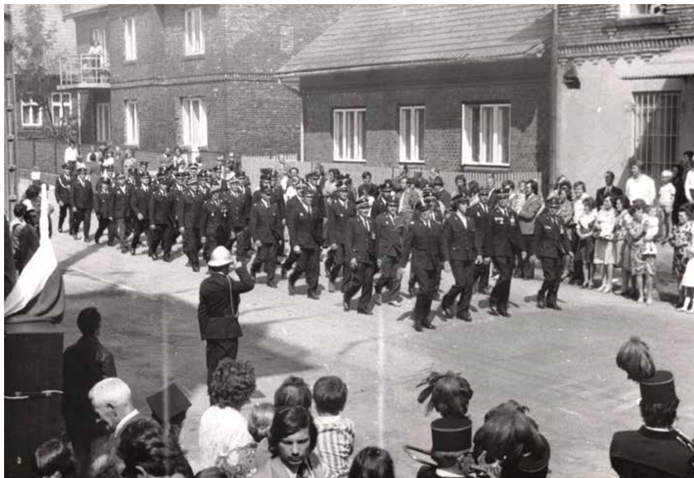
Obchody 50-lecia jednostki w 1976 r. Przemarsz strażaków ochotników ul. Floriańską.

Libiążanów – tak z Libiąża Wielkiego, Małego, jak i z Moczydła – od wieków przerażał żywioł ognia. Ze zgrozą wspomniano wielkie pożary z przełomu wieków XIX i XX, które trawiły ogromne obszary wsi, wiele dziesiątek domów i zabudowań gospodarczych. Żywioł pojawiał się najczęściej latem, w okresie żniw, a ogień rozprzestrzeniał się, korzystając z drewnianego budulca chałup, z łatwopalnych strzech i ze zgromadzonych zasobów siana i słomy. Przy suchej i wietrznej aurze pożar stawał się praktycznie niemożliwy do opanowania. Każde takie wydarzenie wpędzało dziesiątki libiąskich rodzin w nędzę. W tej sytuacji szukano różnych metod zabezpieczenia przed ogniem. Wymyślono m.in. funkcję stróża, który obserwował wieś – szczególnie w nocy, kiedy spadała czujność – i alarmował w przypadku zagrożenia. Korzystano również z opieki św. Floriana, któremu wybudowano na głównej drodze przez wieś kapliczkę (stąd dzisiejsza nazwa ul. Floriańskiej). Potrzebna była