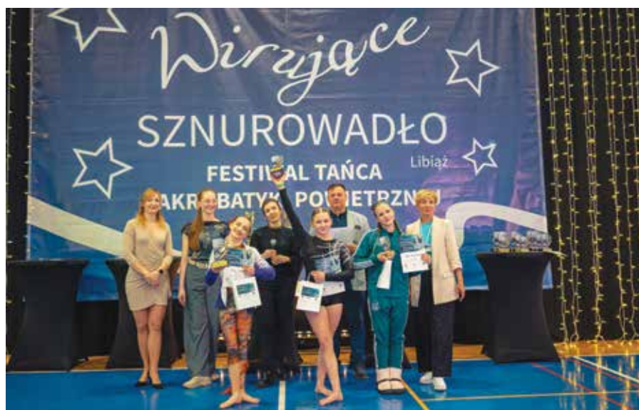
Wręczenie nagród laureatom XXII Festiwalu Tańca i Akrobatyki Powietrznej „Wirujące Sznurowadło”