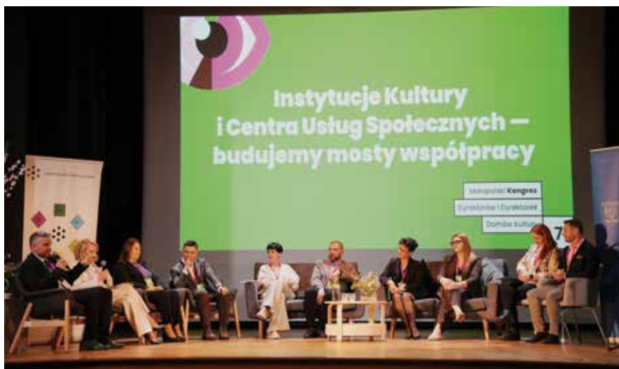
Debata dotycząca Centrów Usług Społecznych

Podczas kongresu dużo miejsca poświęcono również zmianom społecznym i demograficznym, roli Centrów Usług Społecznych oraz temu, jak wspierać młodych ludzi w rozwijaniu pasji i po-