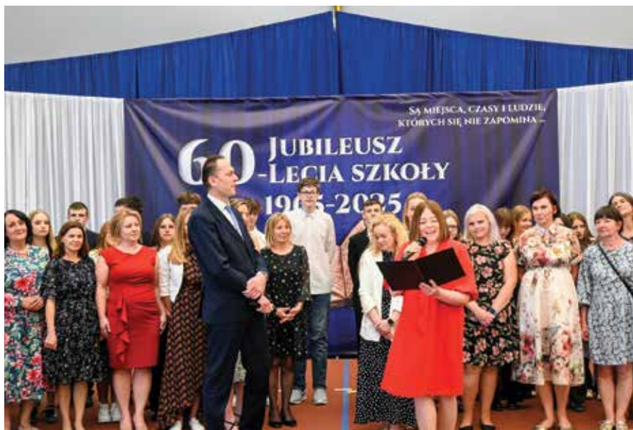
Jubileusz był ważnym wydarzeniem w historii ZSP w Żarkach

- Ta międzypokoleniowa ciągłość sprawia,