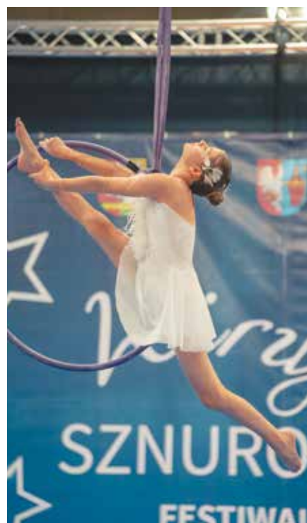
Akrobacje na kole