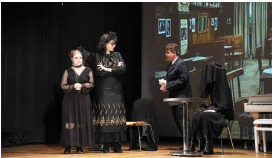
„Wdowy” na scenie Libiąskiego Centrum Kultury