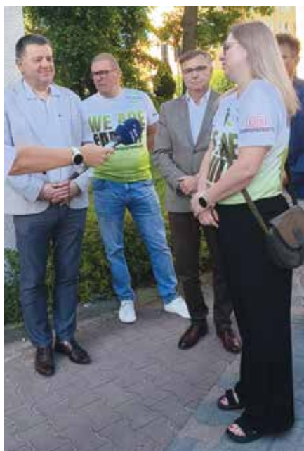
W otwarciu jadłodzielni wzięli udział przedstawiciele „Kontry”, fundacji „Piastun” oraz gminy

To szósta jadłodzielnia stworzona przez Fundację „Piastun - Wyrównywanie Szans”, tym razem we współpracy ze Związkiem Zawodowym Kontra, gminą Libiąż i wolontariuszami.