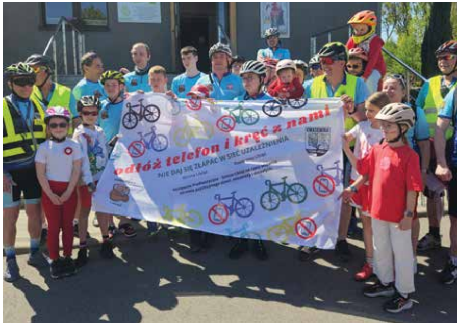
Tegoroczny Rajd dla Biało-Czerwonej był częścią gminnej kampanii profilaktycznej i odbywał się pod hasłem „Odtóż telefon i kręć z nami”.

Majówka w Libiążu upłynęła tradycyjnie, w patriotycznych barwach. Mieszkańcy pokazali, że pamiętają o pięknej historii naszego kraju, walce o odzyskanie niepodległości, ale też potrafią świętować na sportowo i na luzie.