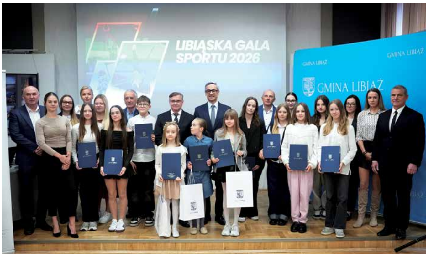
Uczestnicy Libiąskiej Gali Sportu 2026

Nie zabrakło także efektownego akcentu artystycznego. Galę uświetnił energetyczny pokaz Power Studio Chrzanów na scenie Libiąskiego Centrum Kultury.