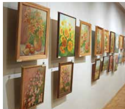
Malarstwo pełne barw i detali