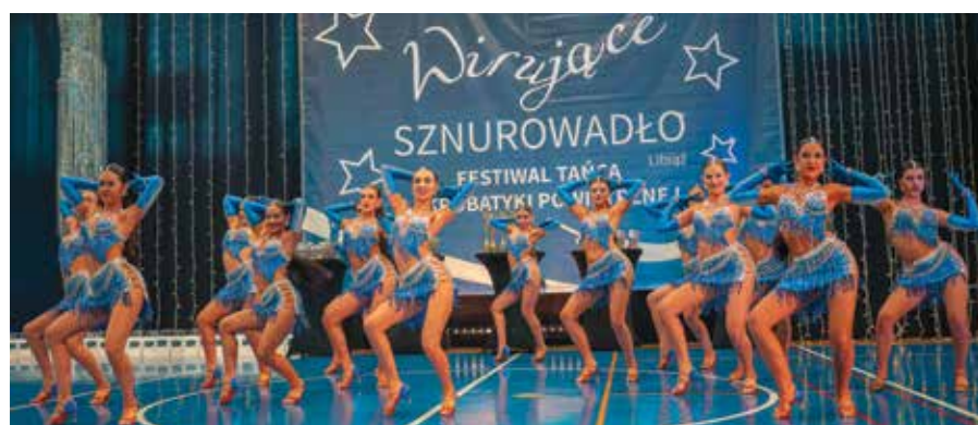
Czysta pasja i sceniczna energia tancerek

Dziękujemy wszystkim, którzy nam pomogli przy organizacji festiwalu, są to: