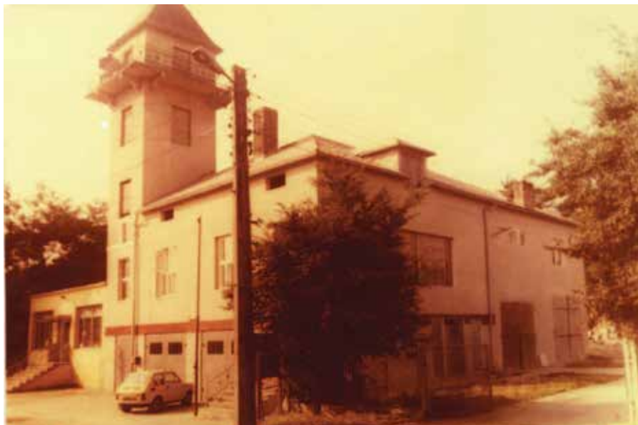
Remiza po rozbudowie - wczesne lata 80. XX w.

Żywotność Ochotniczej Straży Pożarnej w Libiążu jest cechą szczególną również w ostatnich latach. Straż jest istot-