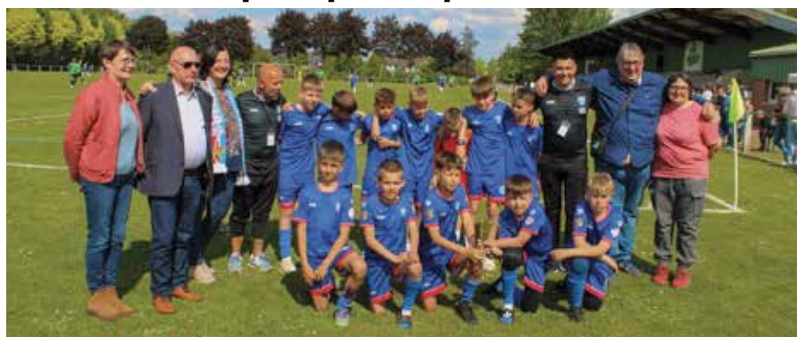
Turniej był jednym z elementów uczczenia współpracy polsko-francuskiej

Wyjazd był nie tylko okazją do sportowej rywalizacji, ale także do umacniania wie-