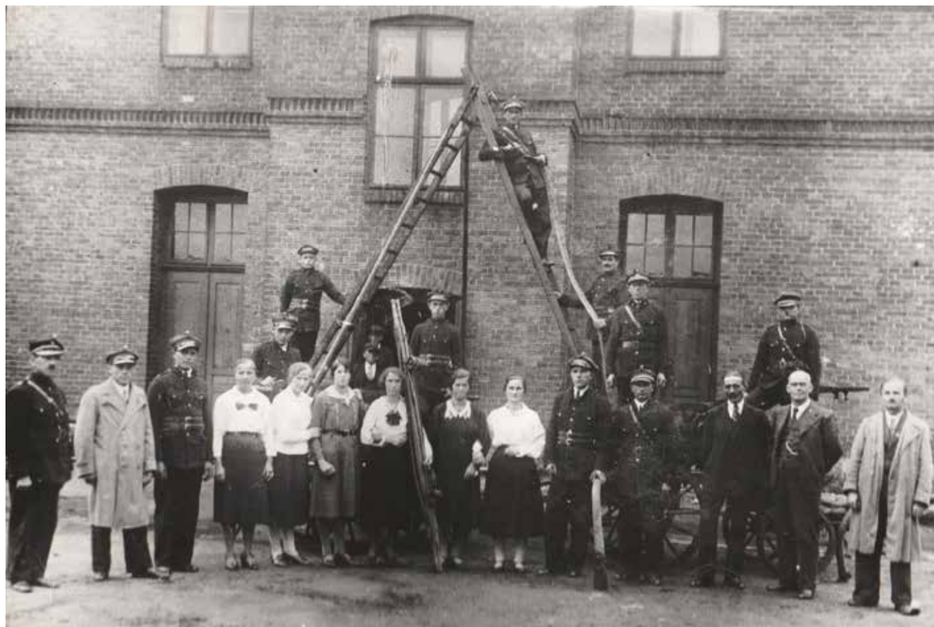
Strażacy z Libiąża Wielkiego wraz z członkiniami żeńskiej drużyny pożarniczo-sanitarnej przed budynkiem szkoły w roku 1929. Warto zwrócić uwagę na prezentowane wyposażenie, w tym doskonale widoczną drabinę Szczerbowskięgo.

oprac. dr Łukasz Płatek – autor monografii jubileuszowej „Libiąż Wielki i jego Straż”.