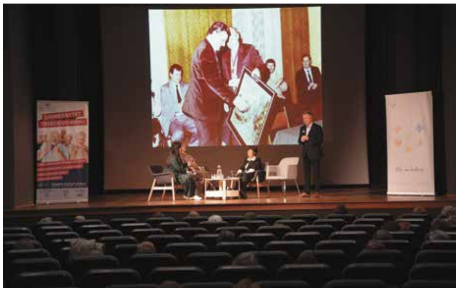
Podsumowanie 40-lecia partnerstwa miast: Libiąż i Rouvroy na scenie LCK