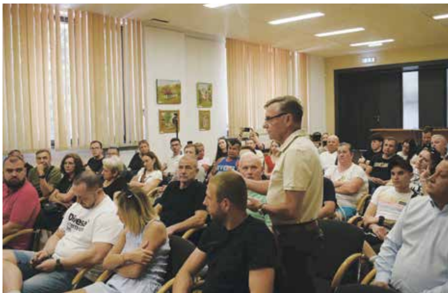
W spotkaniu z przedstawicielami SIM Zagłębie wzięli udział nie tylko mieszkańcy, ale też samorządowcy

W budynku nr 2 trwa montaż prefabrykowanych modułów mieszkalnych. Konieczna będzie także punktowa wymiana gruntu pod częścią płyty fundamentowej ze względu na warunki podłoża. Równolegle