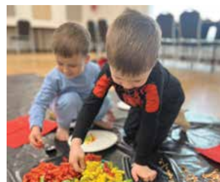
Dotykanie, mieszanie i poznawanie świata

Kolejne zajęcia sensoryczne w Gromcu w lipcu.